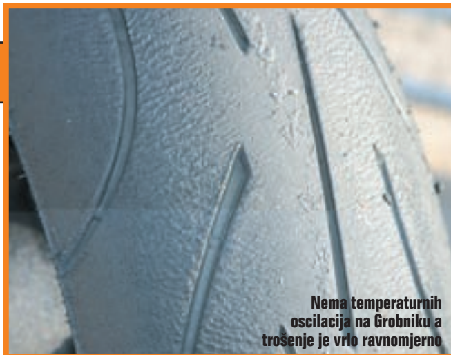
Nema temperaturnih oscilacija na Grobniku a trošenje je vrlo ravnomjerno

Gume ustvari prate trendove baš kao i motocikli. Hypersport tržište je promijenjeno, motocikli su dostigli omjer snage i težine 1:1, tako da guma ima težak zadatak povećati čvrstoću, poboljšati hvatljivost, ali i dobro izgledati. Stoga nije niti čudno da se tip guma kao što je nova Pilot Power već koristi kao prva ugradnja za mnoge moto-