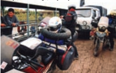
Rusija, delta Volge, trajekt preko Buzana

Ceste u Rusiji su dobre. Nakon Rostova na Donu počinje autoput, ali treba ipak paziti jer pješaci neprestano pretrčavaju preko puta. Zaustavljamo se na benzinskoj,