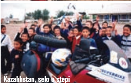
Kazahstan, selo u stepi