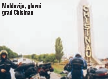
Moldavija, glavni grad Chisinau