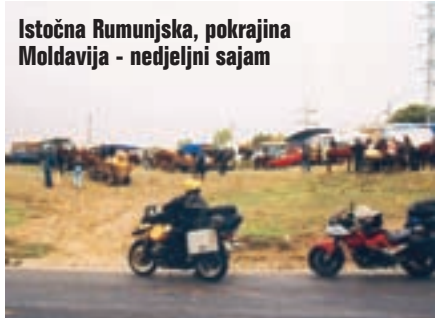
Istočna Rumunjska, pokrajina Moldavija - nedjeljni sajam

Neraspoloženi zbog lošeg vremena ulazimo u kišnjake. Današnji plan je proći ci-