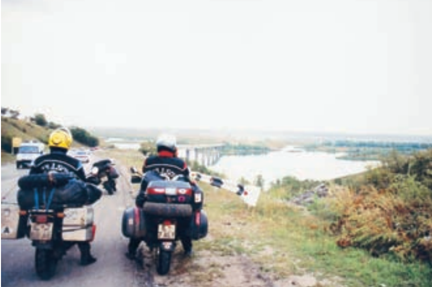
Rusija, preko rijeke Don