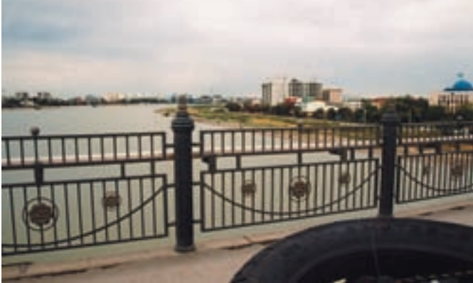
Kazakhstan, preko rijeke Oral u Aziju