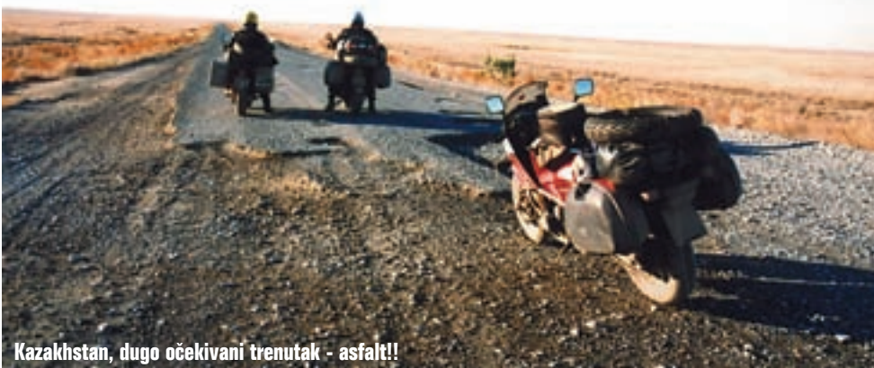
Kazakhstan, dugo očekivani trenutak - asfalt!!

Radi opširnosti teksta prisiljeni smo ga objavljivati u nastavcima, jer bi ovaj zanimljiv i uzbudljiv putopis ispunio pola našeg časopisa. Tako u ovom broju možete čitati prvi od tri dijela