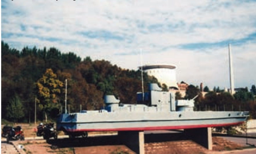
Rusija, Volgograd - sjećanje na najveću bitku 2. svjetskog rata