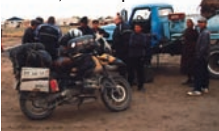
Kazakhstan, benzinska crpka