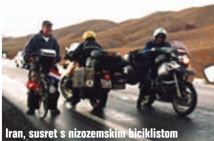
Iran, susret s nizozemskim biciklistom