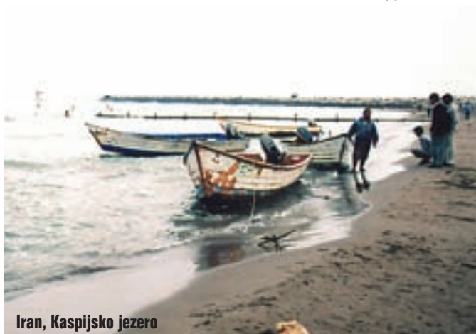
Iran, Kaspijsko jezero

špijunažu. Zna se što se događa ako te u Iranu optuže za špijunažu. Tražio je da mu pokažemo naše fotografske aparate. Martin je imao digitalni, pa mu je pokazao sve fotografije uz objašnjenje gdje je što fotografirano. Nakon pola sata neizvjesnosti inspektor nam je rekao: gospodo, vi ste slobodni, ovo je bio nespornost. Pitali smo ga da li možemo u Iranu slobodno fotografirati obzirom na ovu neugodnost. Možemo sve, osim policije i vojske. A baš to je i zadnje na svijetu što bismo fotografirali.