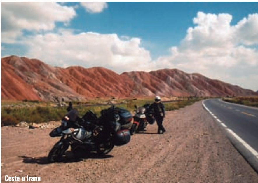
Ceste u Iranu

U noći je bilo hladno. Kada smo se ujutro probudili, vidjeli smo zašto. Šatori i motori bili su pod debelim slojem leda, nalazimo se na