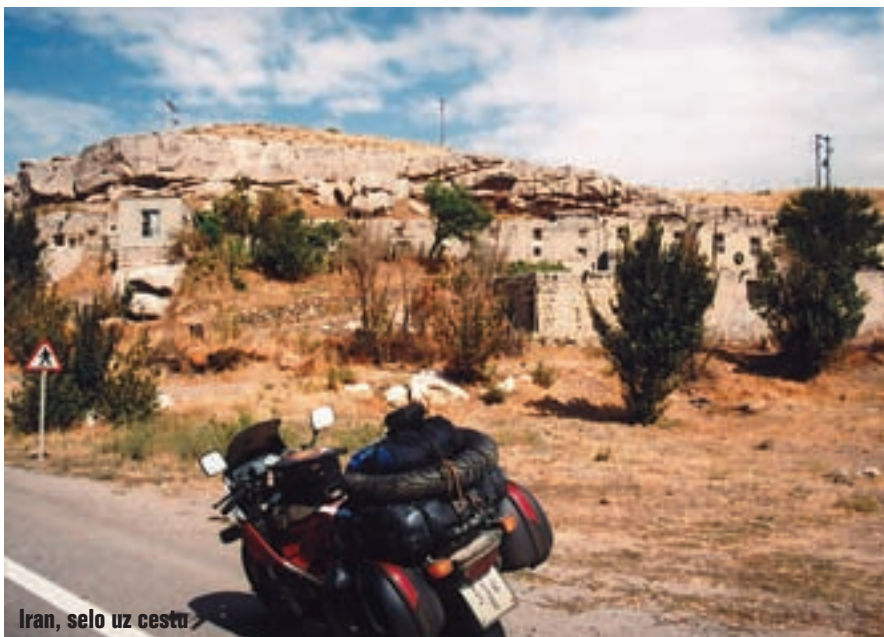
Iran, selo uz cestu

Nakon što smo izbjegli za dlaku, skrenuvši velikom brzinom na neutvrđenu bankinu, kamion koji je pretjecao drugi veliki kamion, zaustavili smo se podno Ararata. Zeleni pašnjaci, krave koje pasu, brdo prekriveno snijegom. Tri-