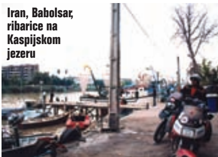
Iran, Babolsar, ribarice na Kaspijskom jezeru

nje, relativno brzo. Otkrivamo razlog tome, naime danas je petak, a to je muslimanska nedjelja. Dolazimo na središnji trg Imama Homeinija. Naravno da smo kao i svugdje opkoljeni masom ljudi. Tu su i šverceri novcem, a upravo njih i trebamo. Već od jučer pokušavamo promijeniti novac, ali ne uspijevamo, jer su banke zatvorene. U Teheranu se ne zadržavamo previše, razgledavamo samo jedan impozantni spomenik, kojeg neprestano vidam na televiziji o izvještajima iz Irana, te ulazimo na pravi autoput. Na početku autoputa veliki su znakovi za razne zabrane, između ostalog precrtan je i motocikl. Smijemo se, fotografiramo znak i, naravno, ignoriramo ga. Vozimo dosadnim autoputom po tmurnom vremenu, čak povremeno pada i kiša. Prolazimo pored Qazvina, a cilj nam je stići u Zanjan, što nam je i uspelo prije mraka. Vrlo lako smo našli bungalove, te uzeli jedan. Stajao je 296.000 riala za troje (oko 220 kuna), a imao je vrlo uređnu kupaonu s toplom vodom. Martinu i Georgu sam pravio društvo za večerom, pio sam samo čaj. Još osjećam posljedice jučerašnjeg sladoleda.