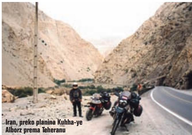
Iran, preko planina Kuhha-ye Alborz prema Teheranu

Još neko vrijeme vozimo obalom Kaspijskog jezera kroz manje gradove, ja sa mučnim u želucu od jučerašnjih sladoleda. S obale skrećemo u grad Amol, te dalje prema Teheranu kroz planine Elburs, pored vrha Demavend, visokog 5.604 metara. Predjeli su fascinantni, to su ogoljele visoke smeđe planine. Vozimo kroz klance, neprestano se penjemo, sve od Kaspijskog jezera koje leži u depresiji, tj. 28 metara ispod razine mora. Fascinantan je i promet koji je ovdje vrlo gust, a podivljali