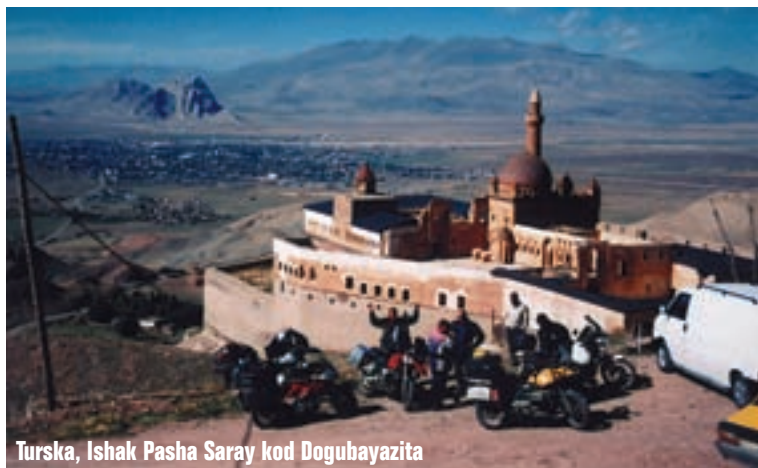
Turska, Ishak Pasha Saray kod Dogubayazita