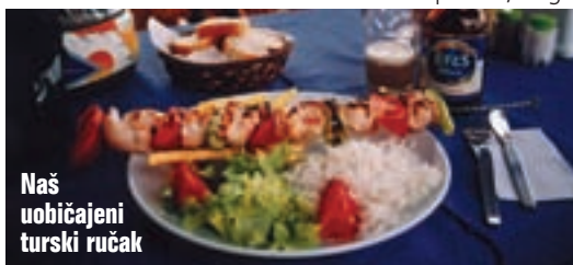
Naš uobičajeni turski ručak