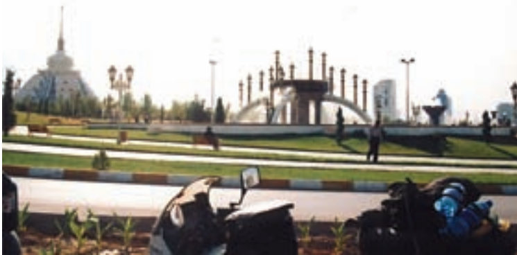
Turkmenistan, glavni grad Ašgabad