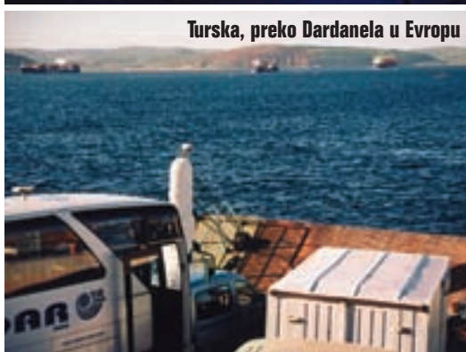
Turska, preko Dardanela u Evropu