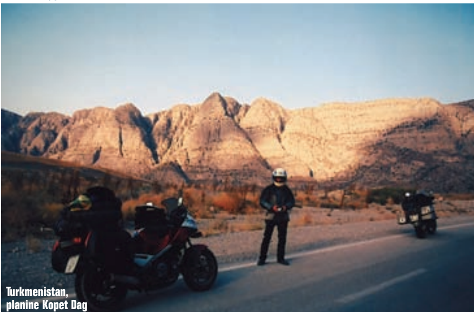
Turkmenistan, planine Kopet Dag

Našem putovanju se lagano bliži kraj. Stižemo u Iran, zemlju stvorenu za bikere, s odličnim cestama, bez radara, jeftinu, s fantastičnim panoramama