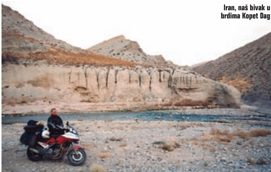
Iran, naš bivak u brdima Kopet Dag

oduševljen našim putovanjem. Onako prljavi promatramo elegantne šeike koji šeću hodnikom u snježnobijelim odorama. A mi bi tu spavali za 30 dolara. Dobro da su nas takve pustili unutra. Podižem kuplung-lamele koje me po dogovoru tu čekaju, a uskoro stiže Yulia Tambahajeva s kojom smo kontaktirali. Umjesto dogovorenih 30 dolara za pozive od nas traži po 50 dolara. Martin, bijesan takvim razvojem događaja, inzistira da momentalno palimo motore te da krenemo prema Iranu. Fotografiramo još centar grada, prilazi nam ljutit policajac i opet imamo problem. Uzima mi putovnicu i traži objašnjenje zašto fotografiram. Uspijem ga uvjeriti da smo obični turisti. Vraća mi putovnicu uz prijetnju da odmah moramo nestati. Sada nam je svima dosta ove