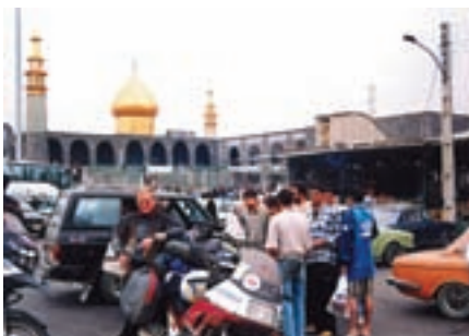
Iran, petak u Teheranu