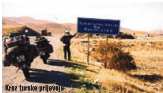
Kroz turske prijevoje

nadmorskoj visini od preko 2.000 metara. Izašlo je sunce i začas je bilo toplo, pa smo uživali u pogledu na kanjon rijeke Euphrat usred nedirnute prirode. Stali smo, skuhalo čaj za zagrijavanje, te nastavili prema Erzincanu, Sivasu, Sarkisli, sve do grada Kayseri. Dan nam je pokvarila policija koja nam je na potpuno ravnom komadu ceste, van naselja, bez prometa, izmjerila svima nešto preko 120 km/h. Dozvoljeno je 90 km/h. Traže 131.900.000 lira i ne žele dalje razgovarati. Mi protestiramo, nismo voljni platiti. Bez riječi uzimaju naše carnete i upisuju nešto u njih, te možemo nastaviti put.