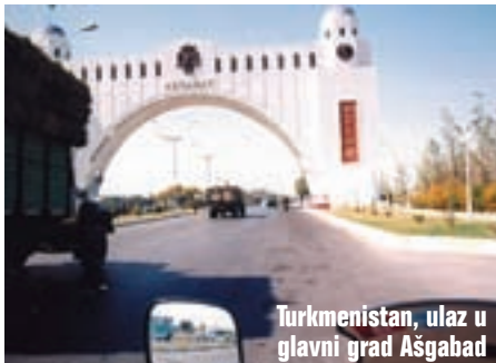
Turkmenistan, ulaz u glavni grad Ašgabat