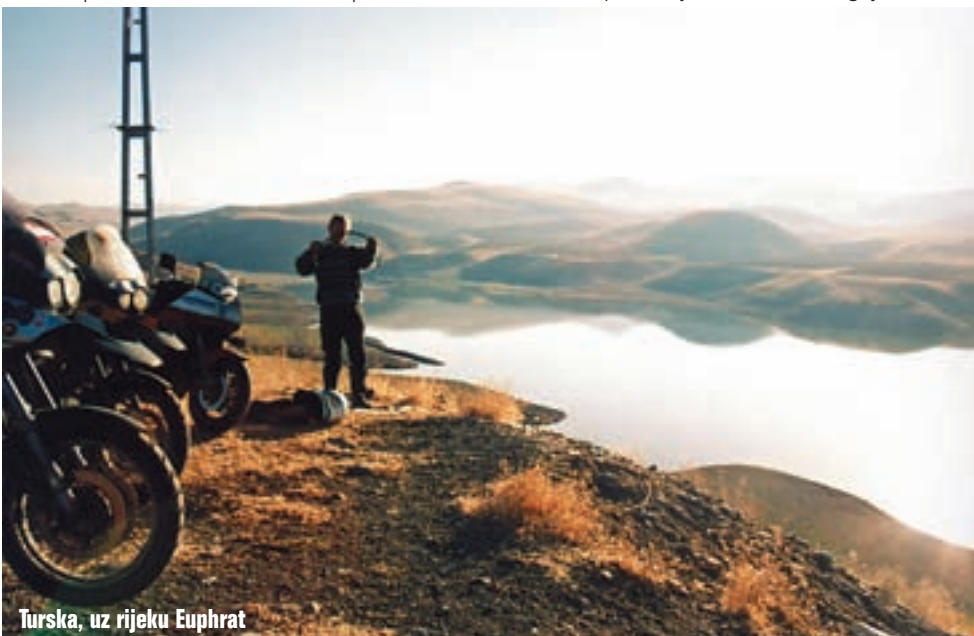
Turska, uz rijeku Euphrat

U noći je bilo nevrjeme. Pakiramo mokre stvari i vozimo prema sjeveru uz obalu Egej-