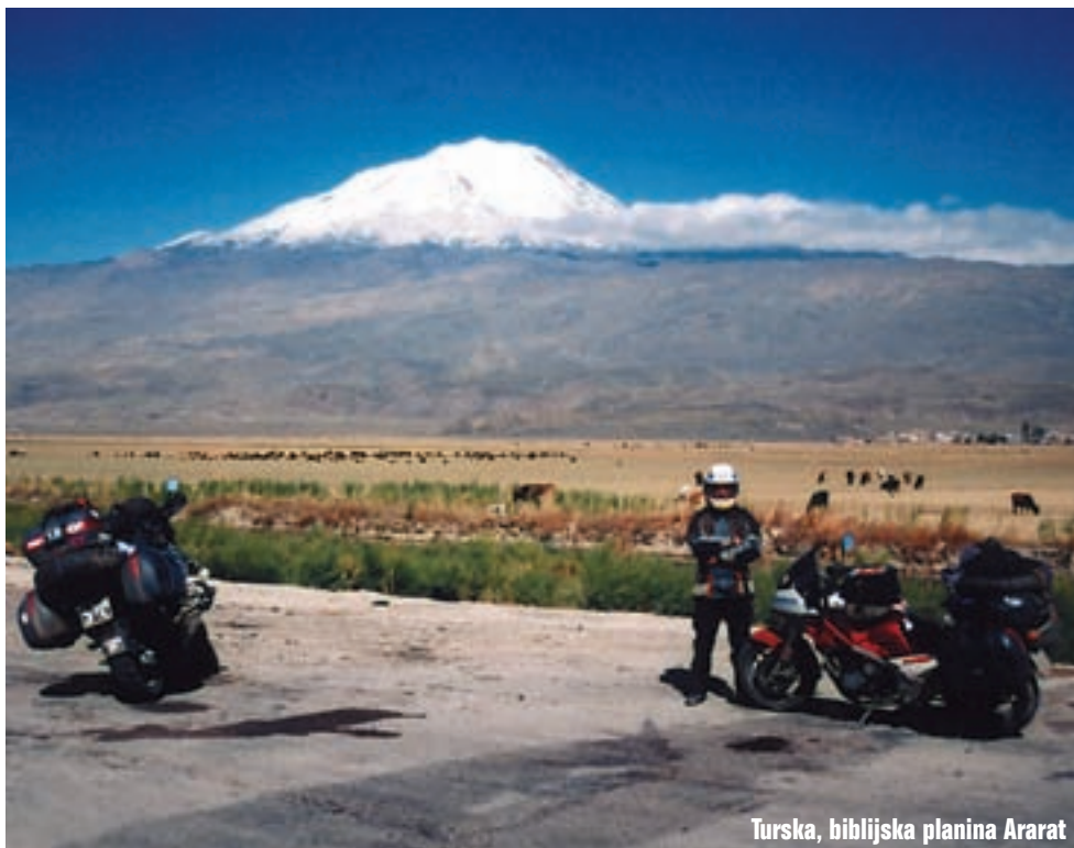
Turska, biblijska planina Ararat