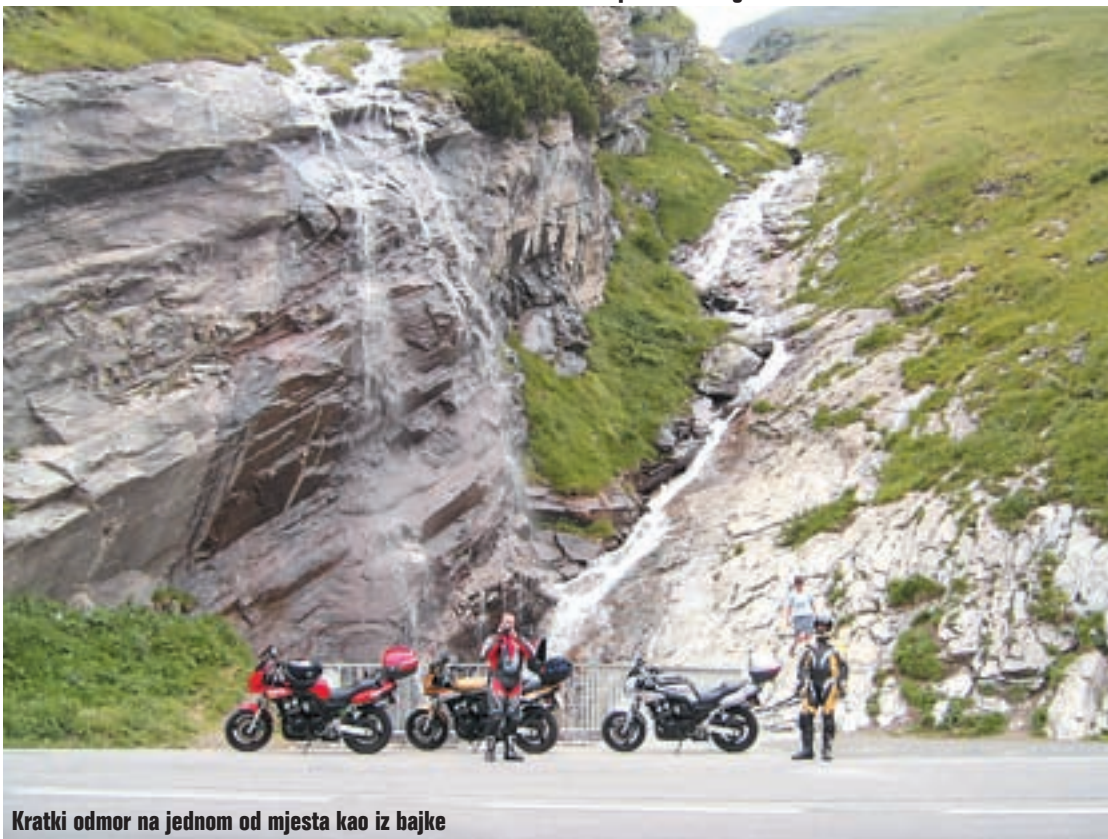
Kratki odmor na jednom od mjesta kao iz bajke

..na austrijskoj strani je Nassfeld i simpatičan pansion koji na svoj način poziva motocikliste na predah i okrjepu. Čista petica za originalnost