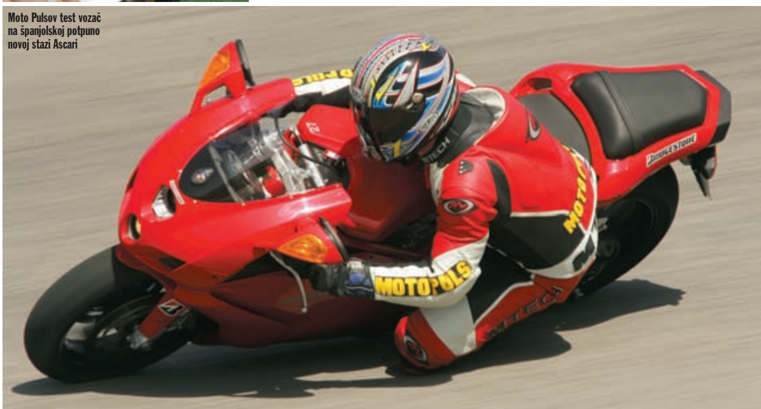
Moto Pulsov test vozač na španjolskoj potpuno novoj stazi Ascari

piste su brzi vezani zavoji, gdje se motocikl mora prebaciti s jedne na drugu stranu u što kraćem vremenskom periodu, što je guma također odradila sa odličnom ocjenom. Tehničari Bridgestonea naglašavaju da su zahvaljujući silikonu koji ulazi u smjesu gume postigli visoku kvalitetu gripa i u mokrim uvjetima, što na žalost nismo imali prilike isprobati u suncem obasjanoj Španjolskoj. Sve u svemu, Bridgestone je napravio odličan posao na radost svih kojima povremeni izleti na stazu nisu strani, a preporučamo je i onima koji na cesti žele imati maksimalnu kontrolu nad svojim ljubimcem, uz opasku da cesta nije pista. Nadamo se samo da će se ti rezultati BT-002 podudarati i na specifičnoj podlozi Grobnika. ■