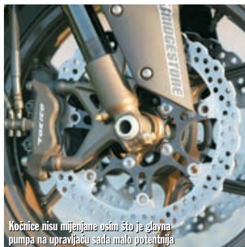
Kočnice nisu mijenjane osim što je glavna pumpa na upravljaču sada malo potentnija

vrijednosti provrta i hoda (76 x 55mm), zapremina 998 ccm, 16 ventila po cilindru i hlađenje tekućinom. Novi agregat isporučuje više snage na srednjim režimima, ali još je zanimljivije da je jedan od rijetkih koji zadovoljava Euro III norme o zagađenju okoliša. Novost su ultra fini injektori, koji atomiziraju smjesu punjenja na 50 mikrona (prije 70), povećavajući efikasnost sagorjevanja, a time i linearnost isporuke snage i momenta. Smješteni su bliže samim usisnim ventilima. Opruge ventila od aluminijske i ispušni ventili od titana su lakši i odlikuje ih preciznija kontrola na višim okretajima. Opruge su