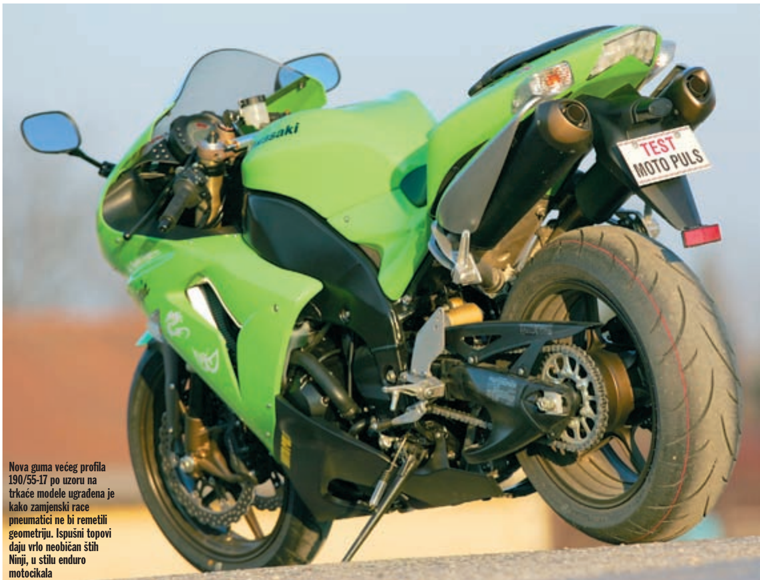
Nova guma većeg profila 190/55-17 po uzoru na trkaće modele ugrađena je kako zamjenski race pneumatici ne bi remetili geometriju. Ispušni topovi daju vrlo neobičan štih Ninji, u stilu enduro motocikala

je. Kompletna maska - iako nije viša - znatno više strši prema naprijed. Prednji dio sjedala i dio spremnika na koji se proteže je uži, tako da bi se niži vozači lakše trebali oslanjati o podlogu. Upravljač je otvoren, dovoljno širok, ali i vrlo nisko postavljen, čak najniže u klasi. I razmak između upravljača i oslonaca nogu je ekstremno kratak, tako da vozač htio-ne htio ima pravi racing položaj. Može se sjediti dovoljno usko da se potpuno zaštiti iza oplata i dovoljno "nabijeno" da bi se uvijek moglo hitro odgovoriti na sve zahtjeve sportske vožnje. Sjedalo je najduže u klasi, ali je isto tako i razmak tijela od upravljača najmanji. Ovakav položaj je u potpunosti suprotnosti s vizualnim dojmom Kawasakija.