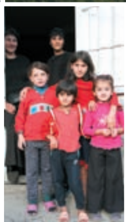
Cesta prema Adigeniu