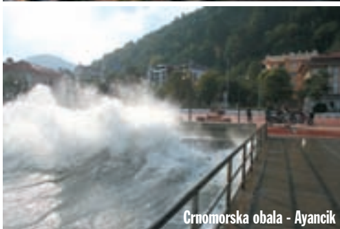
Crnomorska obala - Ayancik