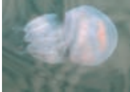
Meduza u Crnom moru