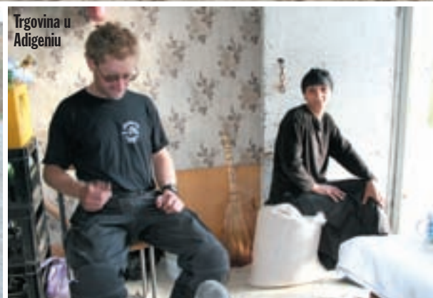
Trgovina u Adigeniu

Odlazimo iz prekrasnog Erevana i začas smo u obližnjem Ečmiadzinu. Grad je središte kulture Armenije, tu je centar Armenske pravoslavne crkve. Posjetili smo najpoznatiju crkvu koja datira iz IV stoljeća. Našli smo i prodavaonicu suvenirna, to je valjda jedina u cijeloj zemlji. Do našeg sljedećeg cilja, grada Gjumri (nekadašnji Leninakan), nešto je više od stoti-