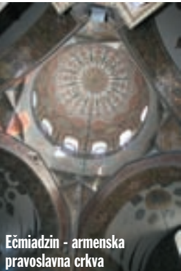
Ečmiadzin - armenska pravoslavna crkva