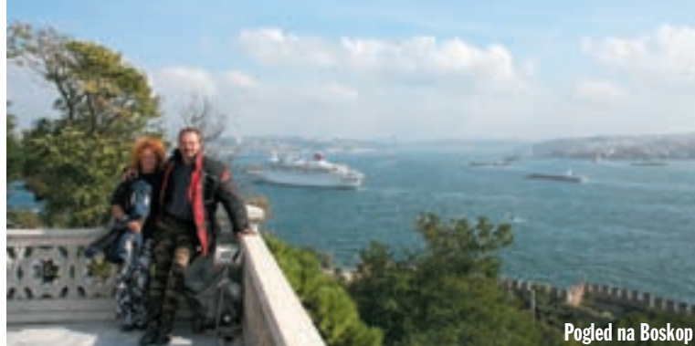
Pogled na Boskop