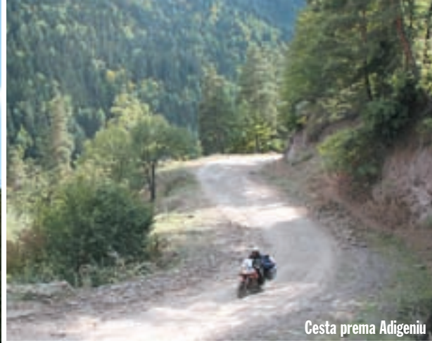
Cesta prema Adigeniu