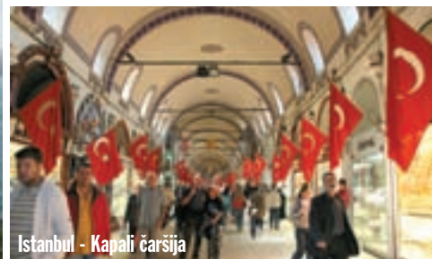
Istanbul - Kapali čaršija