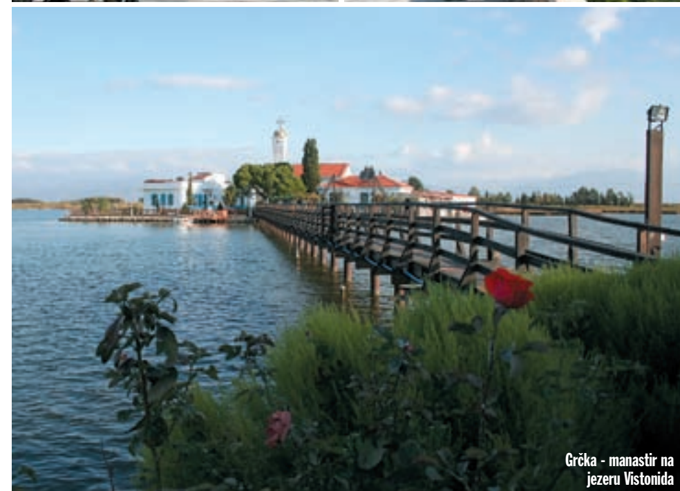
Grčka - manastir na jezeru Vistonida