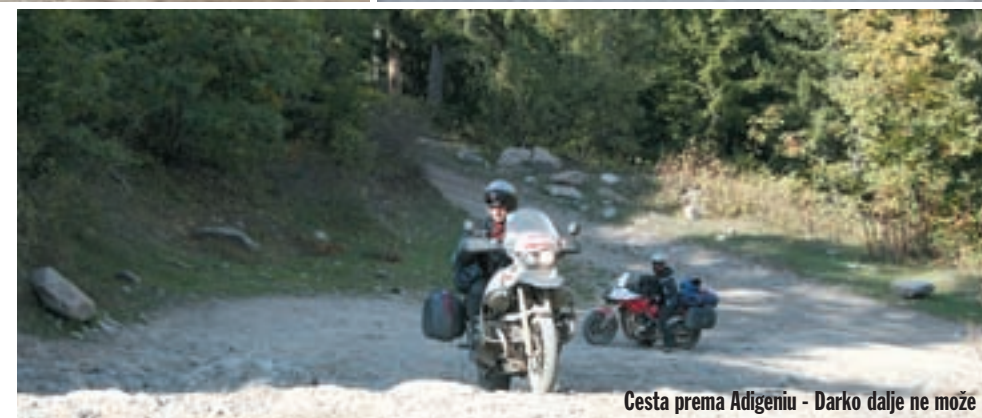
Cesta prema Adigeniu - Darko dalje ne može