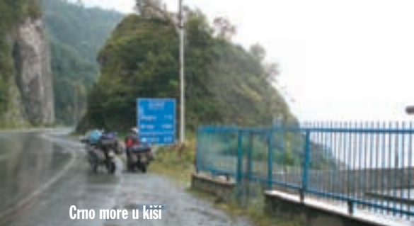
Crno more u kiši