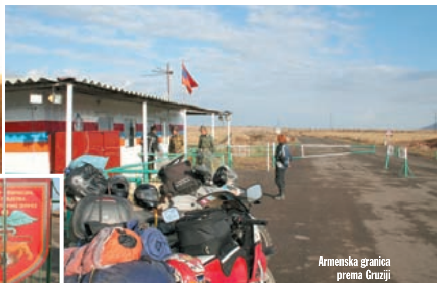
Armenska granica prema Gruziji

vjerojatno je kakve su razlike u kvaliteti ceste u Armeniji. Još prije nekoliko desetaka kilometara jedva smo se probili uz jezero, a sada jurimo po zavojima Kavkaza kao da smo na pisti, sve to s pogledom na nebrojene zavoje ispod nas. Na vrhu prijevoja ogromna je ploča "Araratski region" na tri vrste pisma: na armenskom, na ruskoj ćirilici i na latinici. Spuštajući se, ugledali smo fantastičan prizor: planina Ararat sa snježnom kapom prelijevala se na suncu. Prije dvije godine promatrali smo je s iranske i turske strane. Ararat je na turskom teritoriju, iako je nekada pripadao Armeniji. Kod grada Jechegnadzora napuštamo cestu koja vodi prema jugu