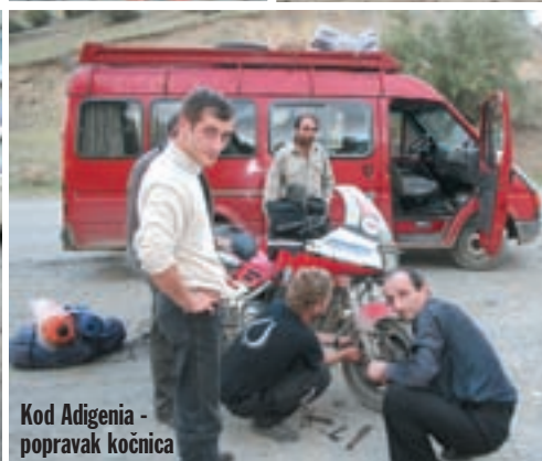
Kod Adigenia - popravak kočnica