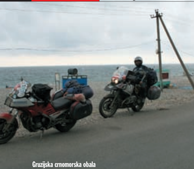
Gruzijska crnomorska obala