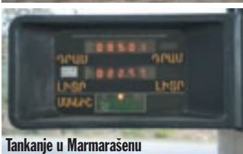
Tankanje u Marmarašenu