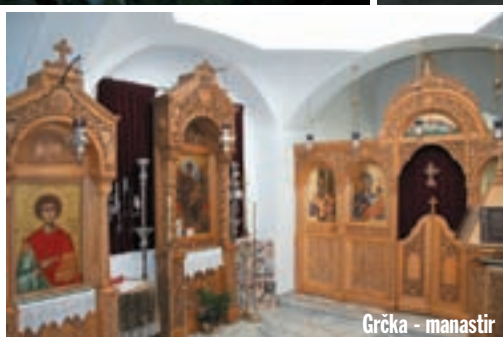
Grčka - manastir