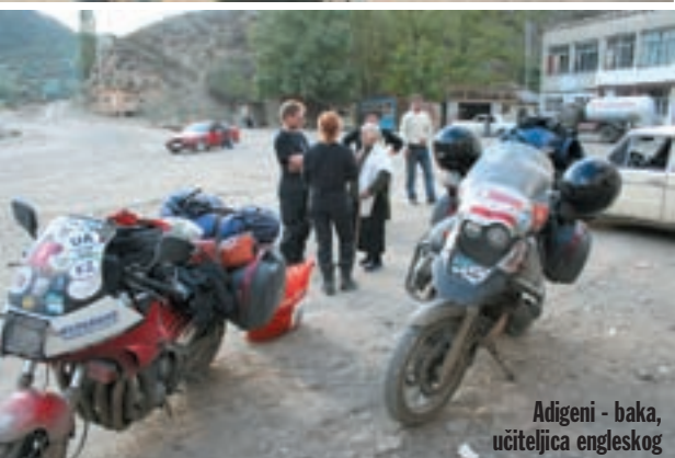
Adigeni - baka, učiteljica engleskog