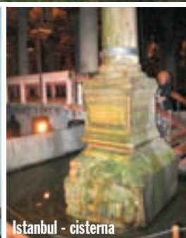
Istanbul - cisterna