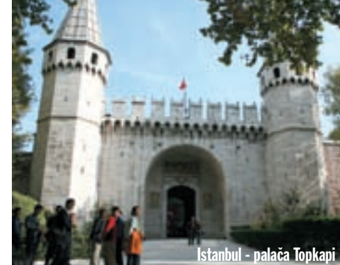
Istanbul - palača Topkapi