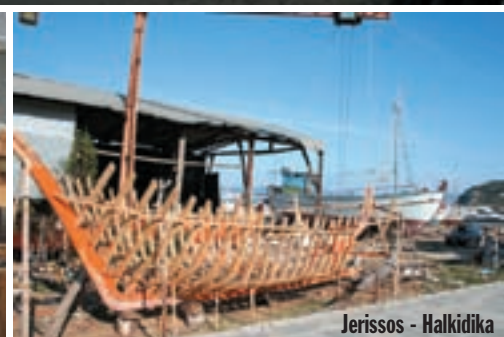
Jerissos - Halkidika

more, ustvari spoj mora i jezera. Tako su nam rekli monasi koji tu žive. Posjetili smo ih u njihovom živopisnom manastiru do kojeg dolazimo preko mostića. Preko još jednog mostića dolazimo do crkvice koja se nalazi na malenom otočiću. Bjelina crkve zrcali se u plavoj boji jezera, naslada za oči. Nastavljamo put pogleda uprtih u desno, na gorje Rodopi. Zaustravljam se popiti kavu u Kavali, gradu toliko lijepom da ga niti ovaj put ne zaobilazimo. Prema Asprovalti vode dvije ceste, jedna od njih uz more. Odlučujemo se baš za tu. Naselja gotovo da nema,