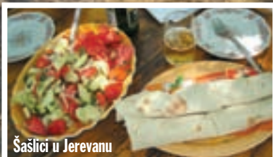
Šašlici u Jerevanu