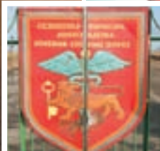
Izlazimo iz Armenije