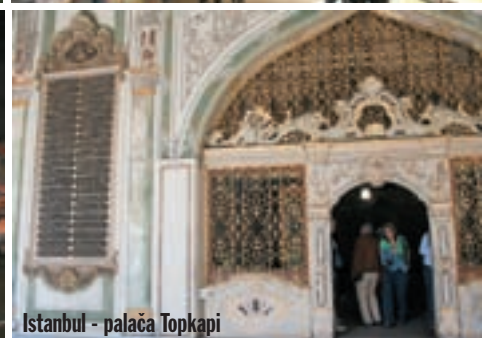
Istanbul - palača Topkapi