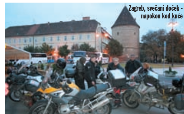
Zagreb, svečani doček - napokon kod kuće