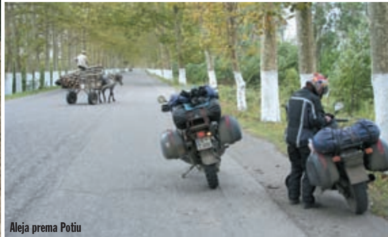
Aleja prema Potiu