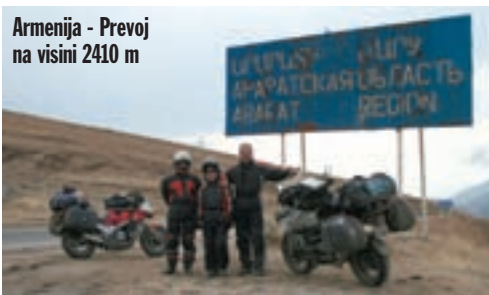
Armenija - Prevoj na visini 2410 m