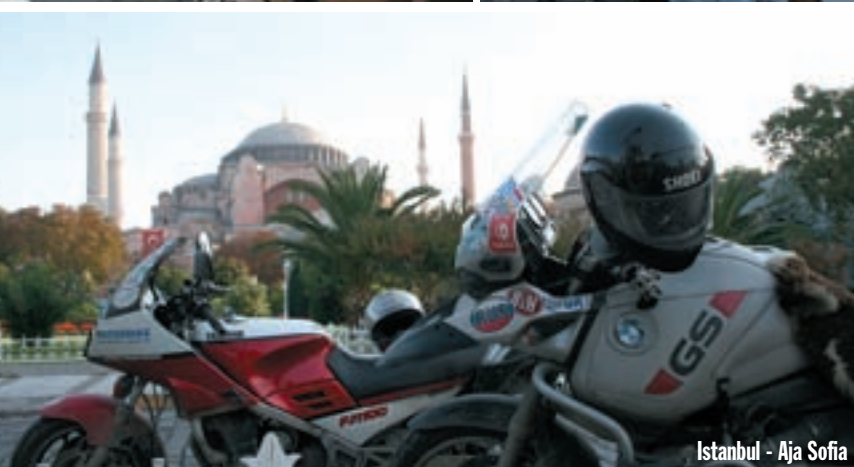
Istanbul - Aja Sofia