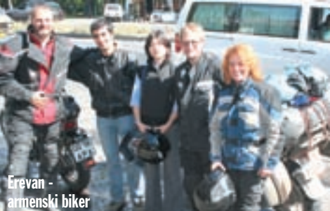
Erevan - armenski biker