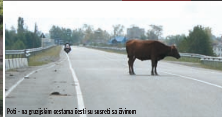
Poti - na gruzijskim cestama česti su susreti sa živinom