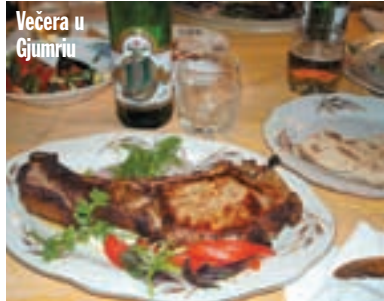
Večera u Gjumriju

bra, stara Yamaha bez prigovora sve to podnosi. Slijedi fenomenalna cesta kroz prijevoj visok 2.410 metara. Ime prijevoja nije upisano ni u karti, niti na ploči uz cestu, ali vodi preko Vardenisskijskog hrbeta pored vrha Vardenis (3.552 m). Ne-