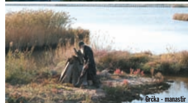
Grčka - manastir