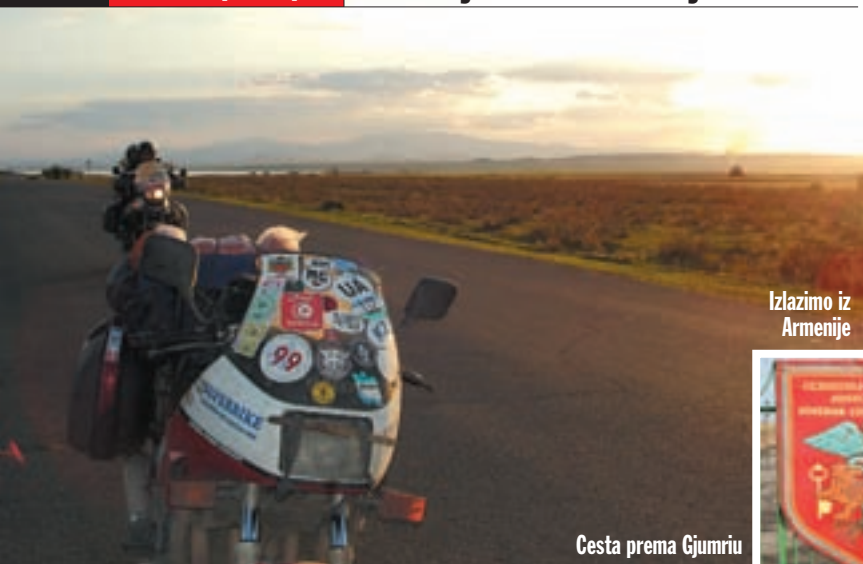
Cesta prema Gjumriu