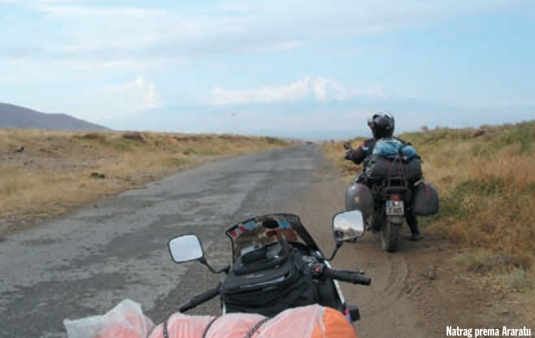
Natrag prema Araratu