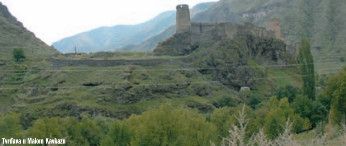
Tvrđava u Malom Kavkazu