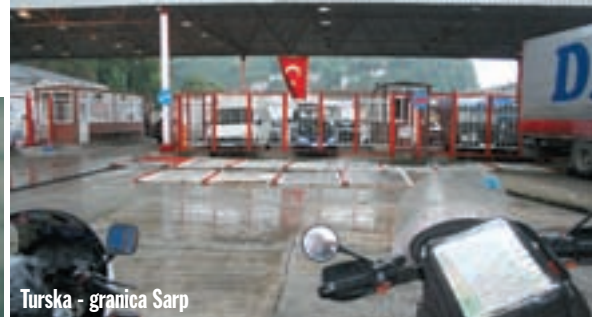
Turska - granica Sarp