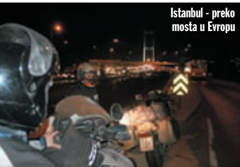
Istanbul - preko mosta u Evropu

nice sa Grčkom, tj. Europskom Unijom. Zbogom egzotiko, preko granične rijeke Maric (TR) ili Evros (GR) tražimo prvu benzinsku pumpu, sretni smo da benzin plaćamo po euro za litru. U Turskoj je, naime, koštao više od 12 kuna! Prošli smo Alexandroupoli, te se s glavne ceste spustili na onu uz more. Pješčane plaže potpuno su puste u listopadu, pa neometeno promatramo užarenu kuglu kako uranja u more. Vraćamo se u Makri, selo kojim smo prošli, u kojem smo zapazili idiličan restoran, baš pravi grčki. Ni ovdje nema niti traga turistima, pa možemo i očekivati kvalitetniju hranu samo za nas. Tako je i bilo, suvlaki i grčka salata izvrsno su prijali, a i osoblje je radilo ležerno, brinulo se samo o nama. Naravno da smo sjedili vani, jer je vrijeme odlično, ali smo razgledali i zanimljivu unutrašnjost konobe. Ispunjena je ribarskim motivima: slikama, mrežama, školjkama i ribama. Puni trbuha vratili smo se do morske obale i nesmetano prespavali. Probudilo nas je ugodno bruhanje ribarskog čamca, a ona ista kugla od sinoć izronila je iz mora, samo s druge strane. Trakijsko more, zaljev Egejskog mora, pokazalo nam se ovaj put u najljepšem izdanju. Prošavši Dikelu odlučili smo nastaviti uz more, međutim, cesta je nestala pa smo se morali vratiti na glavnu. Ne na autocestu koju su Grci prije nekoliko godina izgradili, nego na onu staru cestu kojom sam toliko puta putovao. Kroz Sapes i Komotini stižemo na jezero Vistonida. Desno od ceste je jezero, a lijevo je