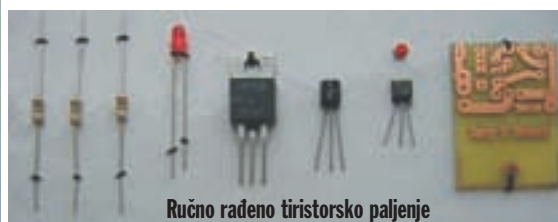
Ručno radeno tiristorsko paljenje