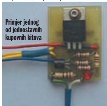
Primjer jednog od jednostavnih kupovnih kitova

vodljivosti te kratko spaja anodu i katodu, koje napon dobiven magnetskim poljem s namotaja puštaju eksplozivno kroz kondenzator, koji pak ostvaruje veličinu od stotinjak volti (kao ranije platina) koja ide na bobinu. Impuls prestaje nestankom onog manjeg sa pick-upa, nakon čega tiristor odlazi u zasićenje i čeka se idući ciklus. Prilikom izvođenja ovog niza instrukcija nema gubitaka i rasipanja energije, iskra je stalna i postojana i ima uvijek istu vrijednost, interval, boju i jakost. Uz ovaj bitan faktor ne gledamo samo na bolje performanse, već i na općenit zdrav rad motora. Ako u vaš motocikl do sada nije ugrađen ovakav sustav paljenja, a na vidiku nema zamjenskog kita, tada uz stručnu pomoć ili malo bolje poznavanje elektronike i sami možete izraditi sličan sklop uz malenu novčanu in-