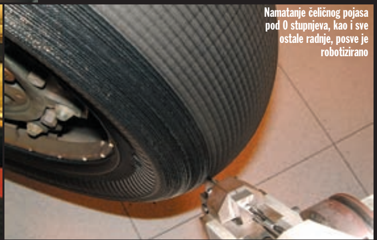
Namatanje čeličnog pojasa pod 0 stupnjeva, kao i sve ostale radnje, posve je robotizirano