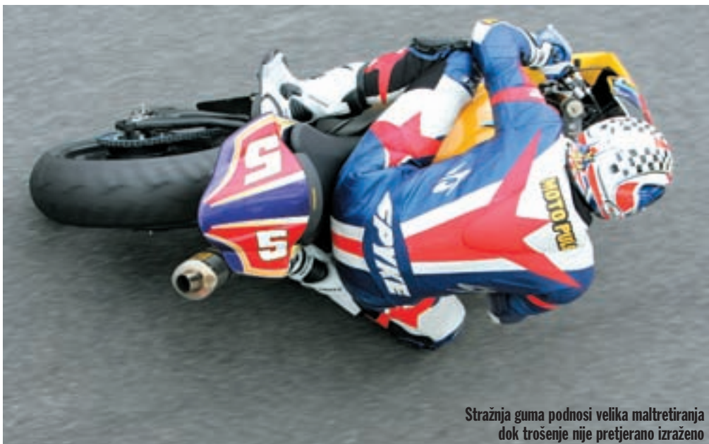
Stražnja guma podnosi velika maltretiranja dok trošenje nije pretjerano izraženo

Klasa Superstock 600 je najslabija i najmlađa klasa, u prvom redu namijenjena mladim vozačima, koji nastupaju na motociklima na kojima su