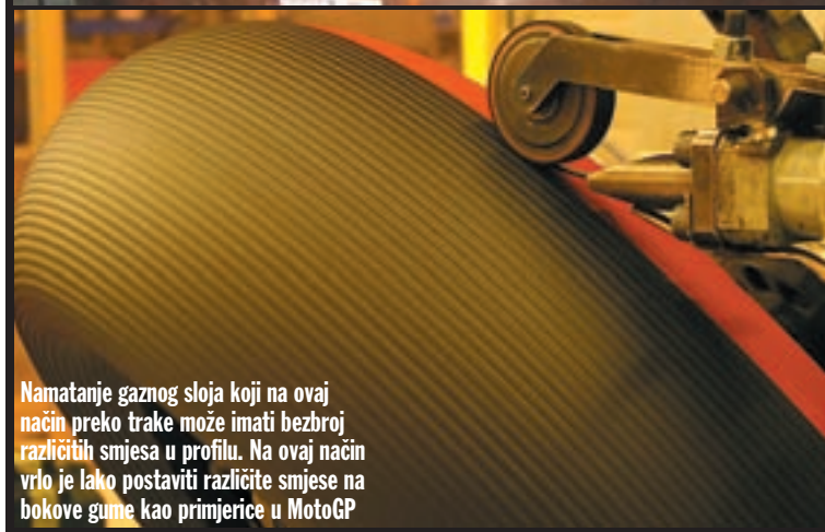
Namatanje gaznog sloja koji na ovaj način preko trake može imati bezbroj različitih smjesa u profilu. Na ovaj način vrlo je lako postaviti različite smjese na bokove gume kao primjerice u MotoGP

Nekada su se gume proizvodile tako da se konstrukcija najprije slagala na ravnom kolutu, a potom je guma savijana u završnu formu, dok danas robotizacijom već početni pojas poprима završnu zaobljenu formu. Razlike su vidljive ponajviše po vanjskom obodu gume, gdje je kružnica milimetarski precizna.