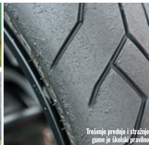
Trošenje prednje i stražnje gume je školski pravilno