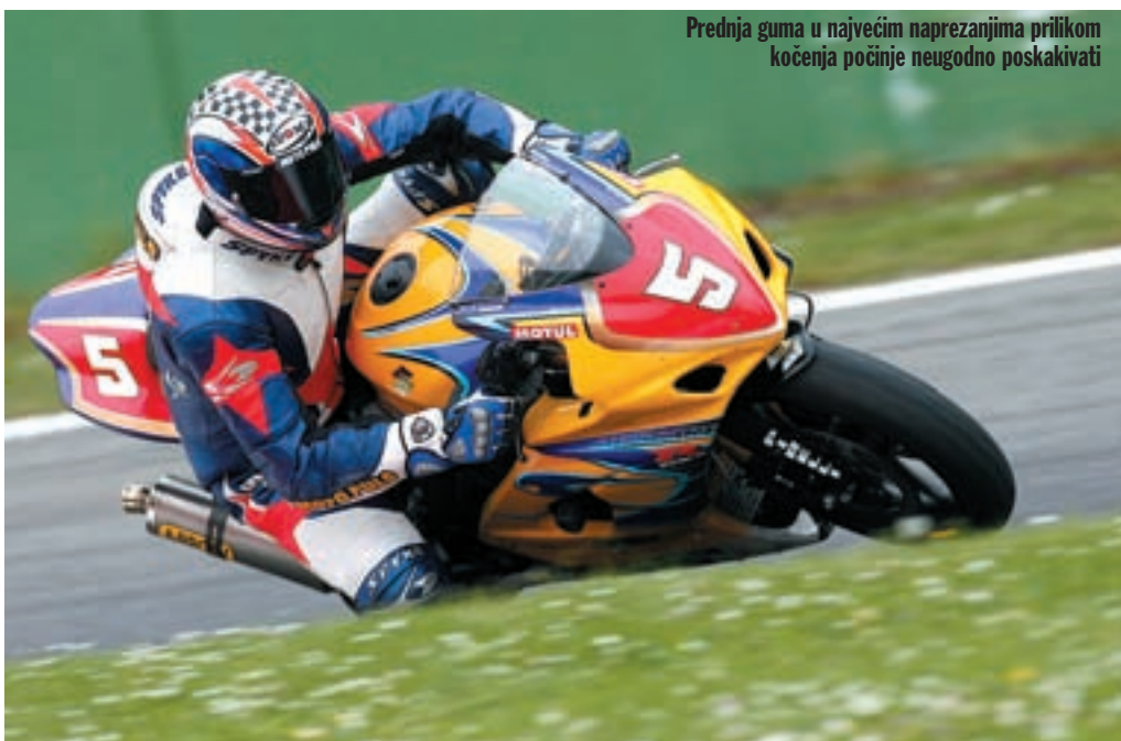
Prednja guma u najvećim naprezanjima prilikom kočenja počinje neugodno poskakivati