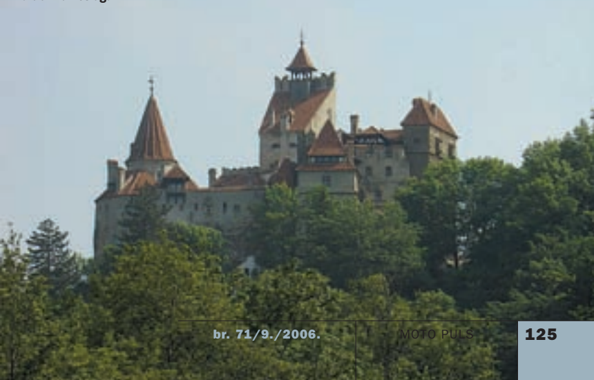
Dvorac Bran straga