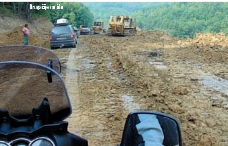
Drugacije ne ide