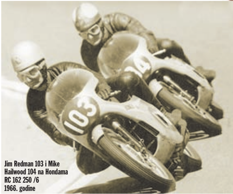
Jim Redman 103 i Mike Hailwood 104 na Hondama RC 162 250 / 6 1966. godine