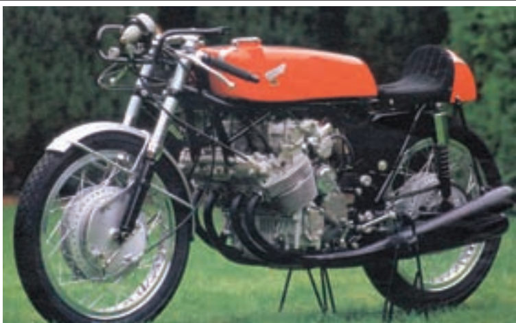
▲ Honda RC 163 s četiri cilindra nasljednik je šestocilindrične RC 162. Na oba modela Irimairi je koristio svoje bogato iskustvo stečeno na modelima 50 i 125 ccm