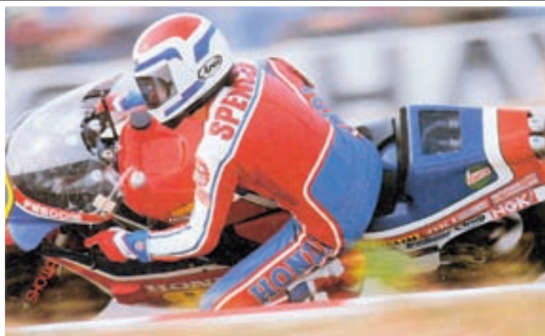
▲ Freddie Spencer na Hondi NS 500. Iako Irimairi nije konstruirao ovaj sjajan motor, posredno je bio zaslužan za njegov uspjeh

► NR 500/ V4 1981 najfamniji i najkontraverzniji motocikl Honde. Prema riječima Irimairia, trebalo je samo još nekoliko godina razvoja da bi se postigao željeni rezultat od 160 KS, koliko su očekivali u Hondi (podsjetimo, danas, s distancom od 25 godina, GP motori s 1000 ccm raspolazu snagom od 230 KS, no Honda NR 500 bila je zapreminski točno upola manja, pa bi tako teorijski litarski motor dozeao maksimalnu snagu od 320 KS)