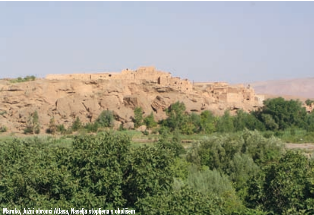
Maroko, Južni obronci Atlasa, Naselja stopljena s okolišem