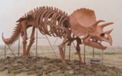
Maroko, okolica Erfouda, Prehistorijsko čudovišta iz vremena zelene Sahare