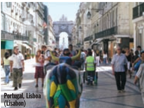
Portugal, Lisboa (Lisabon)

uspijevamo pronaći sobu, odnosno apartman za 45 eura. Obilazimo grad. Nekoliko redova zgrada uz obalu daju sliku urednog turističkog mjesta, ali ako se prošetate malo dalje, nalazite sasvim drugu sliku. Trošne male kućice, trgovine koječega što se prodaje na pločniku ili u ne baš urednim prostorima. Na tlu smeće, u zraku neugodni mirisi. Ljudi su susretljivi i dobronamjerni. Na semaforima mašu iz svojih automobila želeći nam dobrodošlicu. Nakon što smo razgledali grad i njegove stanovnike, te pojedeli kebab u malom restoranu, odlazim na zasluženi odmor. Moja muška polovica kreće u obližnji Internet kafe (rastu na svakom uglu) obaviti nešto s fotografijama.