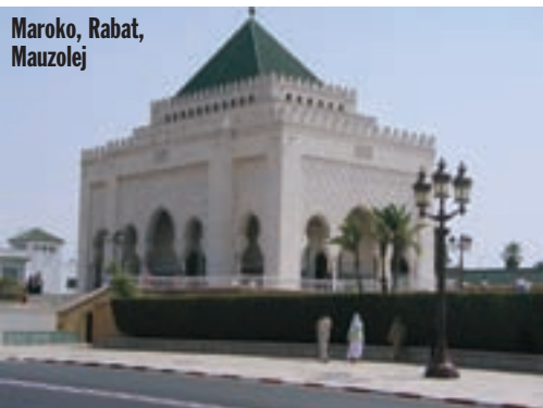
Maroko, Rabat, Mauzolej

Konačno se vraćaju i muž i kotač. Čovjek koji ih je odveo vratio ih je i natrag. Vozili su 90 km do grada Essaouire, gdje su pronašli meštra koji je u 19 colnu gumu ubacio 18 colnu zračnicu boljeg mopeda, sve kao prvu pomoć do 300