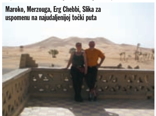
Maroko, Merzouga, Erg Chebbi, Slika za uspomenu na najudaljenijoj točki puta