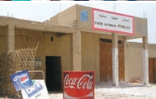
Maroko, Južni obronci Atlasa – Da li je više moguće pobjeći od Microsofta i Coca/Pepsi Cole?