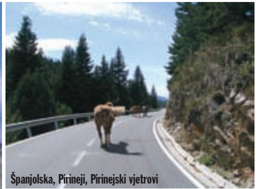
Španjolska, Pirineji, Pirinejski vjetrovi