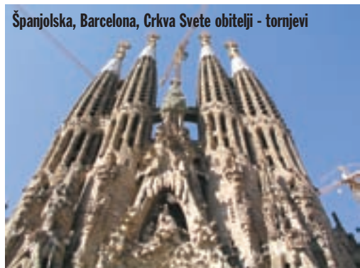
Španjolska, Barcelona, Crkva Svete obitelji - tornjevi