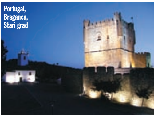
Portugal, Braganca, Stari grad