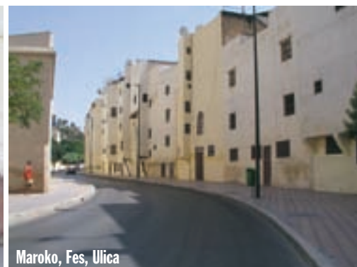
Maroko, Fes, Ulica