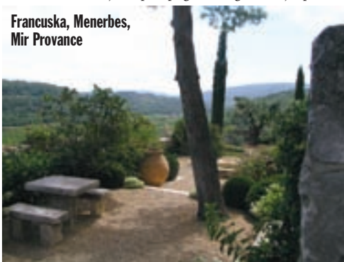
Francuska, Menerbes, Mir Provance

Autoputom nastavljamo prema Cannesu. U daljini se uzdižu neke planine. Pomislim kako je dobro da autocesta ima dovoljno visoku ogradu, jer bi moj motorist mogao doći u napast i skrenuti na kakav kozji put, ne bi li motorom osvojio još jedan planinski vrhunac ili barem prijevoj. Na autocesti gust promet. Svi idu prema Azurnoj obali. Ulazimo u Cannes i komentiramo da sam grad nije ništa posebno i fascinantno. Zaustavljamo se na šetalištu uz obalu i na trenutak postajemo dio gomile koja je ovdje da bi vidjela i bila viđena. Ne uklapamo se stilom, a ni mirisom, pa krećemo dalje. Preko razvikanog Antibesa vozimo prema Nici i zaključujemo da su Francuzi stvarno majstori u plasiranju svega i svačega pod firmom francuskog šarma. Razvikana Azurna obala između Antibesa i Nice, izgleda ovako: dugačka šljunčana plaža iza koje se odmah pruža vrlo prometna cesta, pa onda visoka ograda iza koje je isto tako prometna pruga.