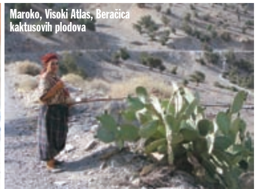
Maroko, Visoki Atlas, Beračica kaktusovih plodova

nije jasno, osim činjenice da se način kupnje karata, sporazumijevanja sa službenicima i ukrcanja na trajekt može nazvati svakako, ali ne organiziran. Toliko o turističkoj Španjolskoj. Penjemo se u kabinu na najgornjoj palubi. Već je 22.10, a mi i dalje stojimo. U 22.30 konačno se javlja brodska sirena i mi napokon, nakon 7 dana i 4200 km Europe, krećemo preko mora u Afriku.