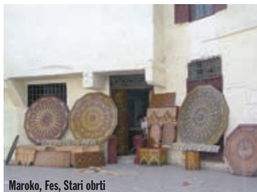
Maroko, Fes, Stari obrti