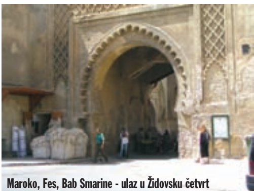
Maroko, Fes, Bab Smarine - ulaz u Židovsku četvrt

Pristajemo u Algeciras iz kojega smo prije devet dana isplovili za Tanger. Poprilično umorni nakon neprospavane noći vozimo prema Gibraltar. Gibraltarska stijena je prirodna ljepota okružena rafinerijama, odlagalištima kontejnera, aerodromom i drugim "ukrasima". Uz svjetionik na rtu dominira velika džamija. Ponovno prolazimo carinske formalnosti i nastavljamo put dalje Španjolskom obalom. Osjeća se prenatrpanost, ali ipak je sve izgrađeno s mjerom i osjećajem za očuvanje karakteristič-