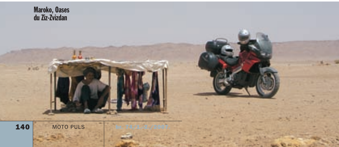
Maroko, Oases du Ziz-Zvizardan

Sljedeće jutro otkriva prekrasno mjesto na obali Atlantika. Kilometarske pješčane plaže sa sprudovima na kojima se lome valovi raj su za surfere i sve one koji vole uživati gledajući valove i beskrajno plavetnilo oceana. Veliki,