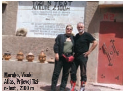
Maroko, Visoki Atlas, Prijevoj Tizi-n-Test, 2100 m