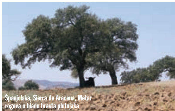
Španjolska, Sierra de Aracena, Metar rogova u hladu hrasta plutnjaka

Prolazimo lagunu Sidi Oualidia i vozimo prema rtu Cap Beddouza, na kojem se nalazi živopisni svjetionik. Vozimo se krajem u kojem pušu stalni vjetrovi s oceana, pa krajolik podsjeća na sjeveroistočnu stranu našeg Paga. Kamenjar s nešto malo suharaka između kamenja, koji su ne baš obilan obrok ovcama koje tu pasu. Na malim, kamenim zidovima ograđenim parcelama ljudi uzgajaju lozu i smokve koje djeca i starci prodaju uz cestu.