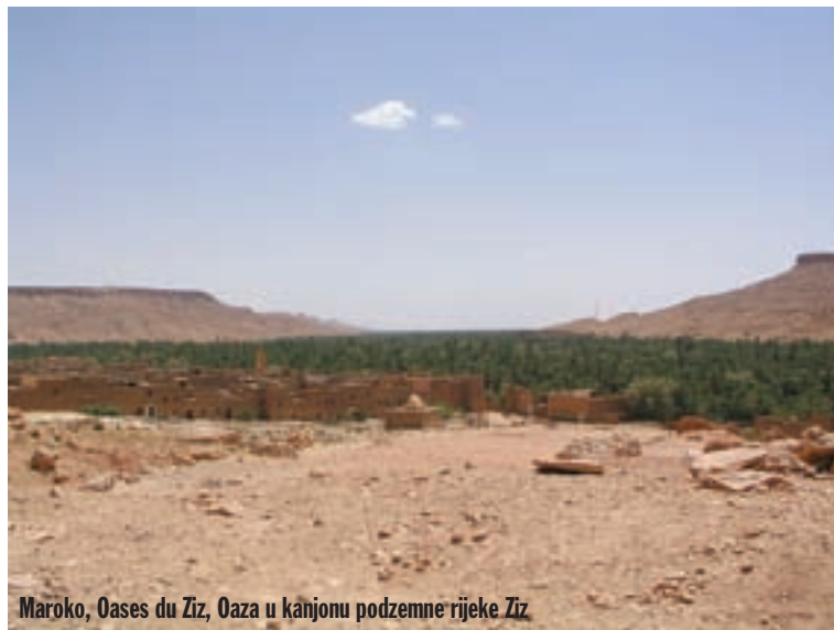
Maroko, Oases du Ziz, Oaza u kanjonu podzemne rijeke Ziz