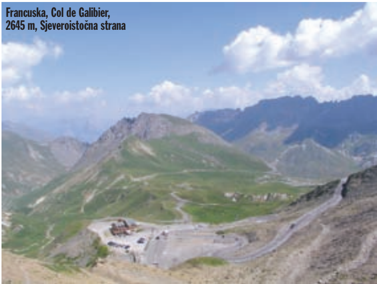
Francuska, Col de Galibier, 2645 m, Sjeveroistočna strana