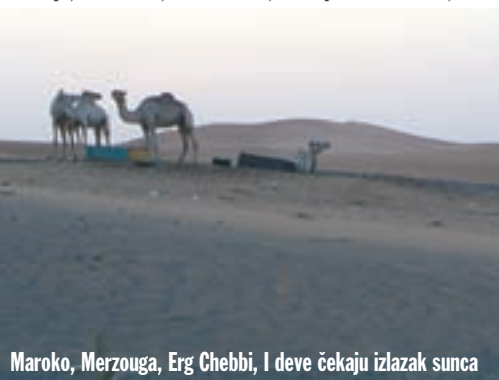
Maroko, Merzouga, Erg Chebbi, I deve čekaju izlazak sunca