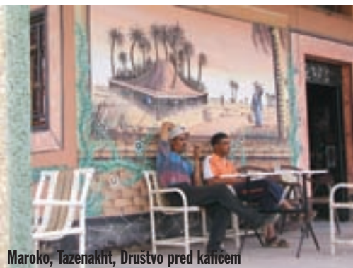
Maroko, Tazenakht, Društvo pred kancem

Rijeke koje se spuštaju niz planinu su presušile, ili su sasvim tanke vodene žile.