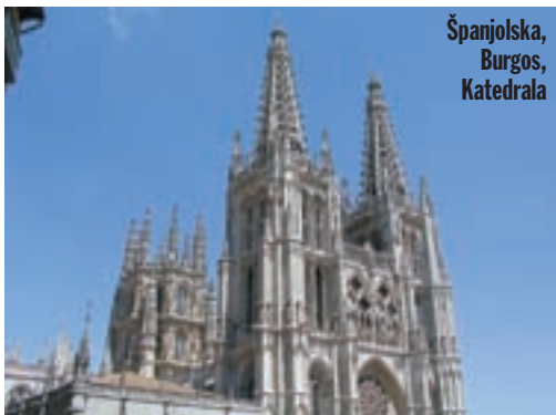
Španjolska, Burgos, Katedrala

U 20.05 sati kažu nam da posljednji trajekt polazi u 21.30. Prašimo prema Algecirasu i ubrzo ulijećemo u luku. Nema nikakvog vidljivog natpisa koji bi nam otkrio mjesto na kojem se mogu kupiti karte, oni koje to pokušavamo pitati ne razumiju ni engleski ni francuski, daju nam nekakav papir s amblemom i rukom pokazuju smjer. Vozimo kilometarskom lukom i napokon uspijevamo kupiti karte. Za nas i Severinu plaćamo 104 eura. Kažu nam da zadnji trajekt kreće u 21 sat, što znači da imamo još manje od petnaest minuta, pa jurimo prema trajektu. Devet sati je već odavno prošlo, a trajekt se tek puni stotinama vozila. Proučavam konačno karte i vidimo da na njima piše da polazimo u 22 sata. Definitivno nam ništa