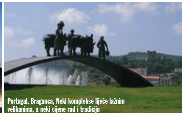
Portugal, Braganca, Neki komplekse liječe lažnim velikanima, a neki cijene rad i tradiciju