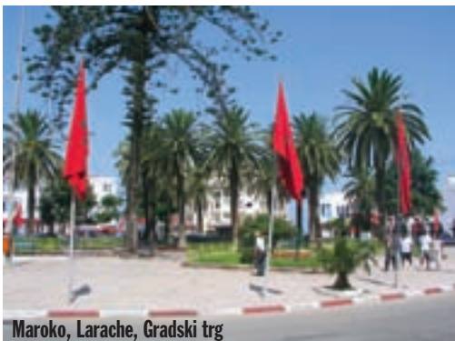
Maroko, Larache, Gradski trg

Sa suncem već visoko nad glavama napuštamo El Jadidu i sporednim obalnim cestama nastavljamo put prema jugu. Kraj je to gdje plodna polja prelaze u obalu.