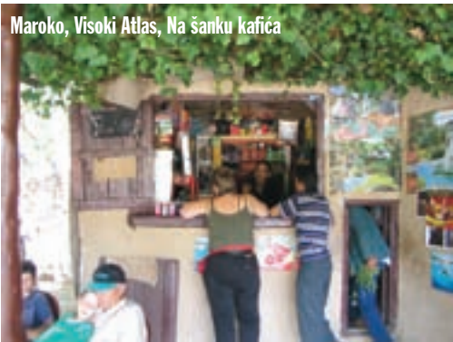
Maroko, Visoki Atlas, Na šanku kafića