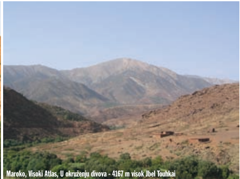
Maroko, Visoki Atlas, U okruženju divova - 4167 m visok Jbel Touhkaï