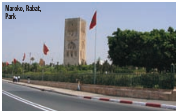
Maroko, Rabat, Park