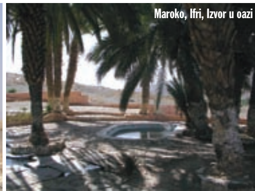
Maroko, Ifri, Izvor u oazi

nomadima. Pada noć. Ulazimo u područje gustih šuma cedra. Kao da smo stigli u neku drugu zemlju. Još jutros bili smo u pustinji na gotovo 50 stupnjeva, a sada smo u crnogoričnoj šumi na oko 20 stupnjeva. Dolazimo u Azrou. Grad je prepun ljudi, na ulicama opći metež, ali je to uglavnom domaće stanovništvo. Smještamo se u hotelu nešto europskijeg imena - "Panorama". Ujutro čujemo Hodžu i uočavamo da se na balkonima hotela ljudi klanjaju i mole. U svim dijelovima Maroka do tada, oni koji su se molili nakon javljanja Hodže bili su rijetkost. Ovo je očito nešto drukčiji kraj.