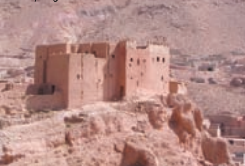
Maroko, Gorges du Dades

Ujutro ponovno ustajemo vrlo rano kako bismo izbjegli vrućinu barem u polasku. Vozimo do gradova El-Kelaa des Mogouna i Boumajne du Dadesa u velikoj oazi uz rijeku Oijed Dades koja izvire u Visokom Atlasu. Susrećemo džipove iz Marakeša s turistima sa svih strana svijeta. Posjećujemo kanjone Gorges du Dades i Gorges du Todtha i ponovno se divimo umijeću prirode. Na putu do kanjona Gorges du Todtha zastajemo na vidikovcu. U kanjonu hladna planinska rijeka u kojoj namaćemo noge. Ne možemo dugo stajati u vodi jer nam prsti vrlo brzo trnu od hladnoće. Uskoro ulazimo u niži dio pustinje. Boje se mijenjaju. Sve je više sivih i žutih tonova, a boja cimeta polako nestaje. Polako, ali sigurno bližimo se Sahari. Područje