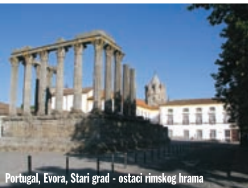
Portugal, Evora, Stari grad - ostaci rimskog hrama