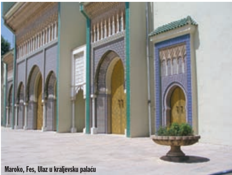
Maroko, Fes, Ulaz u kraljevsku palaču