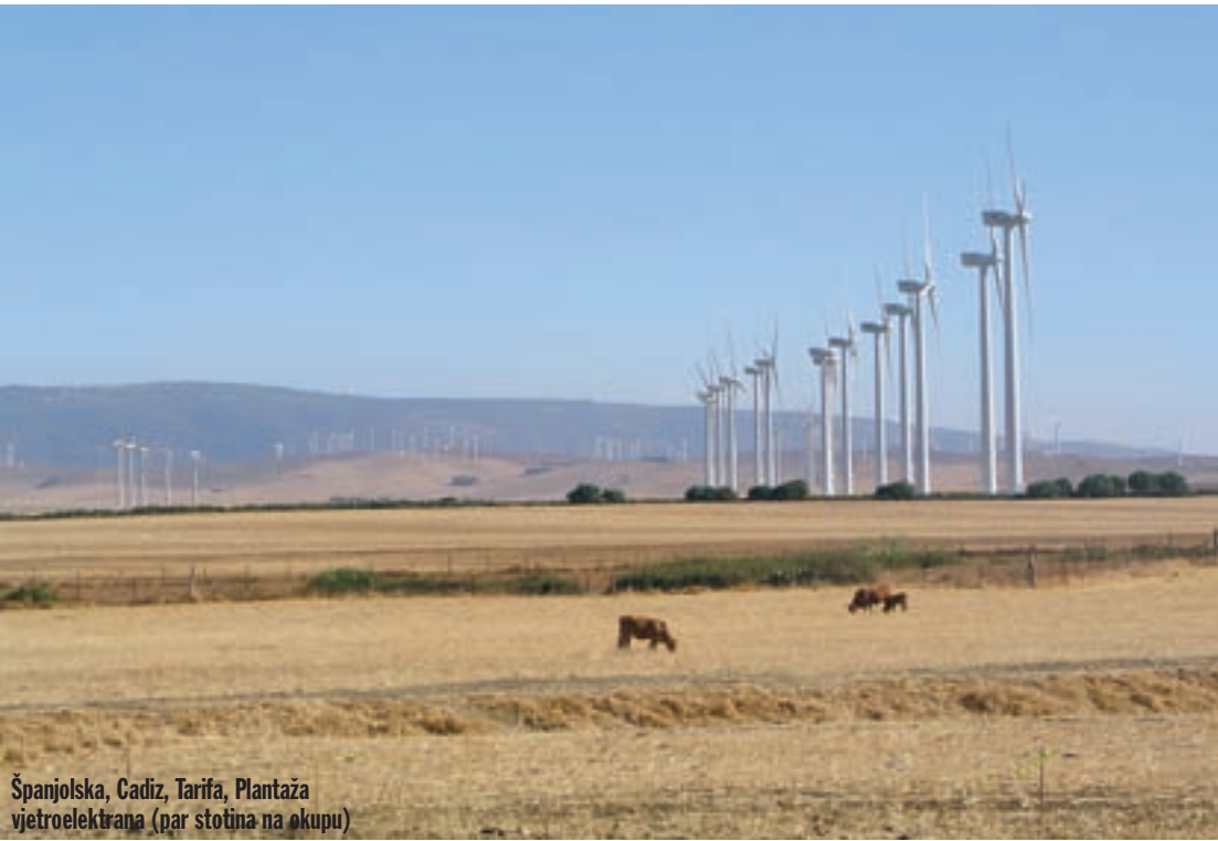
Španjolska, Cadiz, Tarifa, Plantaža vjetroelektrana (par stotina na okupu)