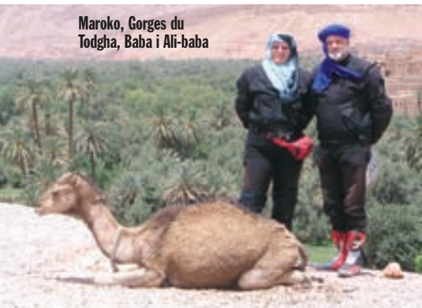
Maroko, Gorges du Todgha, Baba i Ali-baba

PIŠE: VERICA GEMIĆ SLIKA I VOZI: MARIJAN GEMIĆ