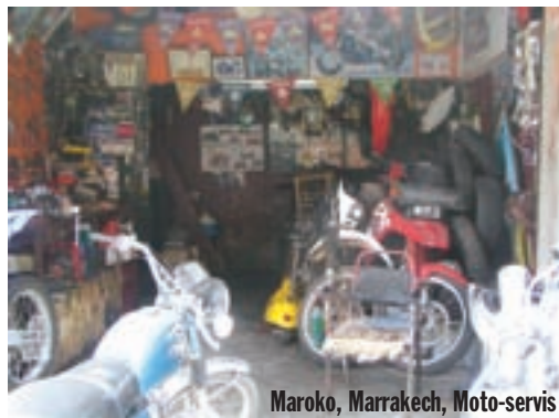
Maroko, Marrakech, Moto-servis