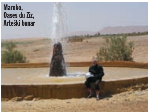
Maroko, Oases du Ziz, Arteški bunar