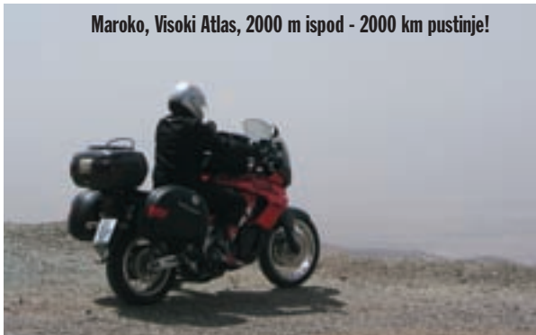
Maroko, Visoki Atlas, 2000 m ispod - 2000 km pustinje!

U predvečerje stižemo u El Jadidu, grad na obali Atlantika. Uz cestu stoje ljudi koji mašu i zveckaju ključevima koje drže u ispruženim rukama, te tako daju do znanja da iznajmljuju sobe. Nakon obilaska nekoliko hotela