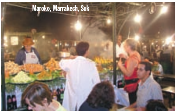
Maroko, Marrakech, Suk