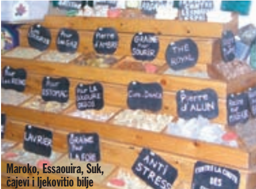
Maroko, Essaouira, Suk, cajevi i ljekovito bilje