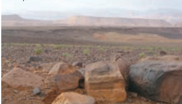
Maroko, Južni obronci Atlasa

nih formi. Gledam ih i divim se. Kamenoj pustinji se možete diviti zbog bogatstva tonova i oblika, ali i zbog velike raznolikosti formi koje je priroda stvorila i dalje ih stvara. Stižemo do oaze u kojoj se smjestio grad Quarzazate, poznat po filmskoj industriji. U okolini grada snimljeni su mnogobrojni povijesni spektakli i vesterni. Noćimo u hotelu s bazenom za samo 250 dirhama.