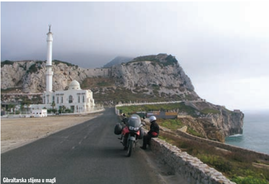
Gibraltarska stijena u magli