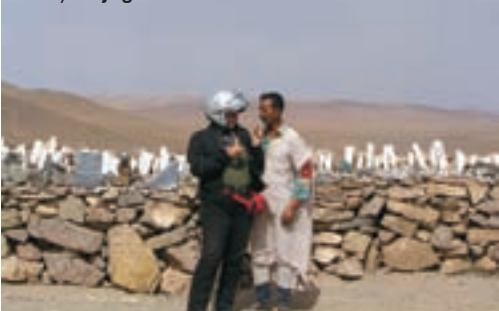
Maroko, Južni obronci Atlasa, Što je gazela?

životom. Osjećamo se vrlo ugodno, te u Marakešu ostajemo još jedan dan.