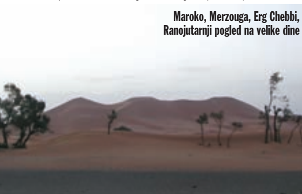
Maroko, Merzouga, Erg Chebbi, Ranojutarnji pogled na velike dine

Ponovno smo u Atlasu. Penjemo se i prelazimo prijevoje. Taj dio Atlasa nije kamena pustinja, već su to obli, pitomi obronci s pašnjacima. Vozimo dolinom rijeke Oued Ziz, penjemo se još malo, a zatim se spuštamo prema drugoj, sjeverozapadnoj strani Atlasa. Vozimo prema mjestu Azrou, kroz planinsko područje sa stočarima