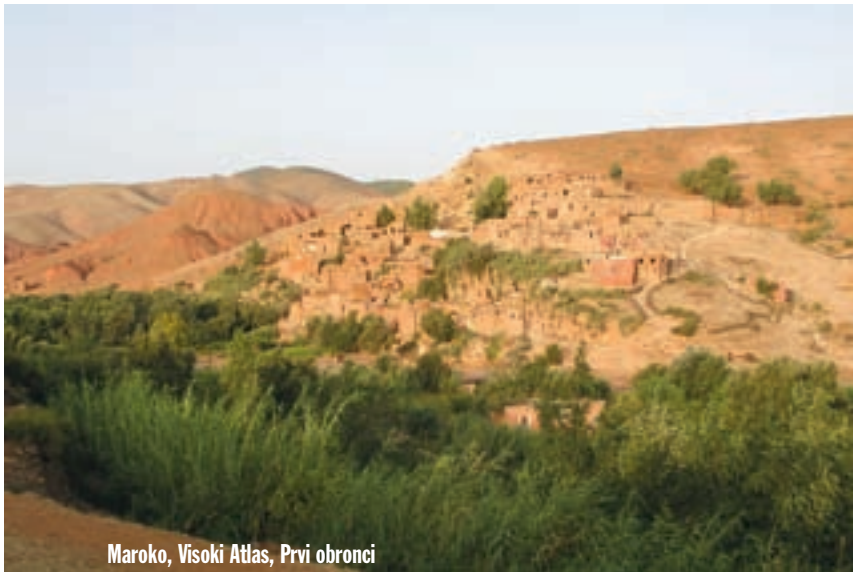
Maroko, Visoki Atlas, Prvi obronci