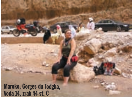
Maroko, Gorges du Todgha, Voda 14, zrak 44 st. C