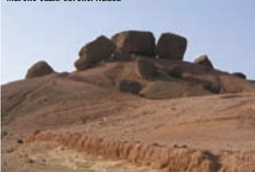
Maroko-Južni obronci Atlasa

Budimo se u četiri sata. Vani je mrkl mrak, ali barem nije vruće. Termometar pokazuje ugodnih 25 stupnjeva. Penjemo se prema Visokom Atlasu, 600-tinjak kilometara dugačkom planinskom lancu, dijelu 2400 km dugackog planinskog masiva Atlas. Temperatura pada na 20 stupnjeva. Solidnom vijugavom planinskom cestom penjemo se Atlasom. Oko nas planine boje cimeta, s planinskim selima, bojom i oblikom potpuno stopljenim s okolišem. U pozadini 4165 m visok Jbel Touhkaï, najviši vrh Atlasa.