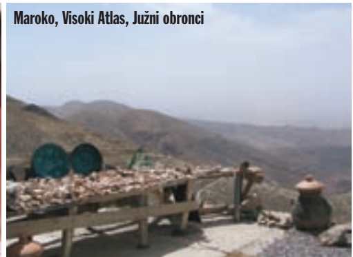
Maroko, Visoki Atlas, Južni obronci