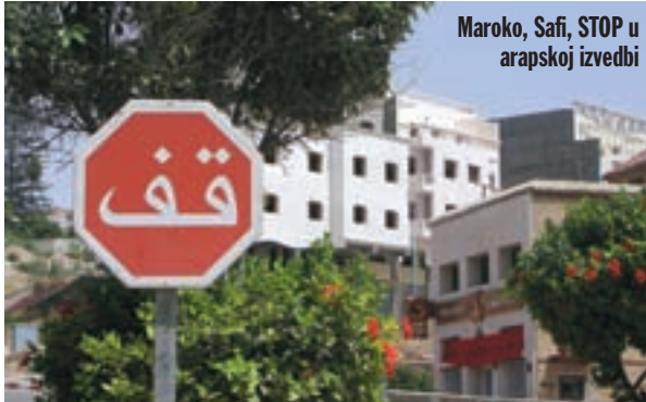
Maroko, Safi, STOP u arapskoj izvedbi

Na rubovima trga je mnoštvo raznih zabavljača. Od svirača i plesača, preko gutača vatre, do onih koji se samo šeću u šarenoj berberskoj nošnji. Zvukovi suka su isto vrlo šaroliki. Čuju se udaraljke, instrumenti, bubnjevi, vikanje i dozivanje. Miris roštilja isprepliće se s mirisima voća, u zraku iznad suka vije se dimna sumaglica. Na suku sve vrvi