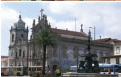
Portugal, Porto, Stari grad - jedinstvena fasada od oslikane keramike