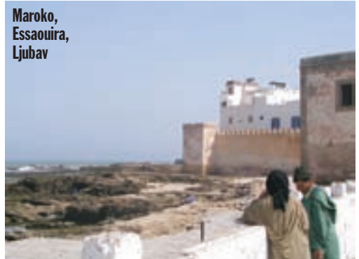
Maroko, Essaouira, Suk i Ljubav