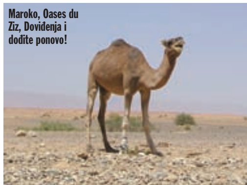
Maroko, Oases du Ziz, Doviđenja i dodite ponovo!