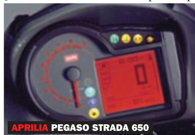
APRILIA PEGASO STRADA 650