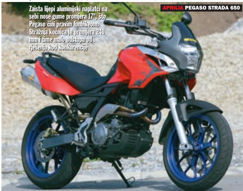
APRILIA PEGASO STRADA 650

Prednja kočnica svakako je najslabija karika na inače vrhunskom motociklu. Za snažnije kočenje treba snažnije privući ručicu i onda strpljivo pričekati da ovjes i veliki kotač "odrade svoje" prije nego se zaustavimo, no radi se o tipičnom ponašanju enduro motocikla