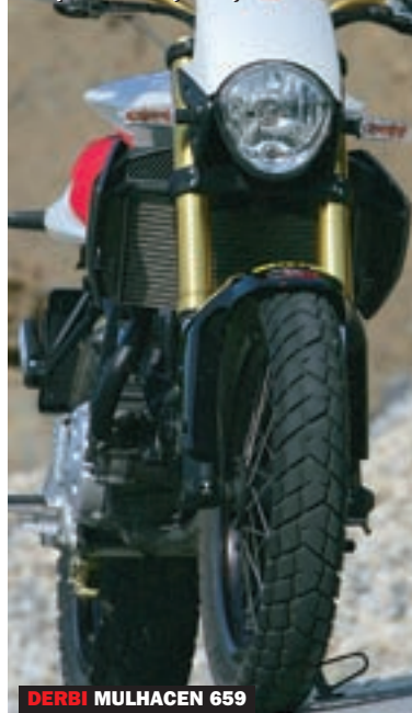
DERBI MULHACEN 659

Prednje svjetlo je modernog oblika, a pokazivači pravca s LED lampicama i prozirnim lećama pokazuju da se na komponentama nije štedjelo