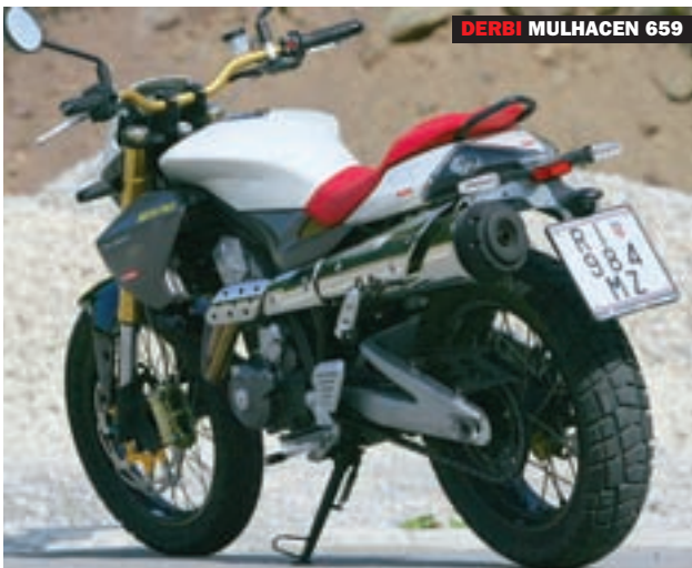
DERBI MULHACEN 659