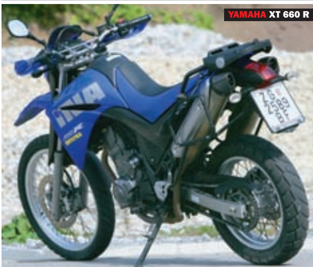
YAMAHA XT 660 R

sa monoamortizerom, a hod je opet velikih 200 mm, što je 70 mm više od Pegasa sa 130, te 80 mm više nego kod Derbija i MT-03. Ovaj motocikl opremljen je prosječnim i ni po čemu posebnim komponentama, koje svoj posao obavljaju zadovoljavajuće, ali donose i veliku prednost: najpristupačniju cijenu sva četiri testirana motocikla.