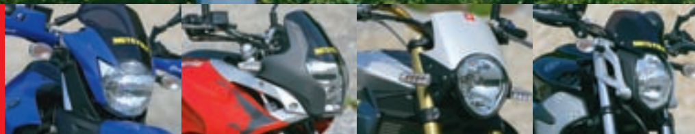
YAMAHA XT 660 R