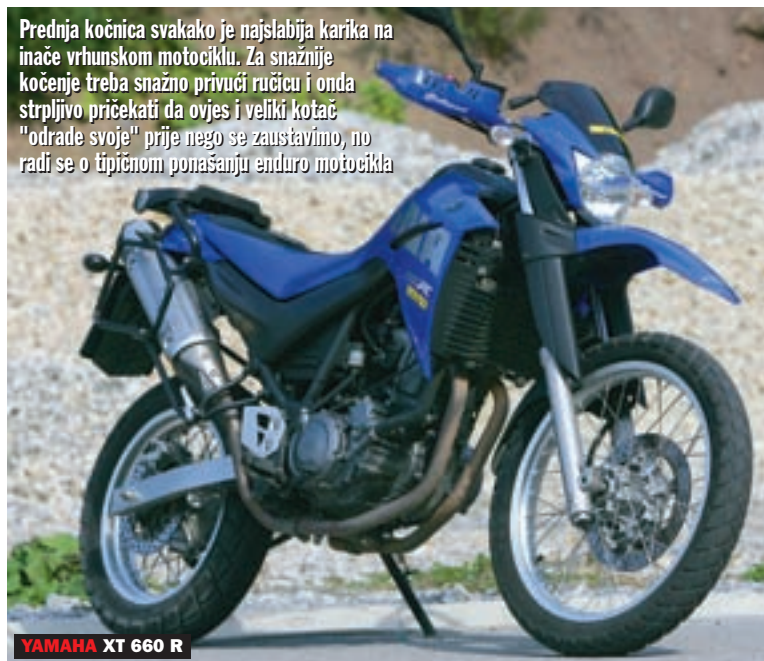
YAMAHA XT 660 R

Prednja kočnica svakako je najslabija karika na inače vrhunskom motociklu. Za snažnije kočenje treba snažnije privući ručicu i onda strpljivo pričekati da ovjes i veliki kotač "odrade svoje" prije nego se zaustavimo, no radi se o tipičnom ponašanju enduro motocikla