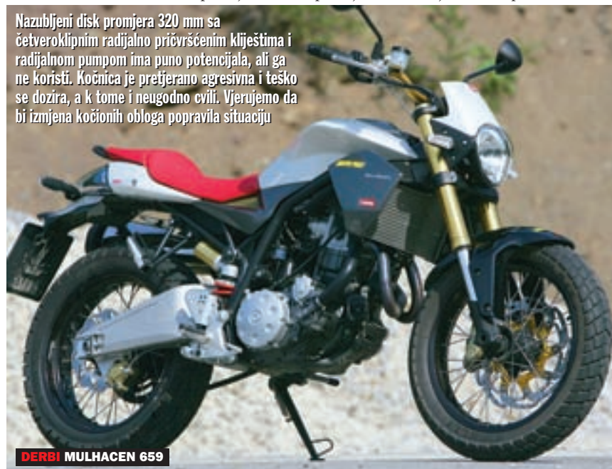
DERBI MULHACEN 659

Nazubljeni disk promjera 320 mm sa četveroklipnim radijalno pričvršćenim klijestima i radijalnom pumpom ima puno potencijala, ali ga ne koristi. Kočnica je pretjerano agresivna i teško se dozira, a k tome i neugodno cvili. Vjerujemo da bi izmjena kočionih obloga popravila situaciju