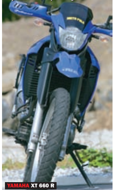
YAMAHA XT 660 R

Najviši na testu, XT djeluje i najšire radi obilnih oplata hladnjaka rashladne tekućine, ispod kojih se smjestio i metalni spremnik goriva