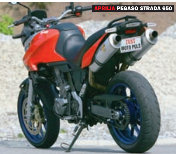
APRILIA PEGASO STRADA 650