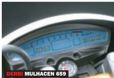
DERBI MULHACEN 659