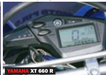
YAMAHA XT 660 R

▲ Jednostavni i pregledni instrumenti nude osnovne informacije i spadaju u sredinu ponude