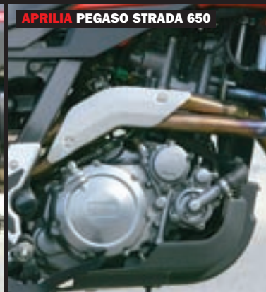
APRILIA PEGASO STRADA 650