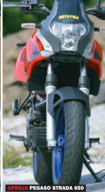
APRILIA PEGASO STRADA 650

Zbijenim prednjim krajem dominira svjetlo nepravilnog i zanimljivog oblika iznad kojeg je maleni vjetrobran