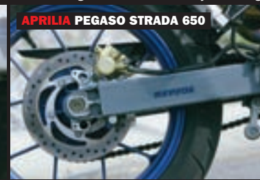
APRILIA PEGASO STRADA 650