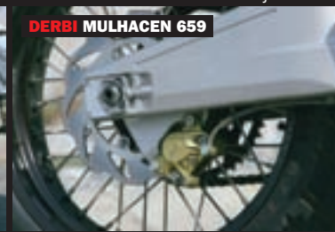
DERBI MULHACEN 659