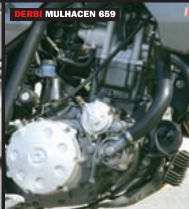
DERBI MULHACEN 659