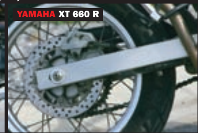
YAMAHA XT 660 R