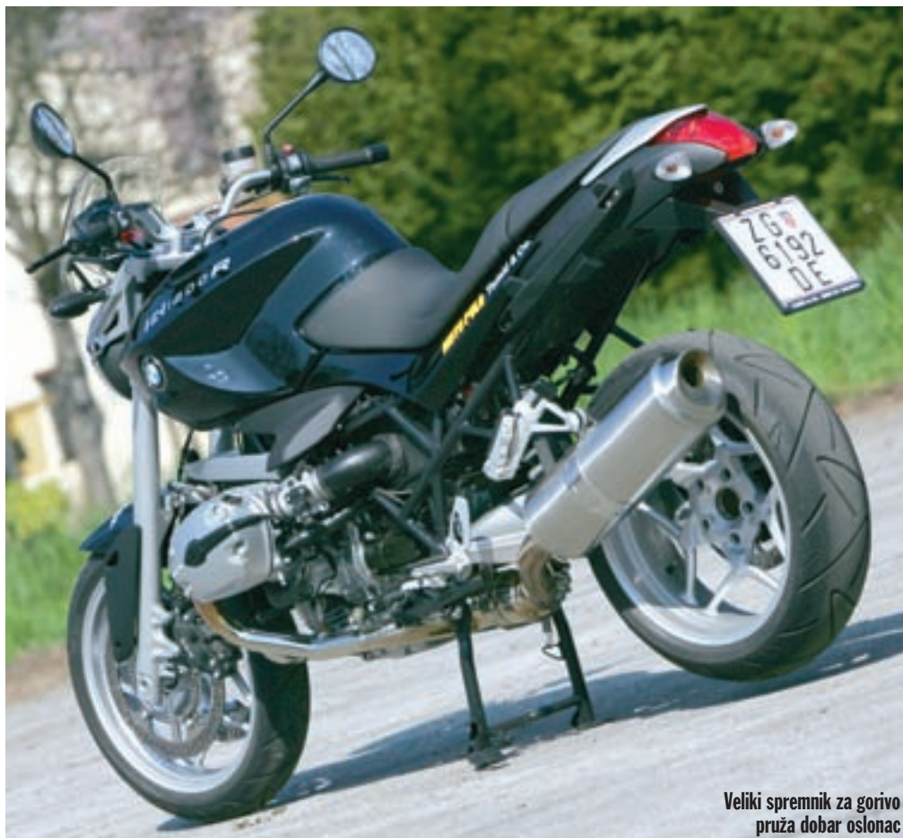
Veliki spremnik za gorivo pruža dobar oslonac

osloncima, ali to nikako nije neudoban položaj, već predstavlja savršen omjer udobnosti i pokretljivosti vozača. Isto se može reći i za široki i ravni upravljač, koji je izvršno odmjerena poluga i uvelike olakšava manevriranje motociklom pri malim brzinama, čak u tolikoj mjeri da vozač ima osjećaj da upravlja