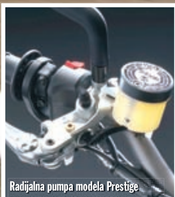
Radialna pumpa modela Prestige