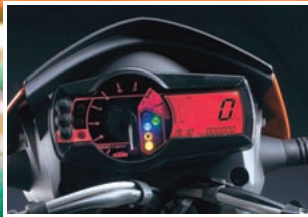
Nova instrument ploča na kojoj se ističu veliki obrtomjer i digitalni brzinomjer sa zaslonom od tekućih kristala

Novi model, koji dolazi pod nazivom SM 690, predstavnik je klase "soft" supermoto motocikala