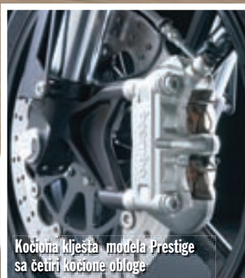
Kočiona kljesta modela Prestige sa četiri kočione obloge