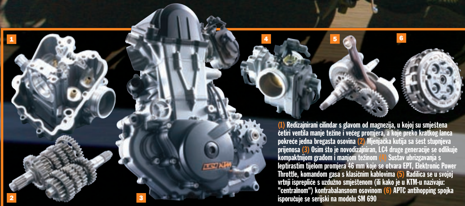
(1) Redizajnirani cilindar s glavom od magnezija, u kojoj su smještena četiri ventila manje težine i većeg promjera, a koje preko kratkog lanca pokreće jedna bregasta osovina (2) Mjenjačka kutija sa šest stupnjeva prijenosa (3) Osim što je novodizajniran, LC4 druge generacije se odlikuje kompaktnijom građom i manjom težinom (4) Sustav ubrizgavanja s leptirastim tijelom promjera 46 mm koje se otvara EPT, Elektronic Power Throttle, komandom gasa s klasičnim kablovima (5) Radilica se u svojoj vrtinji ispreplće s uzdužno smještenom (ili kako je u KTM-u nazivaju: "centralnom") kontrabalansnom osovinom (6) APTC antihopping spojka isporučuje se serijski na modelu SM 690

Koliko god ga spuštali u nagib, motocikl je uvijek toliko stabilan i čvrst na svojoj putanji, da imate osjećaj kako ne postoje ograničenja u jačini nagiba