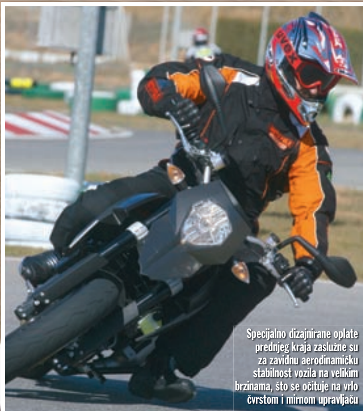
Specijalno dizajnirane oplata prednjeg kraja zaslužne su za zavidnu aerodinamičku stabilnost vozila na velikim brzinama, što se očituje na vrlo čvrstom i mirnom upravljaču