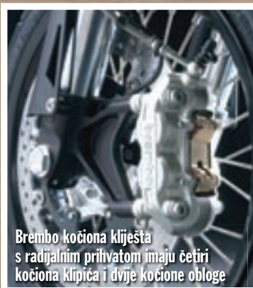
Brembo kočiona kljesta s radialnim prihvatom imaju četiri kočiona klipića i dvije kočione obloge

Nakon što smo se izvukli iz gradske vreve i dohvatili se otvorenijih dionica odmah smo se upoznali sa svim prednostima nove koncepcije ovog KTM-ovog