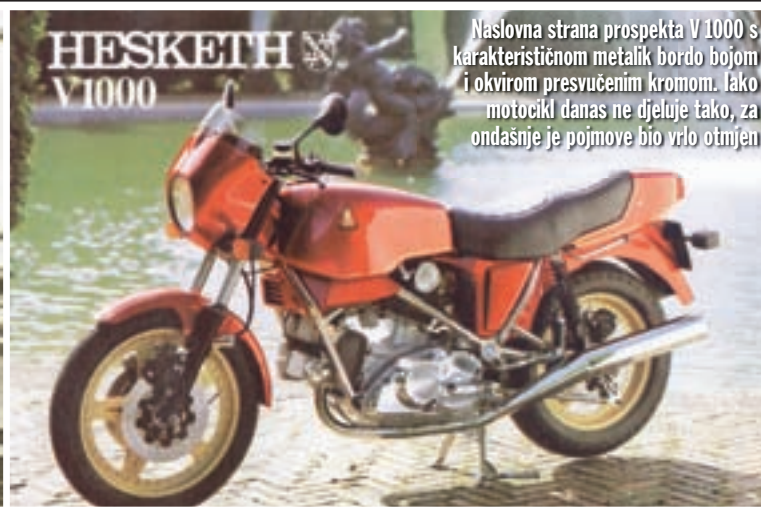
Naslovna strana prospekta V 1000 s karakterističnom metalik bordo bojom i okvirom presvučenim kromom. Iako motocikl danas ne djeluje tako, za ondašnje je pojmove bio vrlo otmjen