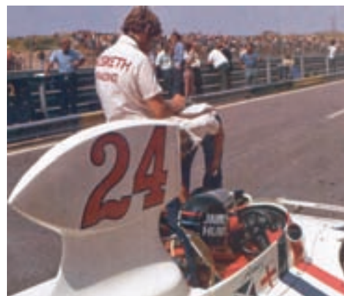
James Hunt, pokojni bivši svjetski prvak u Formuli 1, započeo je svoju karijeru 1975. zahvaljujući Alexanderu Heskethu, mladom lordu, ljubitelju brzina, kojem je parola bila "drive for Britain and drive for you". Jedini tim Formule 1 bez sponzora