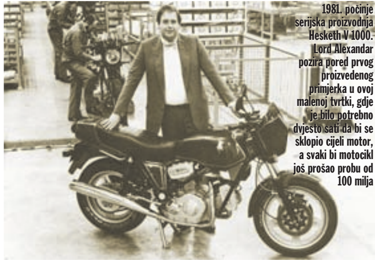
1981. počinje serijska proizvodnja Hesketh V1000. Lord Alexander pozira pored prvog proizvedenog primjerka u ovoj malenoj tvrtki, gdje je bilo potrebno dvjesto sati da bi se sklopio cijeli motor, a svaki bi motocikl još prošao probu od 100 milja

Projekt se obratio čuvenom konstruktoru Weslakeu i njegovoj malenoj inženjering tvrtki specijaliziranoj za tuning. Specijalist za konstrukciju i poboljšanje glava motora, kao