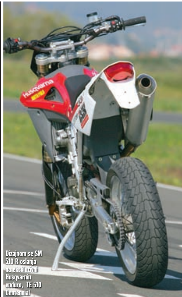
Dizajnom se SM 510 R oslanja na ekskluzivni Husqvarnin enduro, TE 510 Centennial

U skladu s najnovijim trendovima i ovaj model je opremljen električnim starterom motora, koji u potpunosti zamjenjuje nekadašnji nožni pokretač iako bismo ga i na ovom modelu rado vidjeli, ako niti zbog čega drugoga, onda zbog sigurnosti u situacijama kad tehnika zakaže.