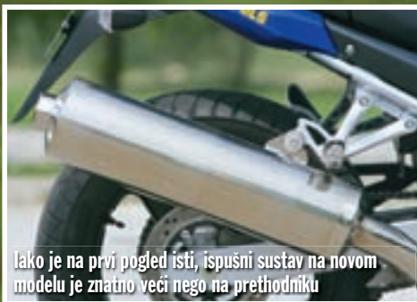
Iako je na prvi pogled isti, ispušni sustav na novom modelu je znatno veći nego na prethodniku