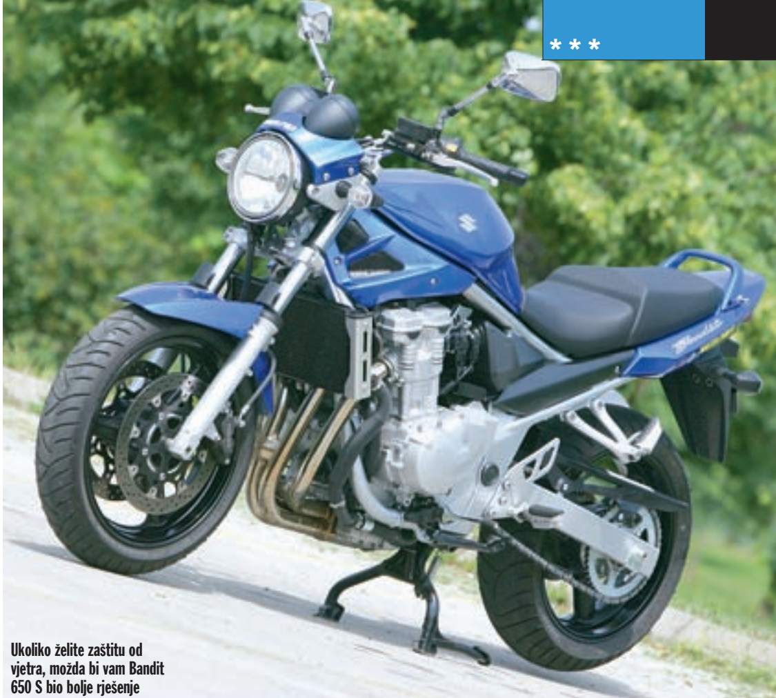
Ukoliko želite zaštitu od vjetra, možda bi vam Bandit 650 S bio bolje rješenje

Što se tiče kočnica, u Suzukiju su na novom Banditu napravili osjetan napredak u odnosu na stari model. Doduše, straga nije bilo nikakvih pro-