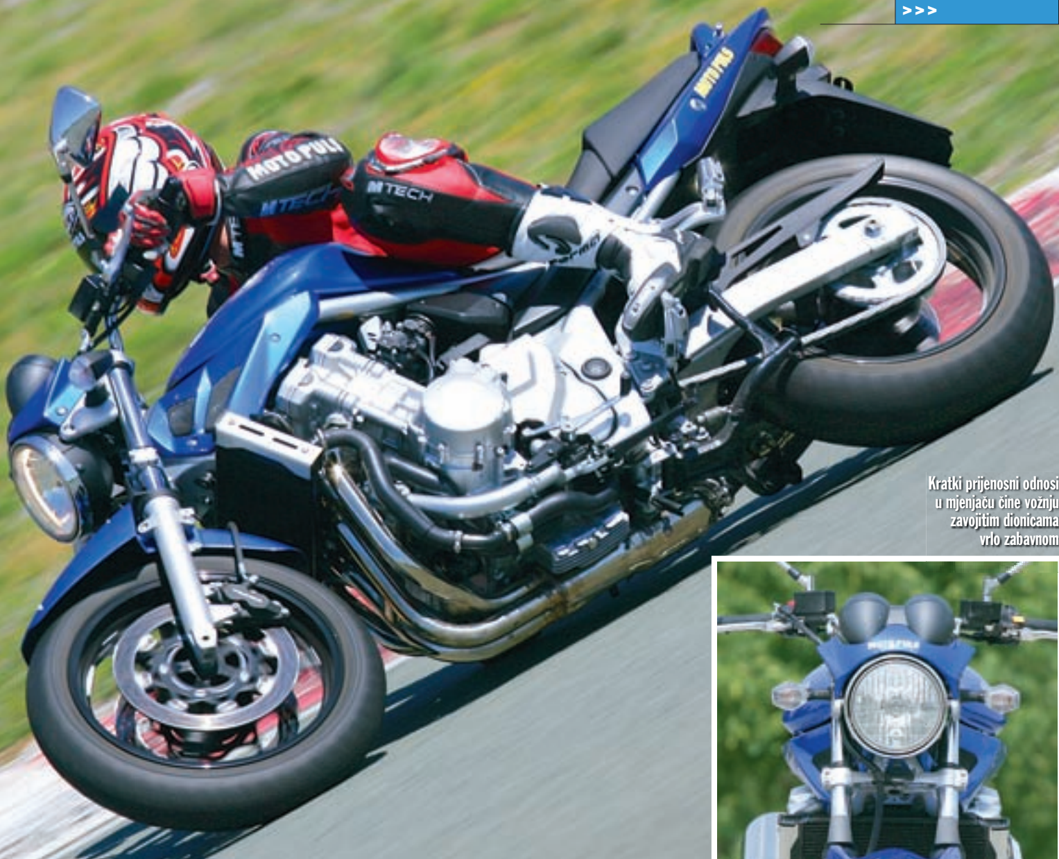
Kratki prijenosni odnosi u mjenjaču čine vožnju zavojitim dionicama vrlo zabavnom