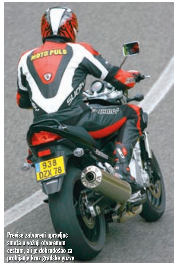
Previše zatvoreni upravljač smeta u vožnji otvorenom cestom, ali je dobrodošao za probijanje kroz gradske gužve

Možda se to po imenu ne bi dalo naslutiti, ali Bandit je zapravo vrlo uglađen i fin motocikl, pravi gospodin. ■