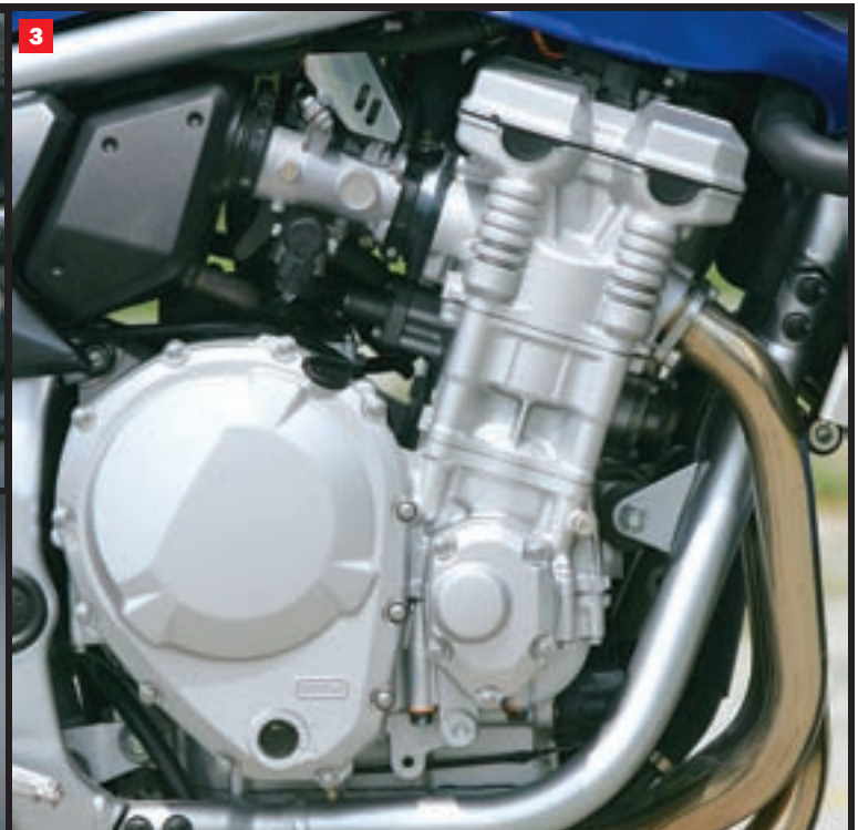
(1) Možda najveći napredak postigle su kočnice, za koje imamo samo riječi pohvale (2) Novi agregat ima i elektronsko ubrizgavanje goriva (3) Novi Banditov pogonski agregat, odsad hlađen tekućinom i sedam konjskih snaga jači