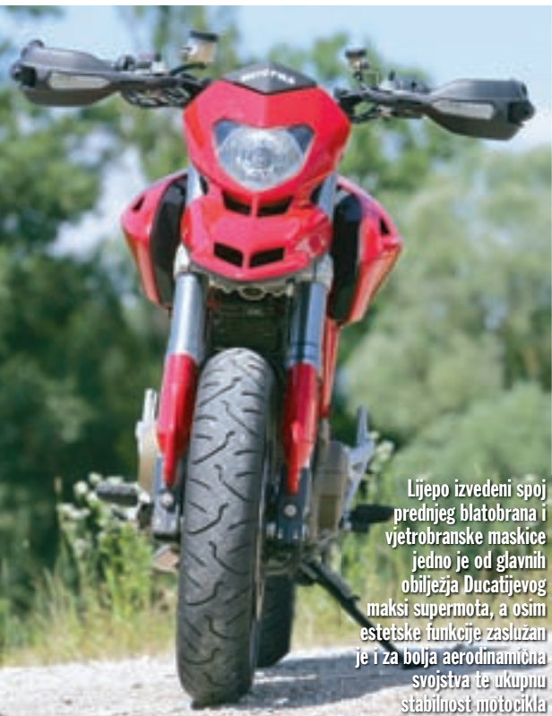
Lijepo izvedeni spoj prednjeg blatobrana i vjetrobranske maskice jedno je od glavnih obilježja Ducatijevog maksi supermota, a osim estetske funkcije zaslužan je i za bolja aerodinamična svojstva te ukupnu stabilnost motocikla

Ubacimo li u ovaj pregled još i lagane Marchesini kotače s krakovima u obliku slova Y, na koje se ugrađuju niskoprofilne gume Bridgestone BT 014 dimenzija 120/70-17 sprijeda i 180/55-17 straga, jasno nam je da se pred nama nalazi čistokrvni sportski motocikl strogo cestovne orijentacije, a ne neki zdepasti terenac koji ponekad omogućava