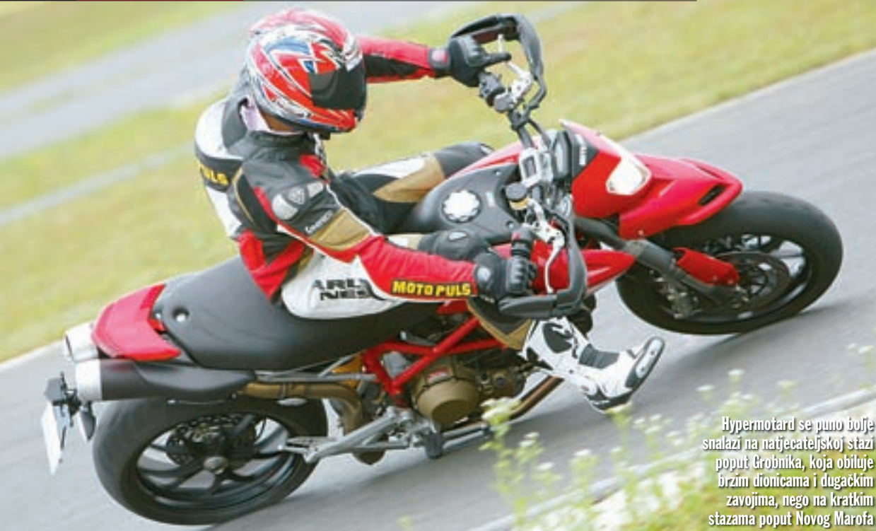
Hypermotard se puno bolje snalazi na natjecateljskoj stazi poput Grobnika, koja obiluje brzim dionicama i dugačkim zavojima, nego na kratkim stazama poput Novog Marofa

nu odjeću morate priznati da na ovom motociklu sve ipak djeluje vrlo skladno i funkcionalno, a opet jednostavno i oku ugodno.