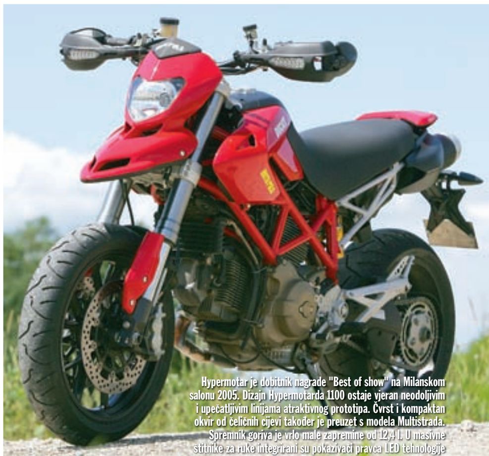
Hypermotard je dobitnik nagrade "Best of show" na Milanskom salonu 2005. Dizajn Hypermotarda 1100 ostaje vjeran neodoljivim i upečatljivim linijama atraktivnog prototipa. Čvrst i kompaktan okvir od čeličnih cijevi također je preuzet s modela Multistrada. Spremnik goriva je vrlo male zapremine od 12,4 l. U masivne štitičke za ruke integrirani su pokazivači pravca LED tehnologije