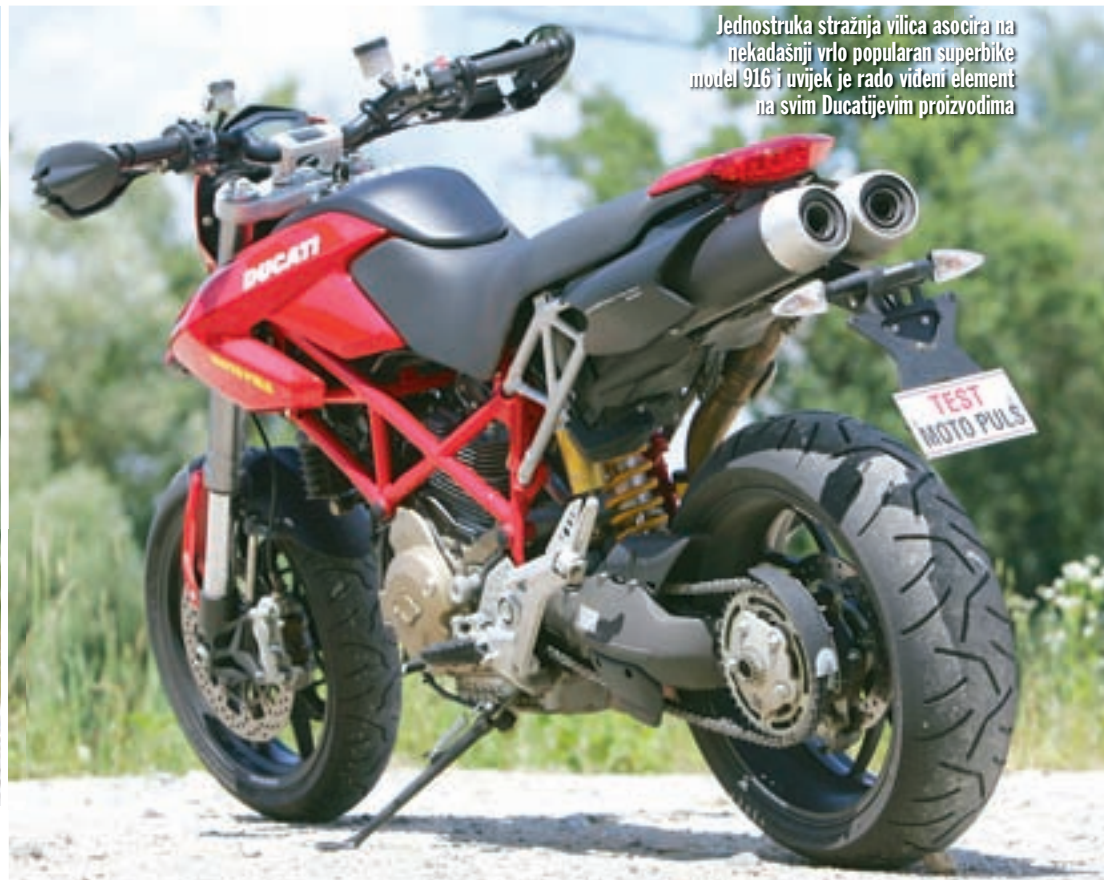
Jednostruka stražnja vilica asocira na nekadašnji vrlo popularan superbike model 916 i uvijek je rado viđeni element na svim Ducatijevim proizvodima