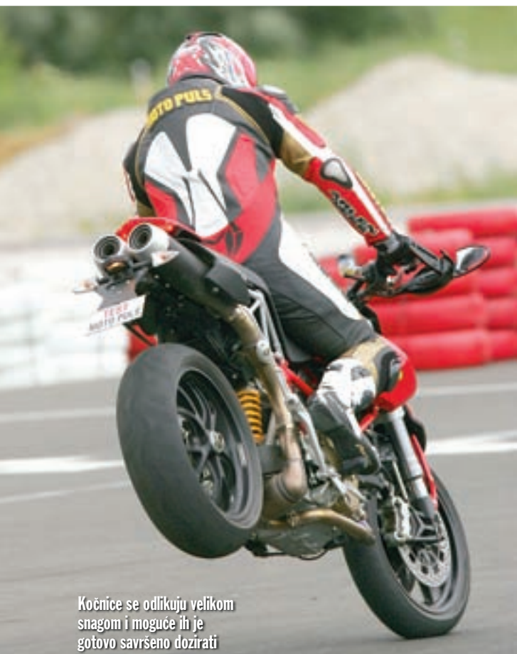
Kočnice se odlikuju velikom snagom i moguće ih je gotovo savršeno dozirati