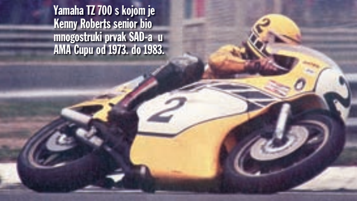
Yamaha TZ 700 s kojom je Kenny Roberts senior bio mnogostruki prvak SAD-a u AMA Cupu od 1973. do 1983.

Bilo je tu i manje poznatih imena, onih koji su se mogli utrkiivati sa svojim idolima i barem im na kratko postati rivalima. Nije postojala FIM-ova ljestvica učesnika, kao na GP-u, samo prijava i kvalifikacije koje su određivale broj natjecatelja. Dakako da je startna lista bila uvijek puna, a u boxovima je ostalo i mnogo natjecatelja koji nisu uspjeli proći kvalifikacije.