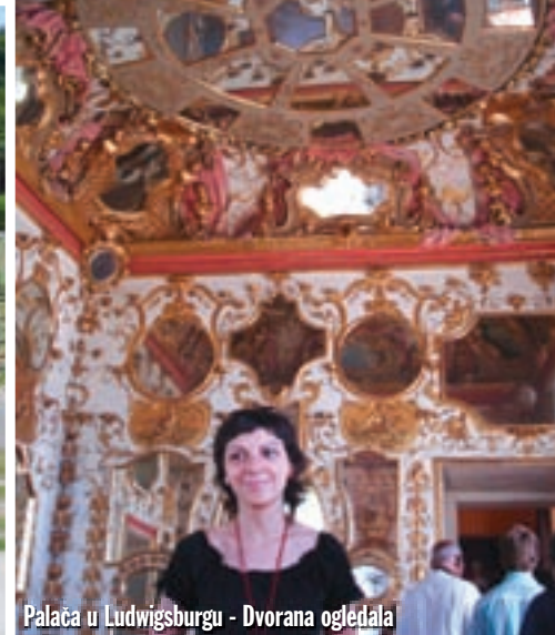
Palaca u Ludwigsburgu - Dvorana ogledala