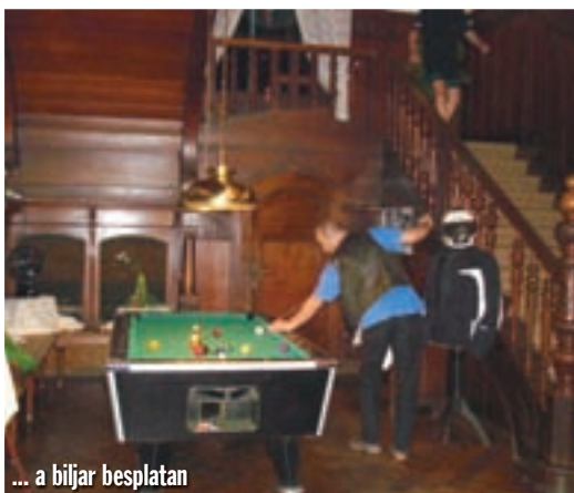
... a biljar besplatan