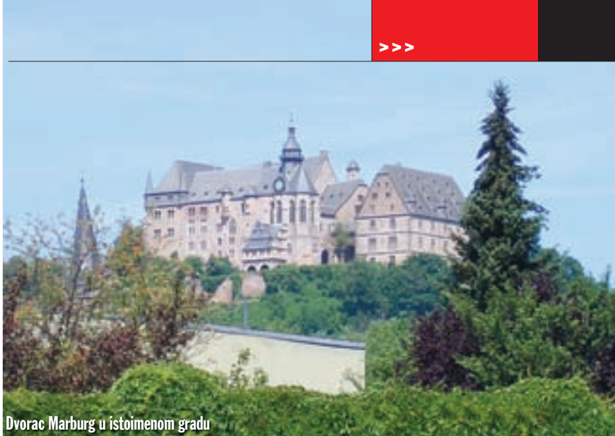
Dvorac Marburg u istoimenom gradu

Teško je opisati osjećaje koji preplave motorista kada vidi nešto takvo. Sa same ceste vilu je nemoguće vidjeti jer je okružena živicom visokom naj-