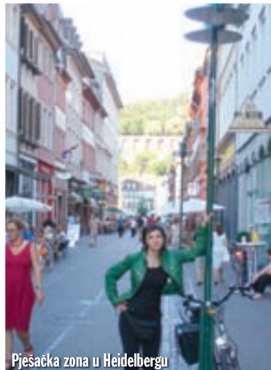
Pješačka zona u Heidelbergu