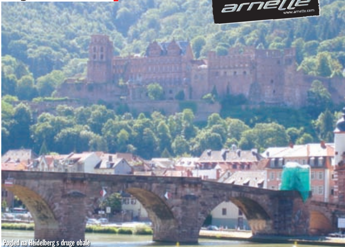
Pogled na Heidelberg s druge obale