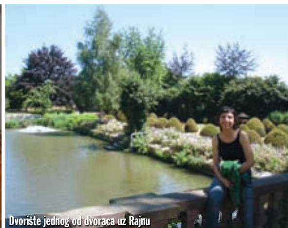
Dvoršte jednog od dvoraca uz Rajnu

koji sam spazio dok smo prolazili. Vraćamo se i dobivamo zgodnu sobu s balkonom u starinskom stilu. Kada smo se raspakirali i osvježili odlučujemo da ćemo ovdje i jesti. Naručujemo gulaš i, naravno, oboje naručujemo piće. Nakon svega naručujem i dvije kugle sladoleda sa šlagom. E sad, zašto to sve nabrajam? Zato jer smo za dobar gulaš kojeg smo se stvarno najeli platili 3 eura, a za sladoled 6, te šlag još 1 euro! Eto zato. Paradoksalno zar ne? Siti i odmoreni krećemo u Heidelberg. Šetamo starim djelom grada nad kojim dominira veliki utvrđeni dvorac koji zbog zalaska sunca poprima sve crveniju boju. Do njega se može pješice, što nam se, naravno, ne da ili nekakvim križancem vlaka i