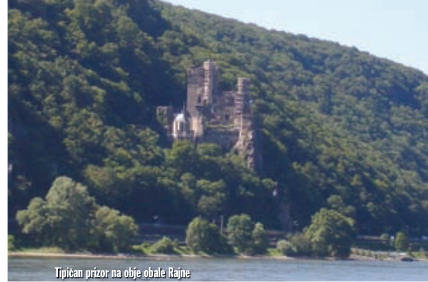
Tipičan prizor na obje obale Rajne

ali uskoro ćemo je se riješiti i doći na područje kojem se najviše veselimo. Evo zašto: Vrlo blizu Wiesbadena, kod mjesta Eltville, silazimo s auto-bahna. Nakon kraće pauze uz sladoled i limunadu iz Eltvillea krećemo uz rijeku Rajnu prema Bingenu i gore, na sjever, prema Koblenzu. Upravo je to područje jedno od najvrijednijih zaštićenih područja u UNESCO-voj svjetskoj riznici. Naime, otprilike 40 dvoraca i utvrda rasprostrlo se na potezu od samo 65 km. Nigdje drugdje na svijetu ne postoji tolika koncentracija dvoraca na tako malom području! Prava poslastica za nas.