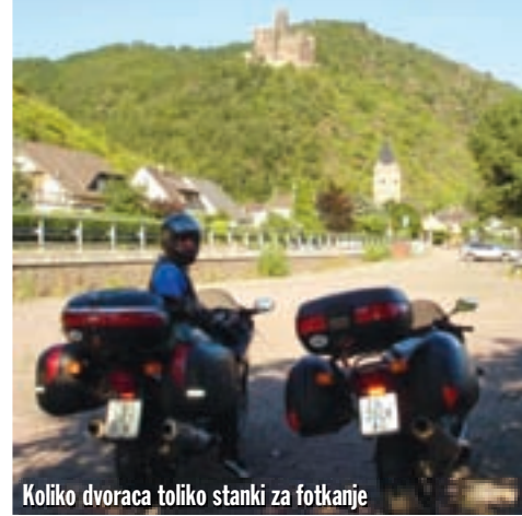
Koliko dvoraca toliko stanki za fotkanje

dali još dva dvorca, od kojih je jedan preuređen u moderan i skup restoran, što se vidi tek kad mu se dođe već sasvim blizu, a u drugom se također nalazi restoran, muzejski dio, ali i dio u kojem žive vlasnici, pa je zatvoren za posjete. I tako nismo došli niti blizu onoga zbog kojeg smo u stvari skrenuli. Tko zna koliko bismo još vremena potrošili tražeći ga, pa smo odlučili krenuti dalje uz rijeku. Znali smo, naime, da imamo još dosta za vidjeti, a i ogladnili smo, pa je trebalo pronaći neko zgodno mjesto za ručak. Nažalost, vrijeme je okrutan suputnik ako ga nemate dovoljno i zato ponekad treba ili dobro planirati ili biti discipliniraniji jer nam se to lutanje kasnije malako osvetilo. Svega nekoliko kilometara dalje stajemo u mjestu Rudesheim, čija se glavna ulica pruža uz rijeku (nešto što