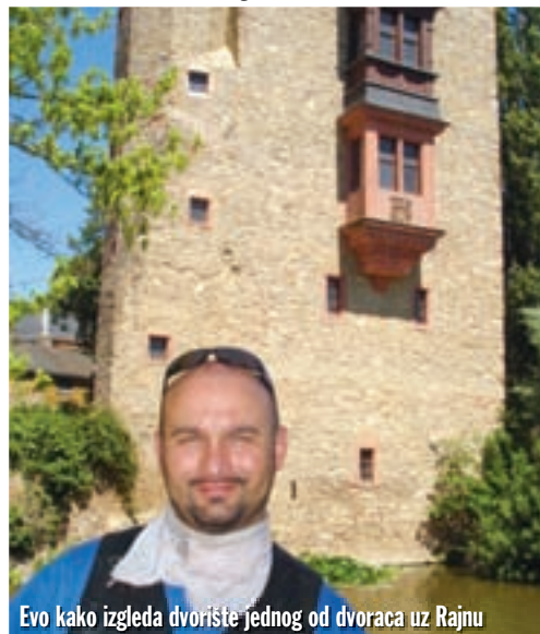
Evo kako izgleda dvorište jednog od dvoraca uz Rajnu

otkrili prije par godina u potrazi za hranom. Nalazi se u mjestu Trieben (istoimeni izlaz s autoputa), 267 km od Zagreba. Super fina klopica i - što je najvažnije - velika terasa uz kružni tok kojim prolaze gomile motora na svo-