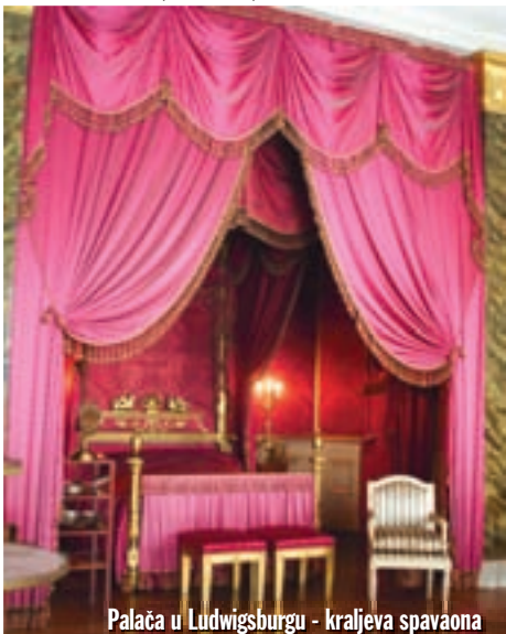
Palaca u Ludwigsburgu - kraljeva spavaona

silazimo s autoceste i spuštamo se na magistralne i lokalne ceste. Isto tako, bio sam sretan što imamo dva motora i šest kofera, pa smo imali gdje spremiti kožne hlače i čizme. Znamo da je zaštitna oprema važna, ali kada je tako vruće, a na motoru provodiš veći dio dana, normalno je da gledaš kako da si put učiniš što ugodnijim. I tako od Neckarsulma do Heidelberga pratimo rijeku Neckar i uživamo klizeći krasnom cestom, pokušavajući vidjeti i upiti što više od onoga što nam se nudi kao na pladnju. Ima tu stvarno svega: od malih sela sa samo nekoliko kuća od dvorca i prekrasnih pejzaža. Nailazi i nekoliko vrlo dobro očuvanih oldtimer automobila koje voze ljudi obučeni u skladu s godinama u kojima su proizvedeni njihovi metalni ljubimci. Super izgleda i tip duge kose, gol do pasa u kožnim hlačama na Harleyu s "ape hangerom". Sve izgleda nestvarno kao da smo upali u neki film. S vremena na vrijeme zaustavljamo se da nešto prokomentiramo ili samo da bismo malo uživali u pogledu na sve što nas okružuje. Polako dolazimo do Heidelberga. U gradu je lagana gužva, pa se zaustavljamo i odlučujemo da je bolje vratiti se u mjesto kroz koje smo malo prije prošli i tamo uzeti sobu u Gasthausu