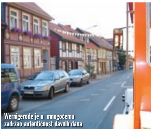
Wernigerode je u mnogočemu zadržao autentičnost davnih dana