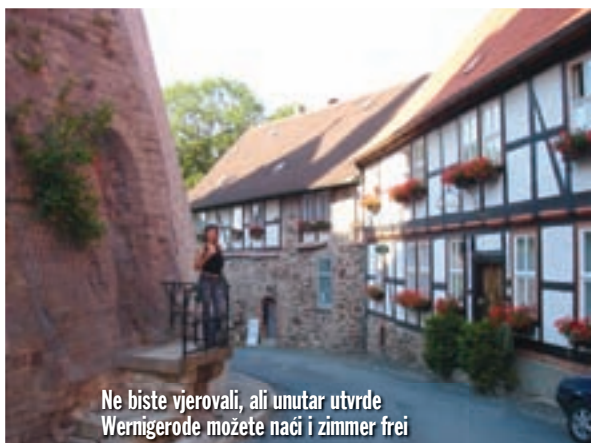
Ne biste vjerovali, ali unutar utvrde Wernigerode možete naći i zimmer frei