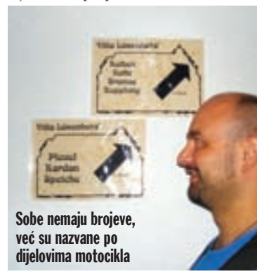
Sobe nemaju brojeve, već su nazvane po dijelovima motocikla

Po otvorenim koferima i ostavljenim kacigama na drugim motorima oko nas te pozitivnoj atmosferi koja je gotovo opipljiva, zaključujemo da je ovo posve sigurno mjesto, pa i mi ostavljamo naše stvari na motorima i odlazimo na recepciju prijaviti se. Putem do recepcije komentiramo sve čime smo okruženi i ne možemo doći k sebi. Sretni smo kao djeca. Pitam Jasminu je li rezervirala sobu i odgovara mi da nije. Meni to baš i nije drago, a ona kaže kako je mislila da neće biti potrebno, a da sam to mogao i sam učiniti. I tako dolazimo na recepciju, pitamo ima li slobodnih soba, a kao odgovor dobivamo pitanje imamo li rezervaciju? Što bi rekao lik iz filma Maratonci trče počasni krug: "E, kad me sad nije šlogiralo!". Pogledamo