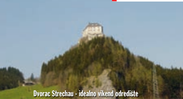
Dvorac Strehau - idealno vikend odredište