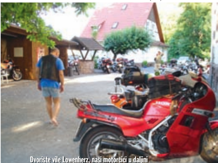
Dvorište vile Löwenherz, naši motorčići u daljini