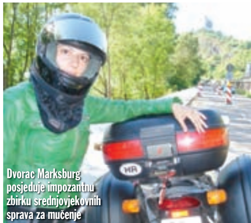
Dvorac Marksburg posjeduje imponantnu zbirku srednjovjekovnih sprava za mučenje

označena je crvenom, a cesta uz istočnu obalu žutom bojom. E sad, crvena boja znači široke, brze ceste, po kategoriji odmah ispod tzv. poluatoceste, kod nas bi to bilo u rangu s Ličkom magistralom. Žute ceste su uže, s više zavoja, sporije, tipa one kroz Gorski Kotar. Mi, naravno, odabiremo istočnu obalu, s kompliciranijom cestom. Ipak, poučeni sad već dugogodišnjim iskustvom vozikanja po Zapadnoj Njemačkoj znamo da ne moramo očekivati nikakve neugodnosti, barem što se tiče stanja ceste i kvalitete asfalta. Vozimo se dobrom, širokom i blago zavojitom cestom koja prati rijeku, uživajući u svemu što nas okružuje. Svako toliko stajemo nešto prokomentirati ili slikati neki od dvoraca koji se stalno pojavljuju na obje riječne obale. Nakon nekog vremena dolazimo u mjestasce Sankt Goarshausen te skrećemo s ceste uz rijeku na cesticu koja se penje uzbrdo i vodi do jednog od najpoznatijih mjesta uz Rajnu. Tamo se nalazi stijena s koje se, kako kaže legenda, mlada djevojka Loreley, očajna zbog nevjernog ljubavnika, bacila u rijeku. Međutim, nije umrla, već se pretvorila u sirenu i od tada svojim pjevanjem mami mornare u smrt. Sama stijena visoka je 120 m i nalazi se na mjestu na kojem je korito Rajne najuže u cijelom njenom toku, od Švicarske