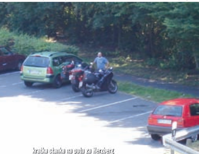
Kratka stanika na putu za Herzberg

Iz Bad Emsa put nas vodi kroz Nassau, Limburg, pored Wetzlara, Marburga (gdje stajemo na odmaralištu radi okrepce, protezanja nogu i fotografiranja imponantnog dvorca koji s jednog brda dominira nad gradom), Kassel i Gottingena do Herzberga u regiji Harz. Što se tiče