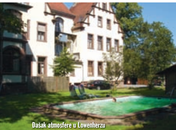
Dašak atmosfere u Lowenherzu