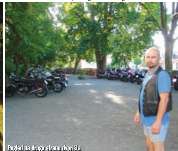
Pogled na drugu stranu dvorišta