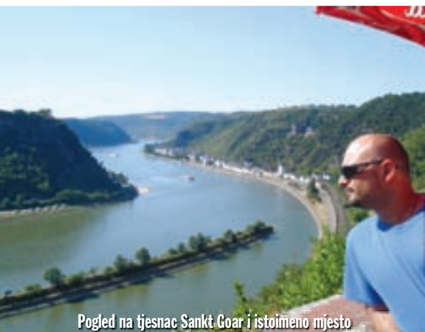
Pogled na tjesnac Sankt Goar i istoimeno mjesto