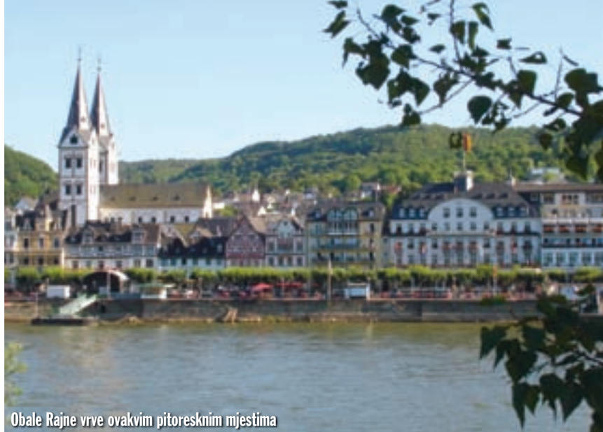
Obale Rajne vrve ovakvim pitoresknim mjestima

označena je crvenom, a cesta uz istočnu obalu žutom bojom. E sad, crvena boja znači široke, brze ceste, po kategoriji odmah ispod tzv. poluatoceste, kod nas bi to bilo u rangu s Ličkom magistralom. Žute ceste su uže, s više zavoja, sporije, tipa one kroz Gorski Kotar. Mi, naravno, odabiremo istočnu obalu, s kompliciranijom cestom. Ipak, poučeni sad već dugogodišnjim iskustvom vozikanja po Zapadnoj Njemačkoj znamo da ne moramo očekivati nikakve neugodnosti, barem što se tiče stanja ceste i kvalitete asfalta. Vozimo se dobrom, širokom i blago zavojitom cestom koja prati rijeku, uživajući u svemu što nas okružuje. Svako toliko stajemo nešto prokomentirati ili slikati neki od dvoraca koji se stalno pojavljuju na obje riječne obale. Nakon nekog vremena dolazimo u mjestasce Sankt Goarshausen te skrećemo s ceste uz rijeku na cesticu koja se penje uzbrdo i vodi do jednog od najpoznatijih mjesta uz Rajnu. Tamo se nalazi stijena s koje se, kako kaže legenda, mlada djevojka Loreley, očajna zbog nevjernog ljubavnika, bacila u rijeku. Međutim, nije umrla, već se pretvorila u sirenu i od tada svojim pjevanjem mami mornare u smrt. Sama stijena visoka je 120 m i nalazi se na mjestu na kojem je korito Rajne najuže u cijelom njenom toku, od Švicarske