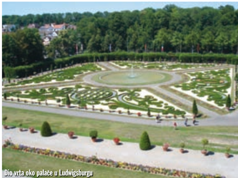
Dio vrta oko palače u Ludwigsburgu