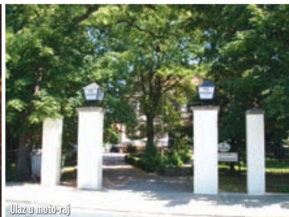
Ulaz u moto-raj