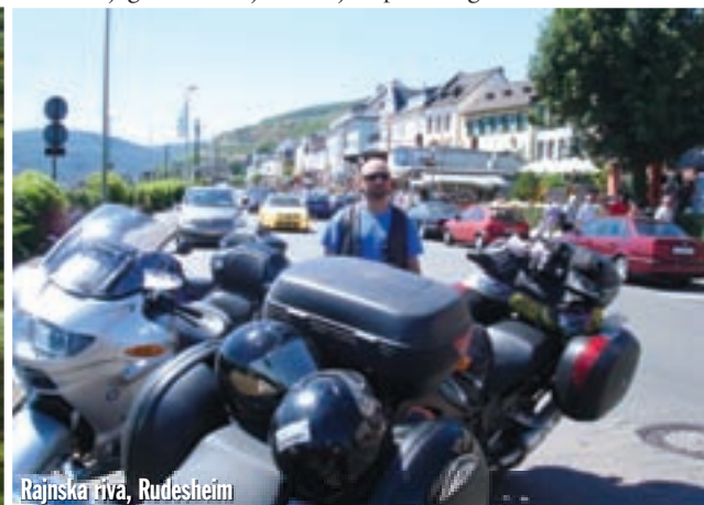
Rajnska riva, Rudesheim