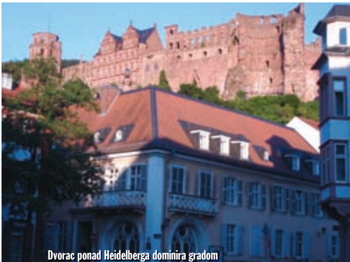
Dvorac ponad Heidelberga dominira gradom