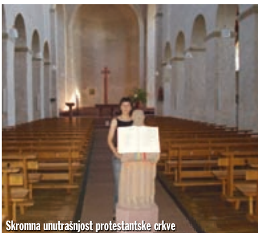
Skromna unutrašnjost protestantske crkve