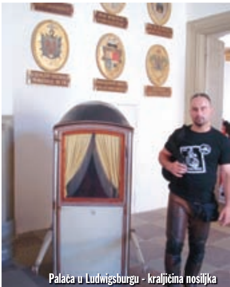
Palaca u Ludwigsburgu - kraljicina nosiljka