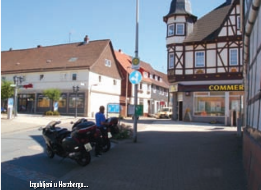
Izgubljeni u Herzbergu...

nešto, a spora vožnja na našim motorima i nije baš bezbolna. Nijemci se ljute, trube i gestikuliraju dok ih pretičemo po duploj punoj, makar ih ni na kakav način ne ugrožavamo jer je cesta poprilično pregledna, a promet iz suprotnog smjera slab.