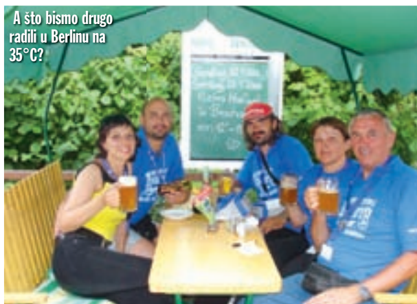
A što bismo drugo radili u Berlinu na 35°C?

štaja u sobama nude i jeftiniju varijantu. Oni u podrumu vile imaju još 3-4 velike sobe s po nekoliko ležajeva na kat. Mislim da je rekla da ih ima pedesetak. Kako na krevetima postoje samo madraci, zgodno je da sa sobom imate i vreću za spavanje. Noćenje u toj varijanti košta 15 eura po osobi, ali mislim da je svota zanemariva u odnosu na to što dobivate kao gost vile. Uz obilnu klopnu, bazen i besplatni biljar tu su još velike tuširaone te sauna, a zgodno je i to da kada se prijavite na recepciji dobijete papirić na koji vam se upisuju sve konzumacije tijekom boravka u vili, pa novac uopće ne morate imati uz sebe nego sve fino platite na odlasku. I tako, žalosni što nismo mogli ostati još koji dan, nešto iza 14 sati napuštamo motoristički raj.