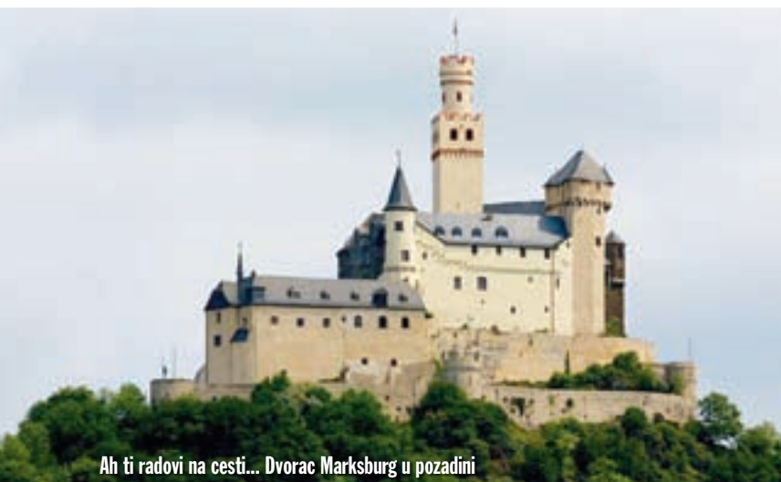
Ah ti radovi na cesti... Dvorac Marksburg u pozadini