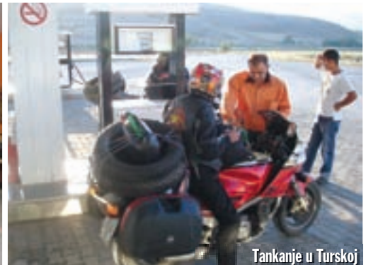
Tankanje u Turskoj