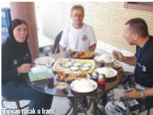
Tipičan ručak u Iranu

Dvadesetak kilometara nakon Tabriza veliki je zeleni putokaz, koji nas usmjerava prema autocesti. A putokaz pažljivo proučava biciklist, koji je sve, samo ne Iranac. Odjeven je u besprijekorno urednu opremu za vožnju biciklom, preko prednjeg i zadnjeg kotača prebačene su torbe za prtljagu. Naravno da smo se odmah zainteresirali i zaustavili da porazgovaramo. Biciklist je Škot i pokušava oboriti svjetski rekord u vožnji biciklom oko svijeta, a to je 70 dana. Kontinente će premostiti avionom. Detaljan plan njegovog puta nisam uspio saznati jer mu se iz razumljivih razloga jako žurilo. Ipak, doznao sam od srdačnog Škota da je nakon Irana njegova slijedeća destinacija Pakistan, te ne vidi razlog zašto bi u toj zemlji trebao imati problema. Pa, ako će on potpuno sam biciklom kroz tu zemlju, zašto se mi trebamo bojati? Na rastanku mu želimo sreću, te smo uskoro na autocesti prema Miyanu. Autoceste u Iranu su besplatne, a zabranjene su za motocikle. Naravno da navedenu činjenicu ignoriramo, te vozimo možda najljepšom autocestom po kojoj sam ikada vozio. Koliko se sjećam, kada sam prije 4 godine vozio obrnutim smjerom, ove autoceste nije bilo. Lijevo i desno od nas izmjenjuju se stijene čudnovatih vulkanskih oblika, smeđih i ružičastih boja. Tu su i kamene pustinje isto tako obrubljene brdima zanimljivih oblika. Autoceste u Iranu su