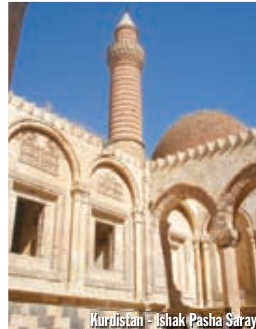
Kurdistan - Ishak Pasha Saray