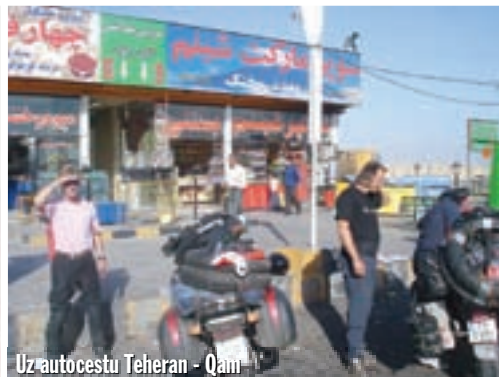
Uz autocestu Teheran - Qam