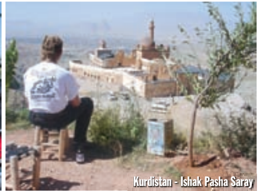
Kurdistan - Ishak Pasha Saray