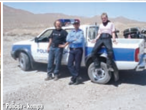
Policija - kompa

pređa mnogom, ne pogodim. To je bio pravi moto-show, ovdje u srcu Irana! Da čovjek ne povjeruje! A što bi tek bilo da imaju GSXR-e ili CBR-e? Svi su bez kaciga, u Iranu nisam vidio da itko nosi kacigu. A onda nešto što nisam mogao vjerovati: Pređa mnogom se pojavio motocikl sa šest ispušnih cijevi! Da li je to zaista to što mislim? Ovdje u Iranu? Nemoguće! Teškom mukom probio sam se između jurećih stovadesetpetica, i zaista: pored mene, bez tablice (koje inače u Iranu imaju svi) vozi Benelli 750 Sei, u originalnom stanju! Jedan od najlegendarnijih motocikala uopće! Prvi šestcilindraš modernog doba! Kada smo stigli do hotela, u onoj gužvi odmah sam krenuo u potragu za Benellijem. Nisam ga našao. Očito ga je vlasnik izvukao samo radi nas, te ga odmah sakrio. Motocikli, koji su do 1980. godine ostali u Iranu, ne mogu se registrirati, dakle niti voziti. Uredan hotel platili smo vrlo malo.