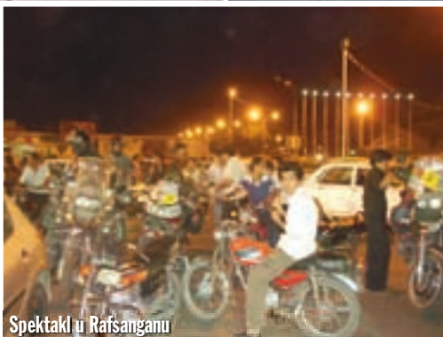
Spektakl u Rafsanganu