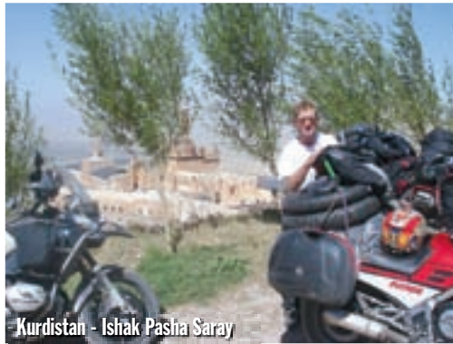
Kurdistan - Ishak Pasha Saray