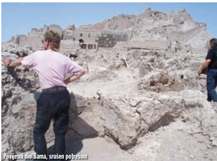
Povijesni dio Bama, srušen potresom