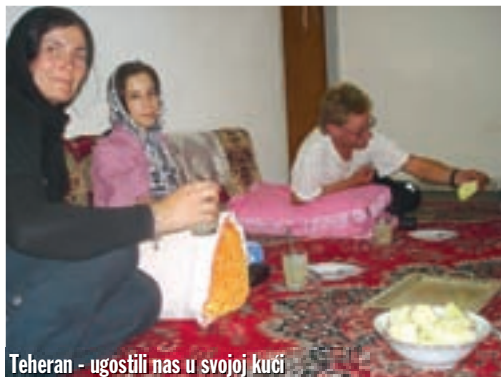
Teheran - ugostili nas u svojoj kući