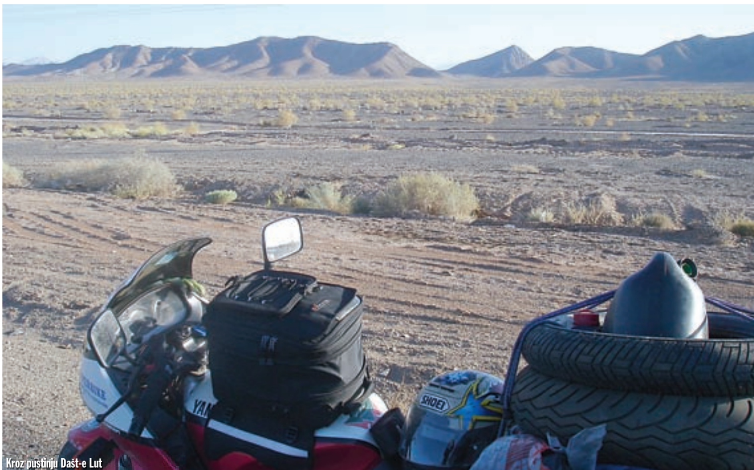
Kroz pustinju Dašt-e Lut

koholno pivo, koje meni nimalo ne odgovara.