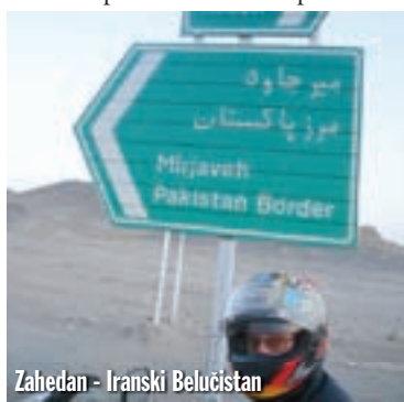
Zahedan - Iranski Belučistan

kažu, hotel je zatvoren. Očito nisu u kontaktu sa svojim kolegama, koji su nas baš tamo poslali: Zahtijevali su da ih slijedimo do našeg hotela, gdje su u dvorištu obavili više telefonskih razgovora. Sada smo shvatili da je i iranska strana Belučićana opasna, mogao bih reći: vrlo opasna. Sve to ne bismo ni znali da smo po danu stigli na granicu. Kažu nam da uzmemo stvari i motore, te da ih slijedimo. I tako pod pratnjom civilnih vozila prelazimo opet onu policijsku kontrolu, iz koje su nas otpratili u onaj «hotel». Odveli su nas prema granici, u carinsku zonu, u sklopu koje je potpuno normalan hotel, barem za iranske prilike. Nikome od nas nije jasno zašto nas prvi puta nisu poslali ovamo! Uredne sobe i dobra večera uz bezalkoholno iransko pivo, obilježili su ovu večer. Srdačno smo se pozdravili s glavnim inspektorom koji je koordinirao cijelom akcijom, te sjeli van, uz motore. Malo smo pregledali nivo ulja te uživali u toploj iranskoj noći. Dan je bio napet. Uz današnjih 779 kilometara i ove večernje šokove, dobro smo spavali. Ovdje, na kraju prolaska kroz Iran, mogu samo zaključiti da je osim incidenta ovdje na granici u Belučićanu, Iran potpuno sigurna zemlja, ugodna za putovanje. Ceste, ljudi, policija, pa čak i klima, sve je za svaku pohvalu. Treba samo poštivati njihove običaje, a to nije teško: ne konzumirati alkohol, izuti se prilikom ulaska u džamije, a žene se trebaju prikladno obući. Dva puta Iran, uvijek Iran! ■