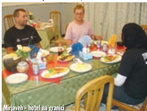
Mirjaveh - hotel na granici