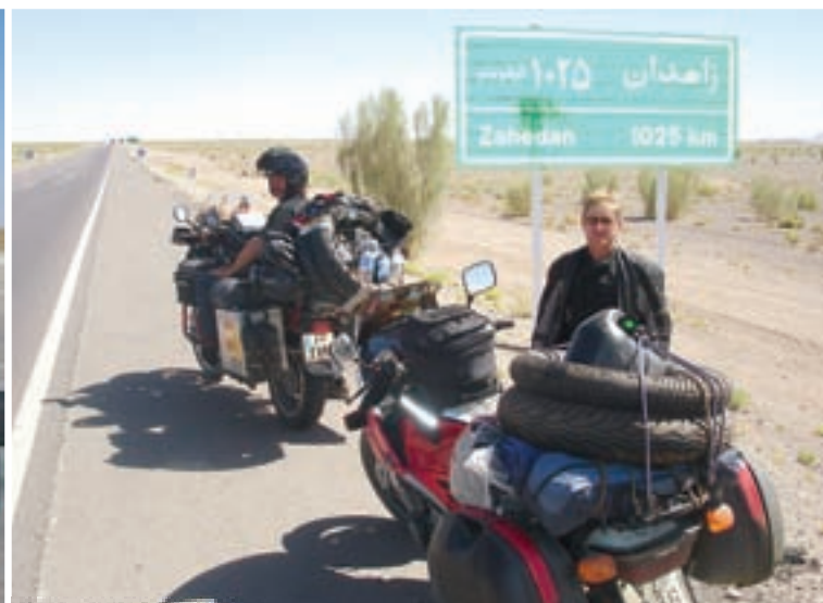
Kroz pustinju Dašt-e-Kavir

vremena samo da nas puste na njihovu stranu kroz splet željeznih ograda. Za svaki slučaj, da tko ne pobjegne! Nakon toga smo cariniku predali karnete, a on je ustvrdio da je Georgov u redu, ali nikada nije čuo za državu Hrvatsku ili Croatiju, tj. takova država ne postoji, adekvatno tome naši karneti su nevažeći! Uvjeravao sam ga da sam sa takvim istim karnetom prije četiri godine bez problema ušao u Iran, a onda se srećom pojavio jedan pametniji koji nam je bez problema sve riješio. I tako smo nešto kasnije ušli u Islamsku Republiku Iran. U Bazarganu odmah pitamo za benzin, na prvoj benzinskoj. Kažu nam da stranci kartice za gorivo mogu kupiti u gradu Mako, 30 kilometara odavde. U Iranu je, naime, problem sa gorivom. Svaki vlasnik vozila dobije mjesečnu karticu (nalik telefonskoj) za kupnju 40 litara goriva. Mi smo već prije putovanja kontaktirali hrvatsko veleposlanstvo u Teheranu i oni su preko iranskog ministarstva vanjskih poslova saznali da možemo kupiti kartice, ali nismo dobili informaciju gdje ih možemo kupiti. U Maku smo nakon četvrtog pokušaja zaista našli benzinsku gdje strancima prodaju kartice. Odmah smo kupili svaki za 500 litara goriva, pošto smo se Iranom namjeravali i vraćati. To me je stajalo 175.000 riala, a promijenili smo znatno manje novca. Tu je nastao problem, dok nije stigao lokalni švercer i promijenio nam novac. Dobio