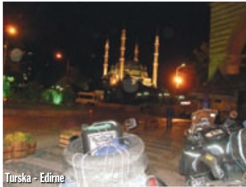
Turska - Edirne