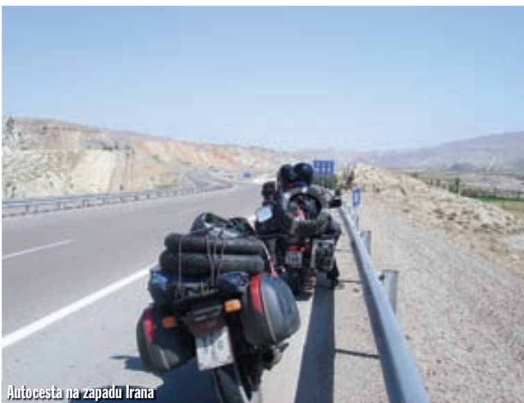
Autocesta na zapadu Irana