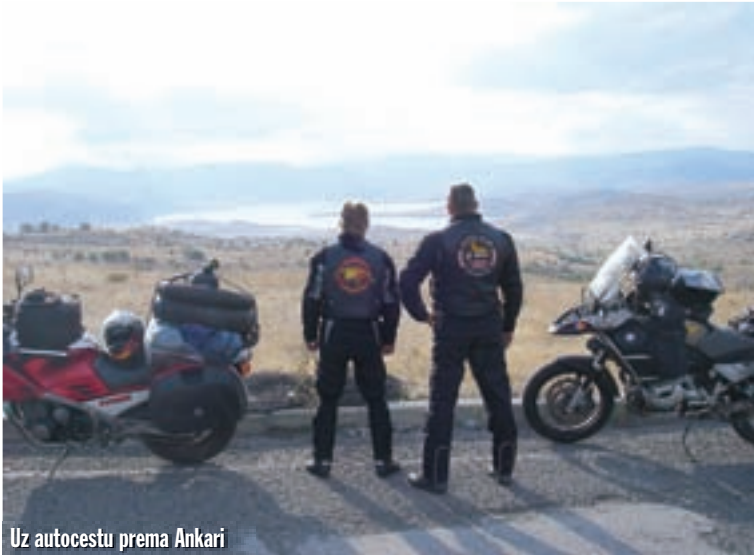
Uz autocestu prema Ankari