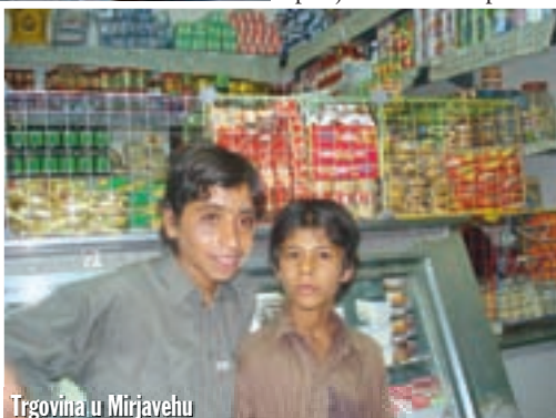
Trgovina u Mirjavehu