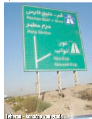
Teheran - konačno van grada

i uzeli si vremena da ga cijelog obidem. To se ne smije propustiti, kada smo već ovdje. Tridesetak kilometara dalje dugačka je kolona kamiona. Na granici smo. Još na turskoj strani švercer nam mijenja eure u iranske riale. Često na granicama nema mjenjačnica, pa smo znali biti u problemima, dođemo u neku zemlju uvečer i nemamo gdje promijeniti novac. Ovome ovdje vjerujemo za kurs, nudi nam 1000 riala za jedan euro. Naučili smo da šverceri s gomilom novčanica nisu prevaranti. Niti ovaj put se nismo prevarili. Obilazimo kamione te rješavamo formalnosti na turskoj strani. Helga preko kose stavlja maramu, jer u Iranu to mora biti tako. Isto tako, žene moraju nositi i majicu dugih rukava. U Iran nije bilo baš lako ući. Čekali smo sat