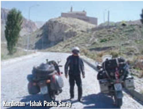
Kurdistan - Ishak Pasha Saray