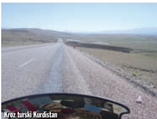
Kroz turski Kurdistan