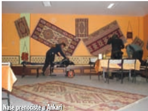
Naše prenočište u Ankari