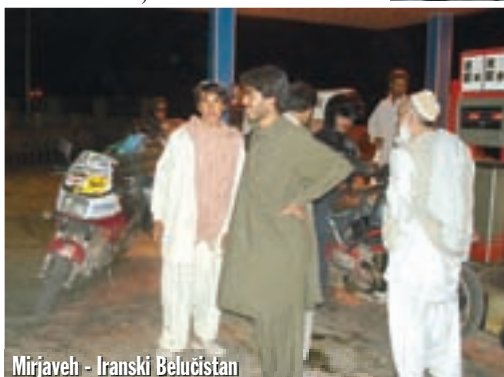
Mirjaveh - Iranski Belučistan