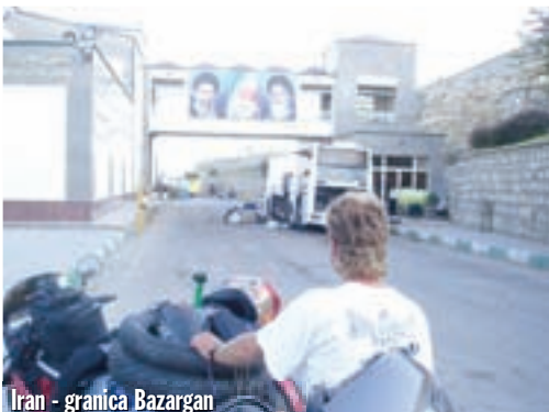
Iran - granica Bazargan