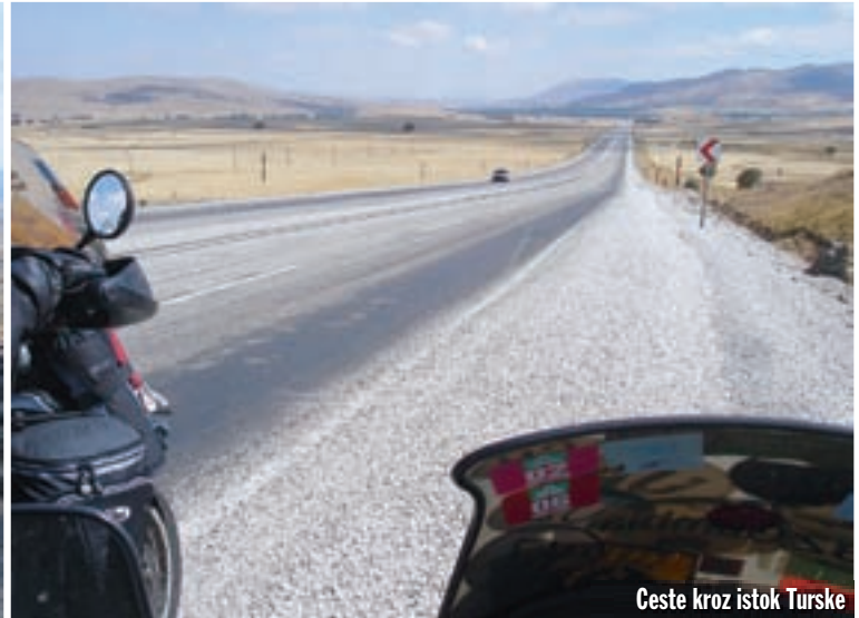
Ceste kroz istok Turske

nas je puta pitao da li zaista baš moramo ići kroz Pakistan. Da, moramo, drugog puta za Indiju nema!