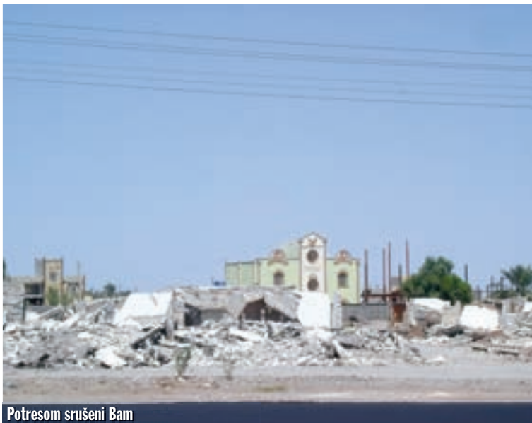
Potresom srušeni Bam