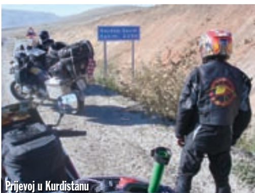
Prjetoj u Kurdistanu