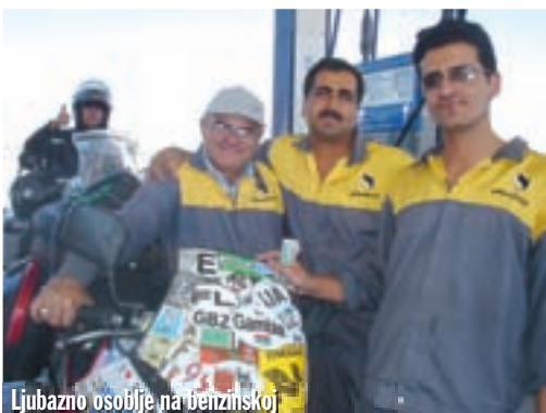
Ljubazno osoblje na benzinskoj