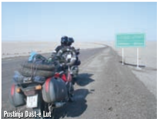
Pustinja Dašt-e Lut

Novi dio grada gotovo je srušen sa zemljom, bilo je ovdje oko 30.000 žrtava. Od citadele, povijesnog dijela, ostale su samo konture. Zaista šteta! Sve je osigurano željeznim cijevima, da se spriječi daljnje urušavanje. Šećemo tim tužnim gradom, priključuje nam se jedan od stanovnika i tugaljivim glasom nam priča o nesretnoj sudbini svoga grada. Teško da će ovo itko ikada dovesti u prvobitno stanje. Na samu citadelu nemoguće je popeti se, zabranjeno je radi opasnosti od urušavanja. Napuštamo Bam, te vozimo pustinjom Dašt-e Lut. Pored ceste, u pijesku, nanizano je ogromno kamenje, a stanovnici ovih krajeva u davni svojoj su mrtve jednostavno polagali na vrhove tog kamenja. Skrećemo s asfalta i vozimo tvrdom pustinjom između tih stijena. Uskoro smo u najistočnijoj iranskoj pokrajini, i jedinoj donekle opasnoj, barem tako kažu. To je Sistan-o-Balučestan. Ovdje, kao i u zapadnom