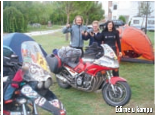
Edirne u kampu