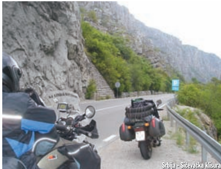
Srbija - Sijevačka klisura