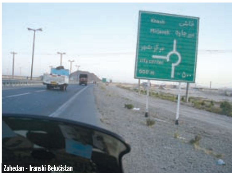
Zahedan - Iranski Belučistan

dijelu Pakistana, žive Belučići, narod koji traži neka svoja prava, kao neovisnost i što ja znam što još. Na ulazu u pokrajinu policijska je barikada, a policajci nas upozoravaju da budemo oprezni. Zašto oprezni, pitam se? Pa sve izgleda idealno, super-cesta, svi nam trube, mašu, pozdravljaju nas, plavo nebo... Zastajemo na kratko na jednoj uzvisini sa panoramom pustinje. Postalo je nepodnošljivo vruće. Termometar na Rakelinom BMW-u označen je do 50 stupnjeva Celzijevih. Kazaljka se naslonila do kraja! Pored mog motora staje jedan Peugeot. Izlaze dva mladića i poklanjaju mi bocu hladne vode! Sam ih je bog poslao, umro sam skoro od žeđi. Već dugo nije bilo niti jednog naselja da bih kupio nešto za piće, a staru zalihu sam potrošio. Na toj temperaturi treba piti barem svakih pola sata, pa makar i toplu vodu, jer se ona vrlo brzo ugrije. Cesta nas vodi kroz slikoviti klanac u gorju Selsele-ye Pir-e Šuran. U Nosratabadu tankamo, a uskoro smo u Zahedanu, glavnome gradu iranskog Balučistana. Ne ulazimo u centar, zaobilazimo ga. Nailazimo na prvi putokaz koji nas upućuje prema pakistanskoj granici. Do pograničnog grada Mirjaveh 85 je kilometara, a već je sumrak. Po sumnjivim predjelima nikada ne vozimo noću, ali smo odlučili stići do granice i navečer obaviti carinske formalnosti, kako bismo uštedjeli na vremenu. Tako po noći vozimo kroz Balučistan, a cesta baš i nije tako dobro označena