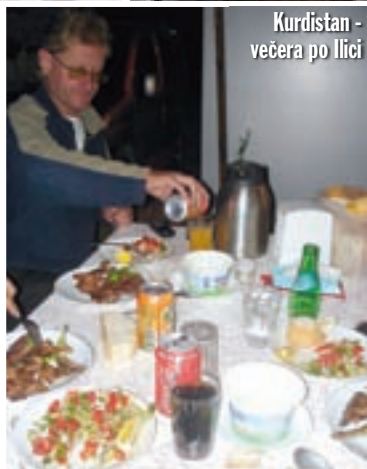
Kurdistan - večera po llici

brdovit, sa isušenim raslinjem, vidi se da smo već u vrućim krajevima. Nama, još uvijek u kišnjacima, nije bilo vruće, nego ugodno toplo, baš sam uživao u vožnji. U Harmanliu tankamo, spustila se noć. Kapitan Andreevo je bugarski pogranični grad, veseli smo što smo uspjeli. Evo nas u Turskoj! I ovdje na granici ide brže nego nekada. Samo je još dvadesetak kilometara do Edirna. Zauostavljamo se pored lijepo osvjetljene Velike džamije, fotografiramo džamiju, vodoskoke, ulice... Kasno je, tražimo kamp. Onaj od prije nekoliko godina više ne postoji, trebalo nam je sat vremena da nađemo sljedeći. Vrata su zatvorena, pa budimo vlasnicu da nas pusti unutra. Nije bila previše ljuta, donijela nam je čak i piće. Dobro zamotanom, bilo mi je ugodno spavati nakon današnjih 1203 kilometara.