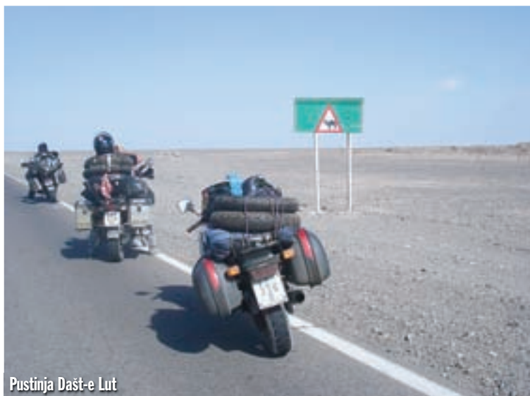
Pustinja Dašt-e Lut