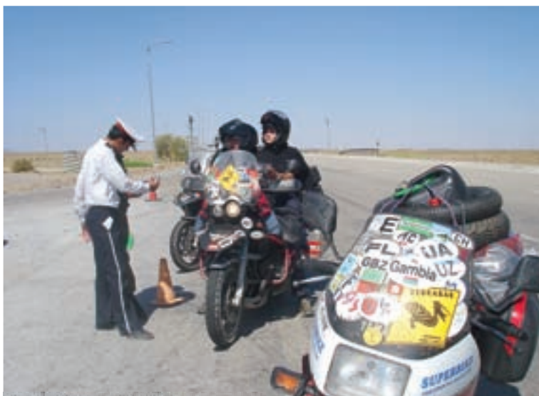
Zaustavljaju nas radi fotkanja