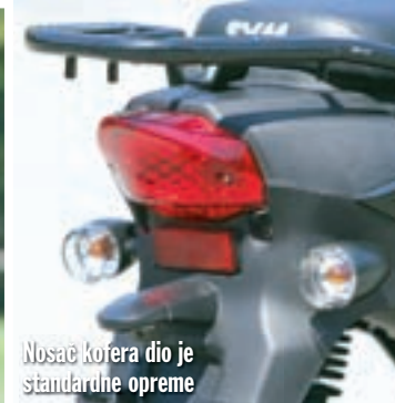
Nosač kofera dio je standardne opreme