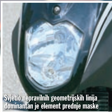
Svjetlo nepravilnih geometrijskih linija dominantan je element prednje maske