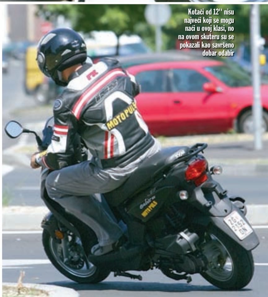
Kotači od 12'' nisu najveći koji se mogu naći u ovoj klasi, no na ovom skuteru su se pokazali kao savršeno dobar odabir

Sve u svemu, izgled je nedvojbeno tipičan azijski i nije previše originalan, no odabir kotača je ono što ovaj