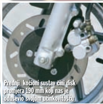
Prednji kočioni sustav čini disk promjera 190 mm koji nas je oduševio svojom učinkovitošću