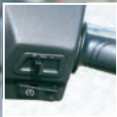
Prekidači su jednostavni i nemaštoviti