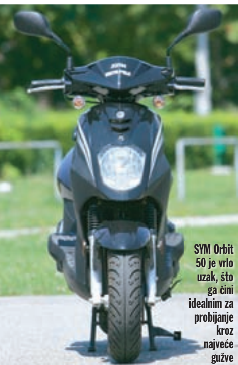
SYM Orbit 50 je vrlo uzak, što ga čini idealnim za probijanje kroz najveće gužve

Ovjes je dobro izbalansiran i čini vožnju ugodnom čak i kada su prometnice ispunjene rupama