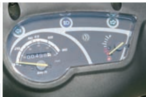
Ploča s instrumentima prema našem je mišljenju previše jednostavna i sadrži samo najnužnije podatke