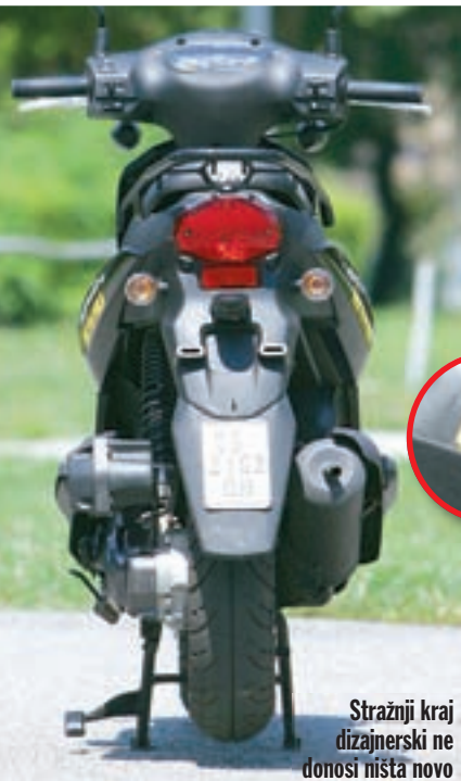
Stražnji kraj dizajnerski ne donosi ništa novo