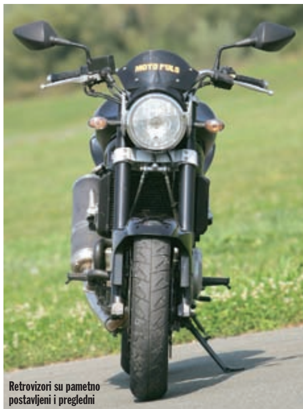
Retrovizori su pametno postavljeni i pregledni

ma, koji od kad znaju za sebe tvrde kako žele posjedovati motocikl, ali si ga – kao - ne mogu priuštiti. Ovaj Hyosung možda i nije baš toliko jeftin da bi ga mogli kupiti na tri bankovna čeka, ali gotovo da ga možete zaraditi u fušu. A vožnja motociklom puno je zabavnija od pukog maštavanja o tome, čak i onda kada na svako duže putovanje sa sobom nosite tablete protiv morske bolesti. Onako, za svaki slučaj. ■