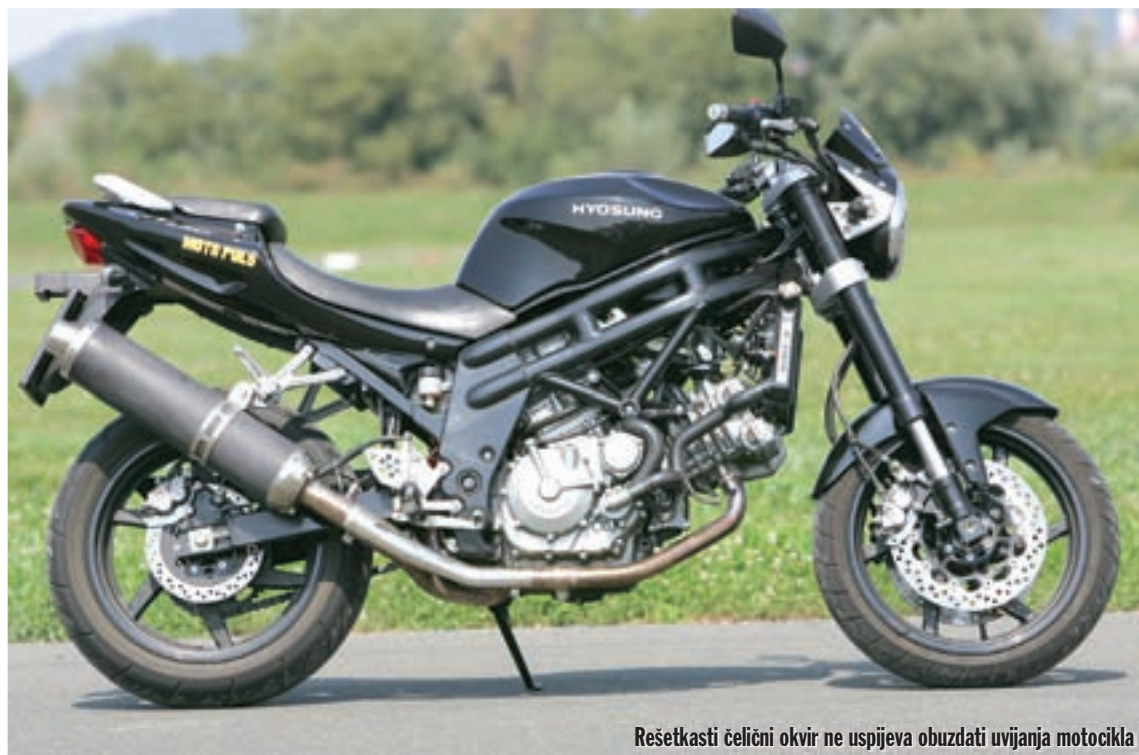
Rešetkasti čelični okvir ne uspijeva obuzdati uvijanja motocikla

Za nešto puno više od toga mu ipak nedostaje sportske tvrdoće.