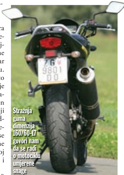
Stražnja guma dimenzija 160/60-17 govori nam da se radi o motociklu umjerene snage

bio predstavljen u vremena kada su Japanci odlučili pljunuti u svoj četverocilindrični tanjur, te su kupcima ponudili silnu svitu različitih dvocilindričnih modela. Suzukijeva perjanica u tom novom V2 valu