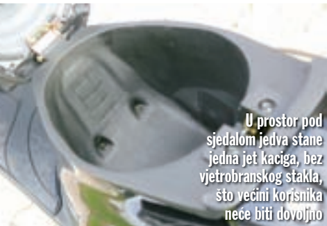
U prostor pod sjedalom jedva stane jedna jet kaciga, bez vjetrobranskog stakla, što većini korisnika neće biti dovoljno

dizajneri su ovom modelu pridodali još poneku sportsku dekoraciju, kao što je uvinuti sportski ispušni sustav te podignuti prednji blatobran u stilu off-road motocikala.