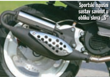
Sportski ispušni sustav savinut u obliku slova „S“