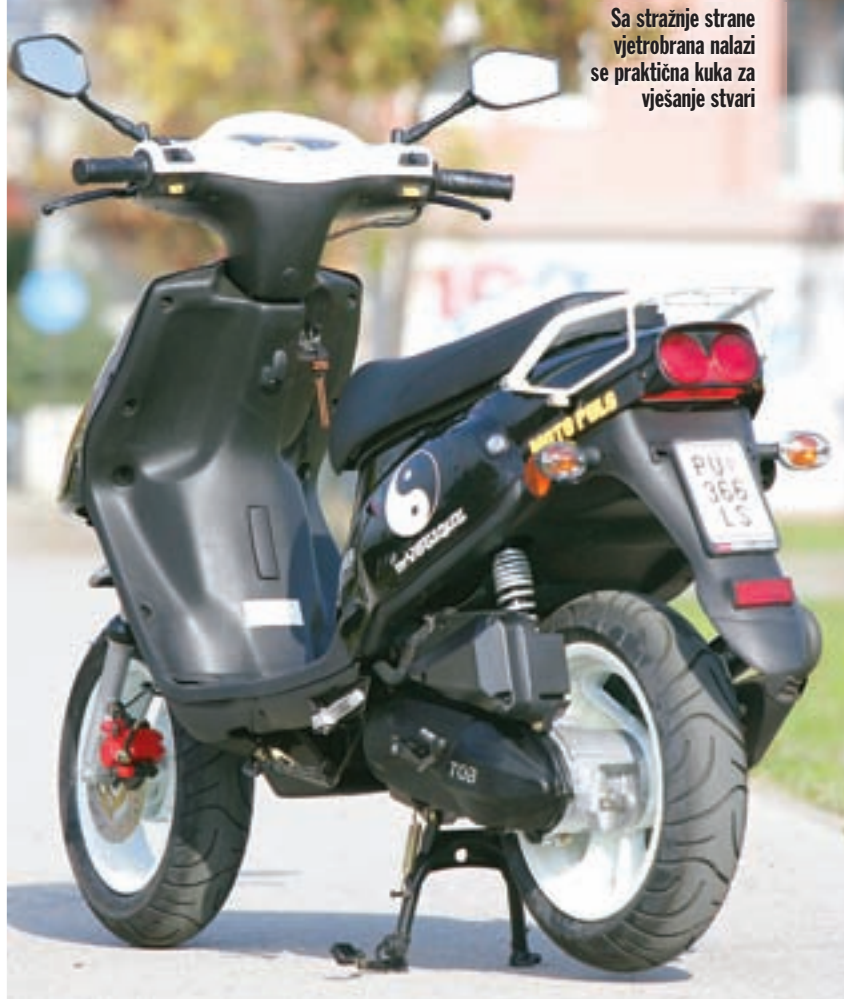
Sa stražnje strane vjetrobrana nalazi se praktična kuka za vješanje stvari

No, bez obzira na ekološke normative i modernu tehnologiju koju nude suparnici, Mystique 50 nas je već nakon nekoliko prijedehnih metara ponovno podsjetio na sve pozitivne osobine dvotaktnih agregata. Prvo i osnovno, dvotaktne 50tke su puno žustrije u ubrzanjima i ostvarivanju performansi nego sve