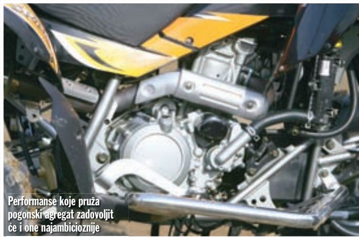
Performanse koje pruža pogonski agregat zadovoljit će i one najambicioznije

stječe dojam kao da se cijeli motocikl lagano spotiče o vanjski prednji kotač. Usporedimo li ga s njegovim tajvanskim konkurentima, onda se Apollo 450 tu nema čega sramiti, međutim, uzmemo li u obzir potencijale pogonskog agregata, onda ipak ostaje žaljenje što ukupna stabilnost donekle sputava iskorištavanje raspoloživih performansi.