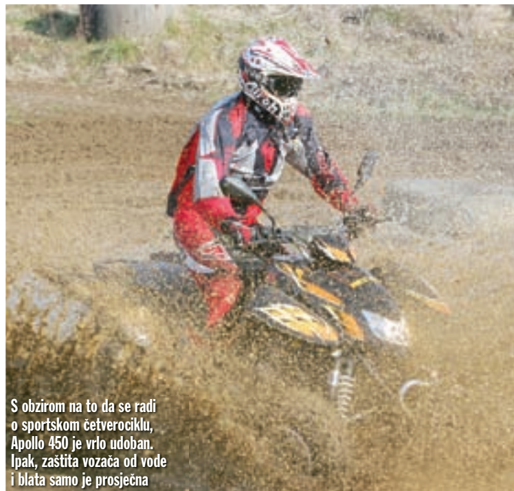
S obzirom na to da se radi o sportskom četverociklu, Apollo 450 je vrlo udoban. Ipak, zaštita vozača od vode i blata samo je prosječna

No, kako smo konstatali na početku testa, nitko nije savršen, pa tako ni Access Apollo 450 RS. Ipak, ovaj četverocikl posjeduje i više nego dovoljno sportskih i inih drugih kvaliteta da ga bez puno razmišljanja stavimo u sam vrh tajvanske produkcije. Štoviše, kada smo prije nepune dvije godine testirali Apollo 250, zaključili smo da se radilo o najekstremnijem tajvanskom četverociklu na našem tržištu, uz bitnu ogradu da tu mislimo na opću koncepciju, ali ne i na ukupne performanse. Kod Apollo 450 RS nema mjesta tog ogradi po pitanju performansi. Jer uz što je ekstreman, ovaj je Access snažan i odvažan. ■