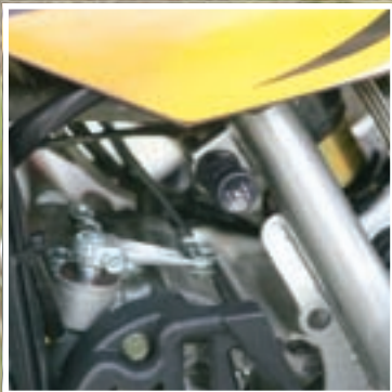
Svojom cijenom od 48.990 kuna Access Apollo više nije posebno jeftin, ali za tu vrijednost nudi solidnu ponudu serijske opreme i vrlo dobre performanse

Na tehnički zahtjevnijim i samim time nešto sporijim dionicama Apollo 450 RS uglavnom ugodno iznenađuje i lako se nosi sa zadanim terenom. Iako nisu savršene, montirane Kenda gume dovoljno kvalitetno prenose