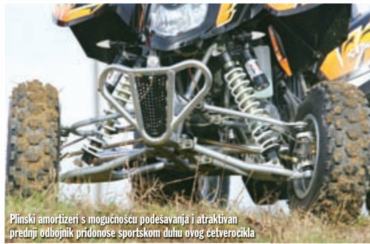
Plinski amortizeri s mogućnošću podešavanja i atraktivan prednji odbojnik pridonose sportskom duhu ovog četverocikla

svu tu silnu snagu na podlogu, a sâm četverocikl pokazuje zavidnu otpornost na nasjedanje na stražnju osovinu. S obzirom na nemalu deklariranu maksimalnu snagu i kratak međuosovinski razmak, s blagim smo nepovjerenjem krenuli u obračunavanje s onim najstrijmijim usponima, međutim Apollo u takvim trenucima nije bio posebno sklon rasterećivanju prednjeg kraja ili neželjenom podizanju na stražnje kotače. Tu je bio vrlo pitom i upravljiv.