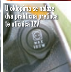
U oklopima se nalaze dva praktična pretinca te utičnica 12V