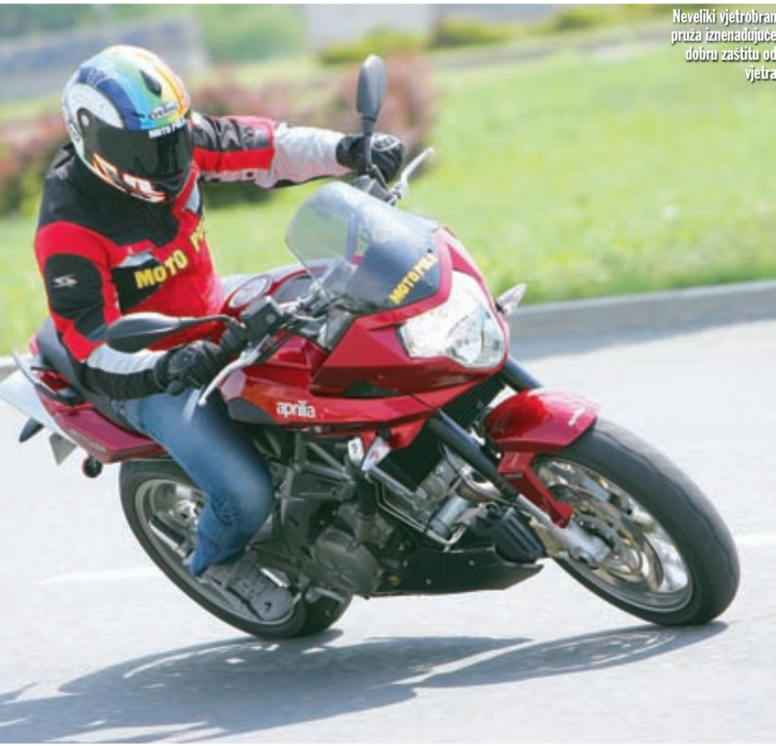
Neveliki vjetrobran pruža iznenađujuće dobru zaštitu od vjetra

odstojanju drži poznata ciklistika koja uključuje stražnju aluminijsku vilicu s jednim amortizerom te prednju izokrenutu vilicu promjera 43 mm. Okosnica svega je hibridni okvir nastao spajanjem dijela od čeličnih cijevi sa stranicama od aluminija, dok je stražnji dio okvira odvojev. Agregat je poznat iz dosadašnjeg Shivera te modela Dorsoduro, a u dva cilindra koji međusobno čine oblik slova V nalazi se ukupno 749,9 kubičnih centimetara radne zapremine. Ljubitelji tehničkih poslastica podsjećamo da je razvod do bregastih osovinu riješen kombinacijom lanca i kaskade zupčanika, dok je napajanje povjereno sustavu elektronskog ubrizgavanja. Obilna elektronika se brine i za paljenje gorive smjese te rad trostaznog katalizatora. Leptirasta tijela u usisnim kanalima otvaraju se posredno, preko sustava ride-by-wire, odnosno bez izravne veze s ručicom gasa, dok spomenuta elektronika omogućava biranje između tri režima rada agregata. Stupanj kompresije mjeri 11:1, što je dovoljno za razvijanje 95 KS pri 9.000 okr/min uz zakretni moment od 80,1 Nm pri 7.000 okr/min.