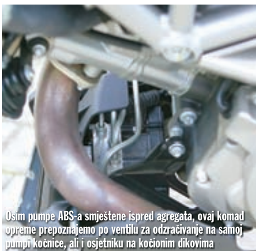
Osim pumpe ABS-a smještene ispred agregata, ovaj komad opreme prepoznajemo po ventilu za odzračivanje na samoj pumpi kočnice, ali i osjetniku na kočionim dikovima