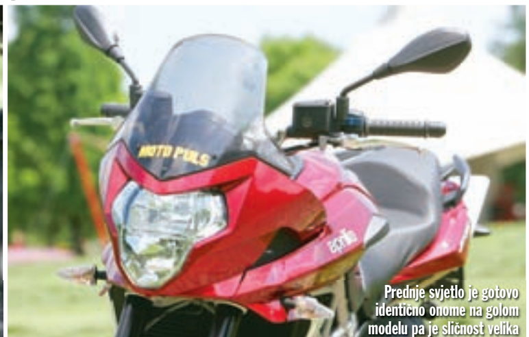
Prednje svjetlo je gotovo identično onome na golom modelu pa je sličnost velika