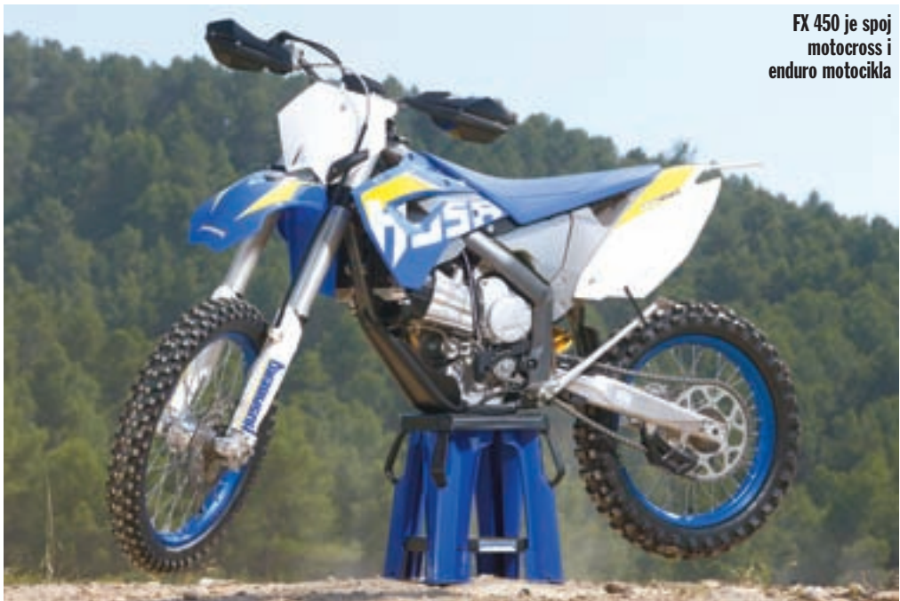
FX 450 je spoj motocross i enduro motocikla

Nakon što smo ga isprobali u okolici Igualade, skloni smo složiti se argumentima koje su prvo imali KTM-ovi, a sada i Husabergovi inženjeri: da je ovaj model predodređen za uspjeh. Zahvaljujući koncepciji pogonskog agregata s cilindrom postav-