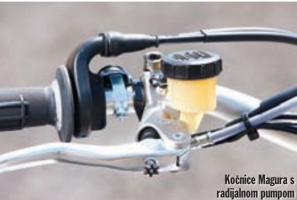
Kočnice Magura s radialnom pumpom

je novom FX-u 450 ujedno donijelo i nešto manju maksimalnu težinu od enduro modela i u ovom slučaju ona iznosi 112,8 kg bez goriva u spremniku zapremine 8,5 litara. Razlike od enduro modela pronaći ćemo i u odabiru kotača i guma, tako da FX ima prednju gumu u dimenzijama 80/100-21, dok se na kompletnoj enduro gami nalazi guma u dimenzijama 90/90-21. Sa stražnjim kotačem je isto, pa tako enduro modeli imaju kotač promjera 18 inča, na kojemu se nalazi guma dimenzija 140/80-18, dok je na FX modelu kotač promjera 19 inča, a guma koja se na njemu nalazi ima dimenzije 110/90-19. Zapravo, ako malo podrobnije pogledamo, FX 450 je sličniji motokros nego enduro modelu, a tome u prilog govori i činjenica da su mu Husabergovi inženjeri namijenili i drukčiju mjenjačku kutiju, s prijenosnim odnosima koji su posve u skladu s motokros filozofijom. Tako je završni prijenos skraćen zahvaljujući većem stražnjem lančaniku, ali istodobno su i prvi i drugi prijenos u mjenjaču duži, dok su peti i šesti skraćeni, što ovome modelu daje doista impresivna ubrzanja. Osim toga, supercross model ima drukčije postavke ovjesa, koje su za potrebe ove discipline znatno tvrđe i konkretnije, a u kombinaciji s manjom ukupnom težinom čine ovaj motocikl puno agilnijim od enduro modela. No zanimljivo je da je FX 450, iako je preuzeo veliki dio fizionomije punokrvnog motokros motocikla, zadržao elektropokretač kao i svi Husabergovi modeli enduro orijentacije.