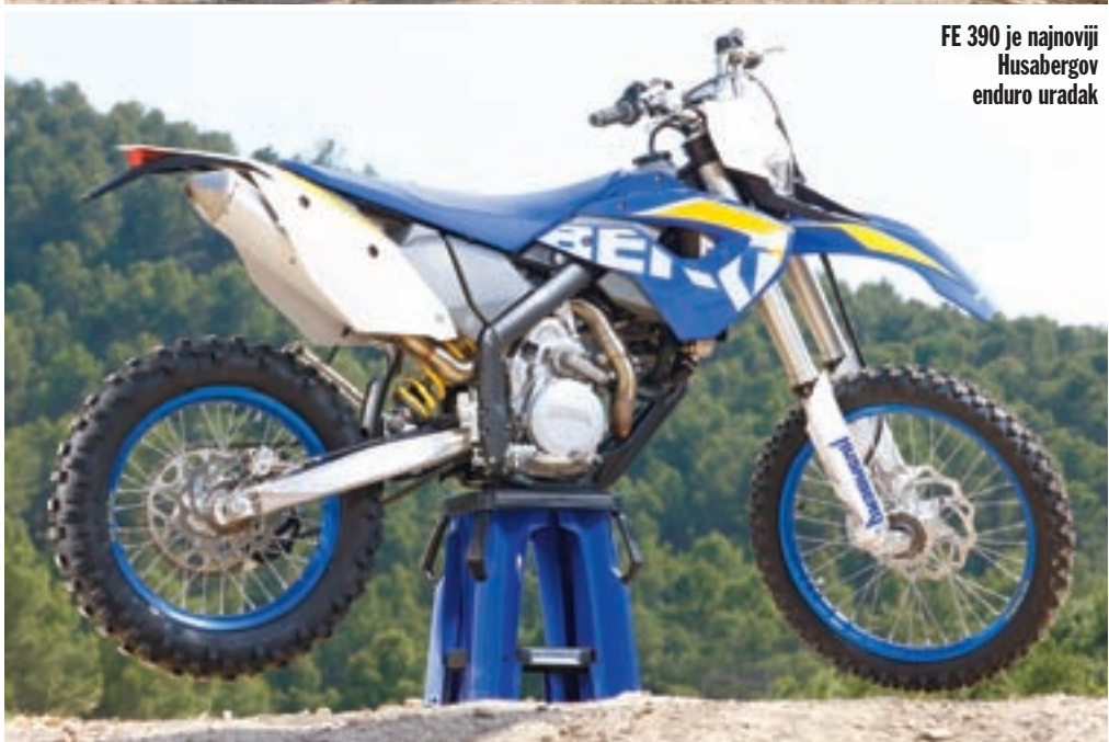
FE 390 je najnoviji Husabergov enduro uradak