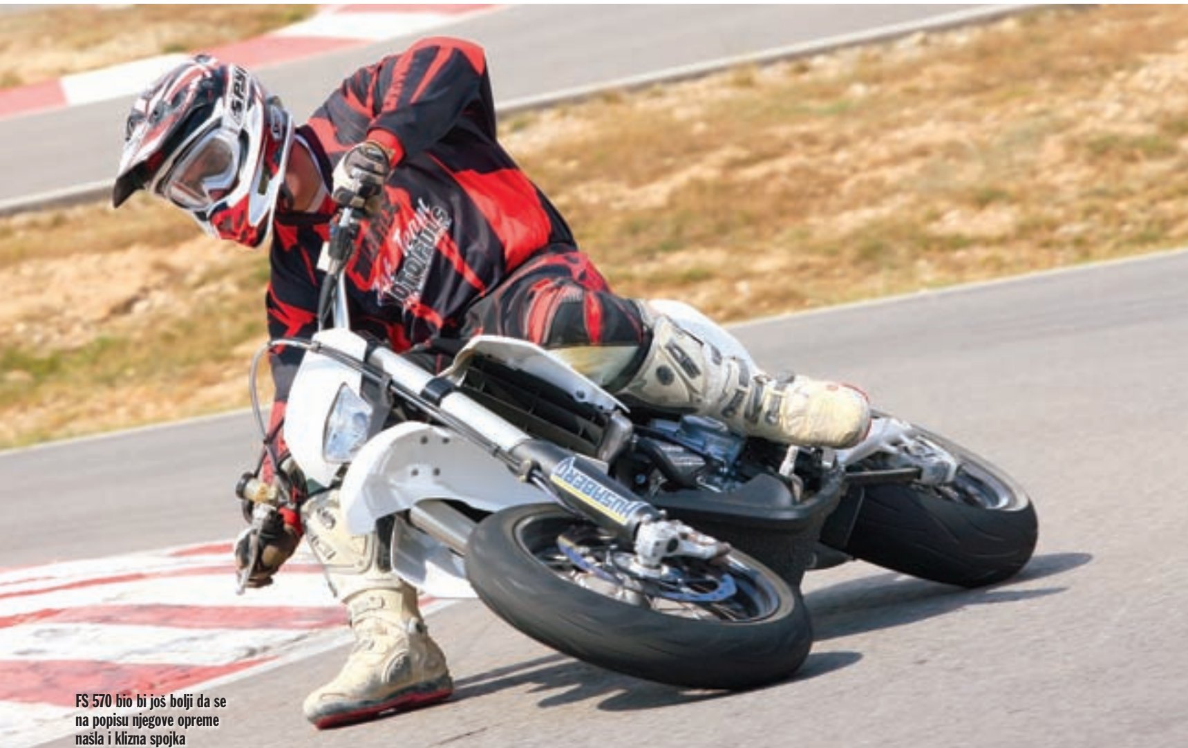
FS 570 bio bi još bolji da se na popisu njegove opreme našla i klizna spojka

Od 1987., kada je nastala, tvornica Husaberg uvijek se ponosila činjenicom da stvara čistokrvne sportske motocikle namijenjene osvajanju svih, pa i najtežih šumskih terena ili supermoto i motokros staza. Iako je sada u vlasništvu austrijskog giganta KTM-a, u čijim se tvornicama i sklapaju motocikli ovoga proizvođača, Husaberg i dalje pri projektiranju svojih motocikala uspijeva zadržati jedinstven pristup prepun inovativnih i praktičnih rješenja koja će zasigurno odrediti smjer razvoja ovoga tipa motocikala u idućih nekoliko godina. No, sva ta inovativnost ipak dolazi sa svojom cijenom, koja u slučaju Husabergove game za 2010. godinu nije mala. Tako nas najviše boli činjenica da nijedan od ovdje predstavljenih modela ne stoji manje od 70 tisuća kuna. Najjeftinije ćete proći ukoliko se odlučite za supercross model FX 450 bez rasvjetnih tijela i mogućnosti registracije, za koji je potrebno izdvojiti 70.590 kn. Cijena se za ostale modele postupno penje za nekoliko tisuća kuna sve do supermoto varijante FS 570, za kojega ćete ostati bez čak 78.600 kn. Ne želimo reći da Husabergovi modeli ne vrijede toliko, jer uživali smo u vožnji svakoga od njih. No ipak bi nam bilo draže da su barem koju tisućicu kuna jeftiniji, to jest da su cjenovno barem u rangu sa svojim najizravnijim konkurentom i onedavno velikim šefom, KTM-om. ■