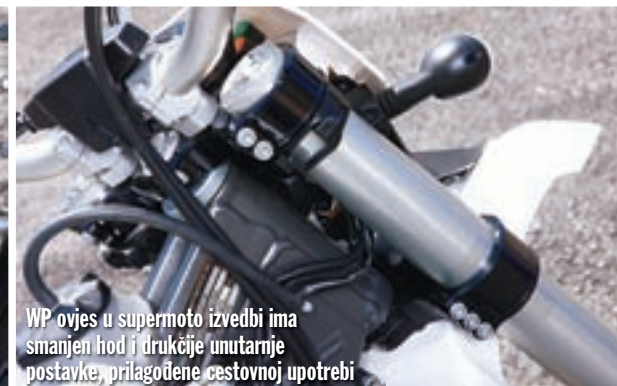
WP ovjes u supermoto izvedbi ima smanjen hod i drukčije unutarnje postavke, prilagođene cestovnoj upotrebi