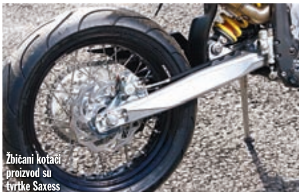
Žbiciani kotači proizvod su tvrtke Saxess

Još jedan novitet iz Husabergove tvornice snova nazvan je jednostavno FX 450, a namijenjen je za cross country vožnje. One su vrlo popularne u Americi, čini se da je i u Europi interes za ovakvom vrstom off road zabave sve izraženiji. Radi se o disciplini koja se vozi po zatvorenom kugu, što bi po definiciji spadalo u motokros, no razlika je u tome što je krug u Cross Country utrkama puno duži i zbog takve konfiguracije traži tip motocikla koji zapravo objedinjuje klasu enduro i motokros, nudeći svojim korisnicima najbolje iz oba svijeta. FX 450 spada upravo u tu kategoriju. To prije svega znači da ovaj model nije opterećen rasvjetnim tijelima i kao takav nije homologiran za cestovnu upotrebu, što znači da ga nije moguće registrirati. To