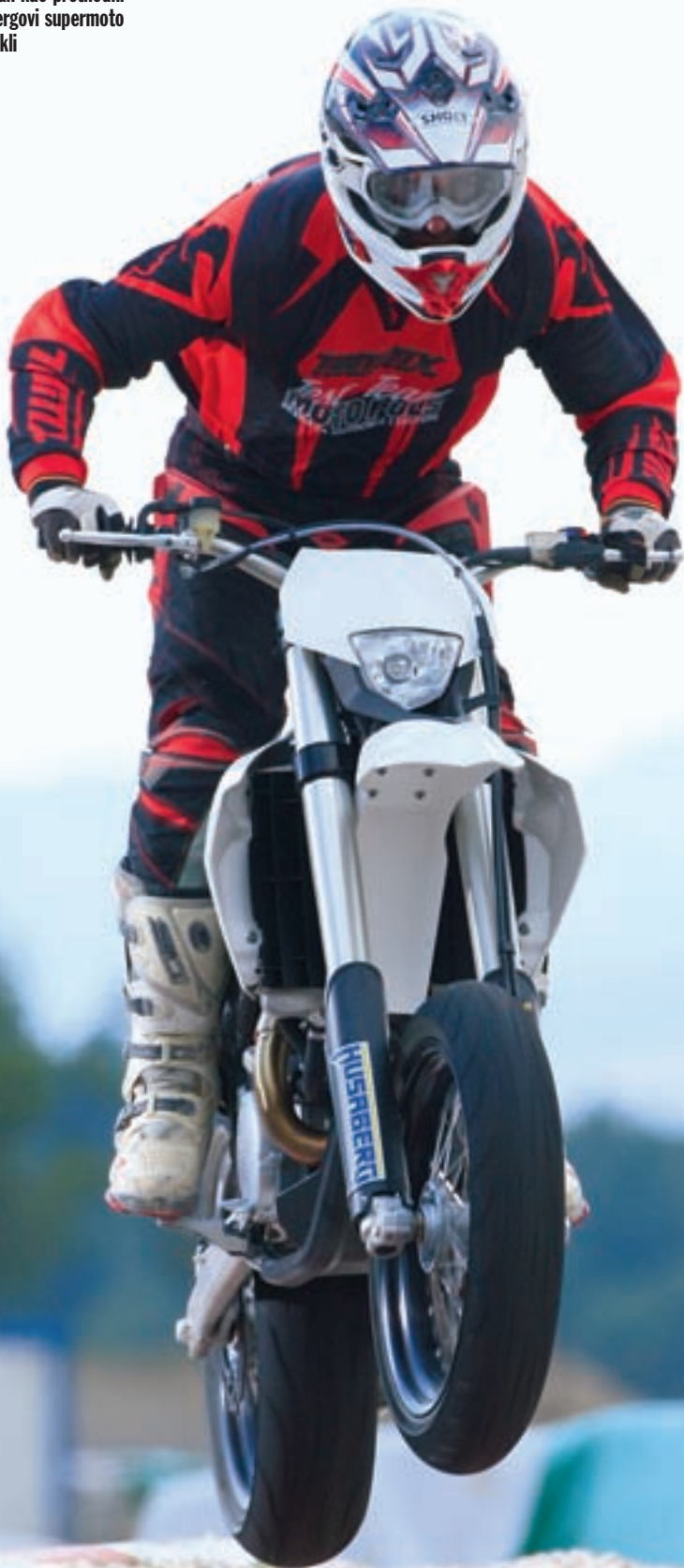
Minijaturna rasvjetna tijela ovdje su samo zato da bi se zadovoljile potrebe homologacije

FS 570 nudi obilje iskoristive snage, a pritom više nije nervozan kao prethodni Husabergovi supermoto motocikli