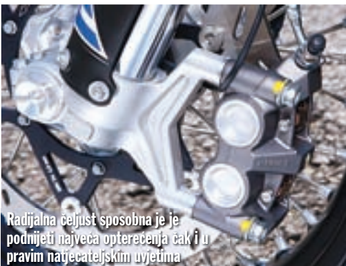
Radialna četjust sposobna je je podnijeti najveća opterećenja čak i u pravim natjecateljskim uvjetima