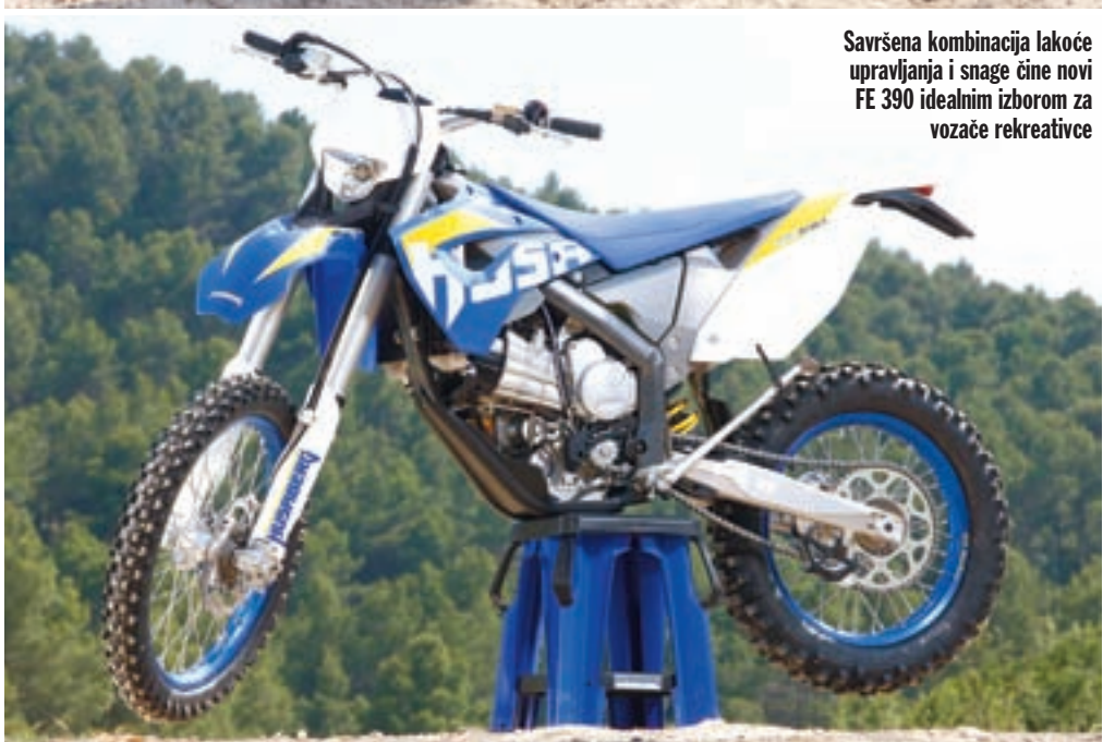
Savršena kombinacija lakoće upravljanja i snage čine novi FE 390 idealnim izborom za vozače rekreativce