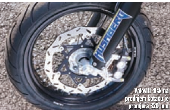
Valoviti disk na prednjem kotaču je promjera 320 mm

Što se pak supermoto ponude tiče, iako proteklih nekoliko godina na tom području kod ovog proizvođača i nije bilo previše novosti, za 2010. nam se Husaberg vraća u velikom stilu sa svojim novim modelom FS 570. Naravno, i ovdje su Šveđani odlučili maksimalno iskoristiti svoja inovativna rješenja primijenjena na svojim prošle godine predstavljenim enduro modelima, pa se tako i FS 570 može pohvaliti izuzetno uglađenim agregatom s cilindrom smještenim pod kutom od 70°. Ukupno gledajući, Husabergovi su inženje-