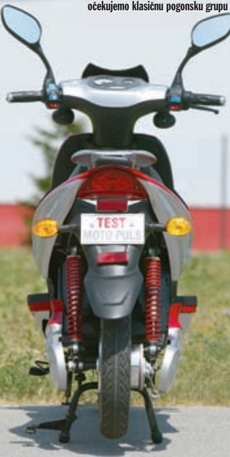
Jedina specifičnost je pomalo prazan izgled prostora gdje očekujemo klasičnu pogonsku grupu

a u ovom slučaju su to gel-olovni akumulatori ukupnog napona 48 V te kapaciteta 25 Ah. Dok bi Litij-polimer akumulatori, tehnološki slični baterijama u mobilnim telefonima, bili daleko lakši i većeg kapaciteta za istu veličinu, cijena je u tom slučaju ograničavajući faktor. Od uvoznika saznajemo da je moguće naručiti i spomenute litij-polimerske baterije, ali po cijeni koja će odbiti većinu zainteresiranih.