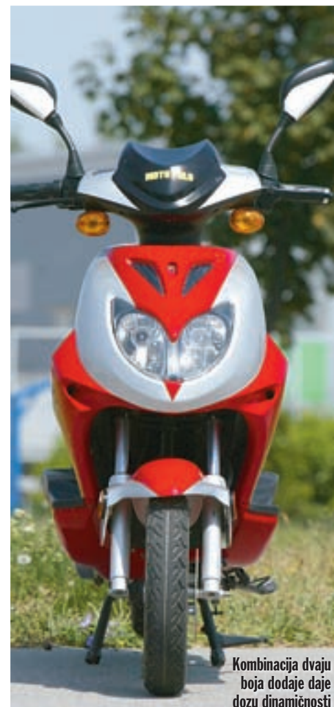
Kombinacija dvaju boja dodaje daje dozu dinamičnosti