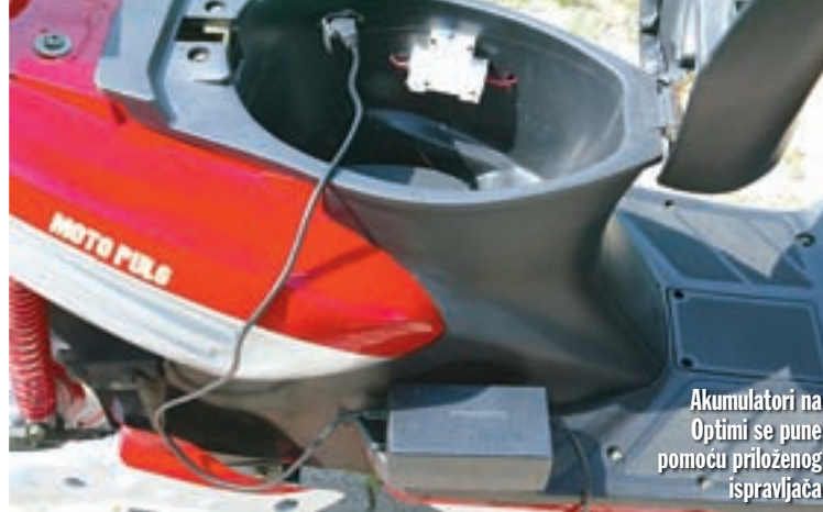
Akumulatori na Optimi se pune pomoću priloženog ispravljača

Ono što Optimu čini posebnim skuterom zapravo ju i vizualno kompromitira, jer na mjestu agregata stoji povećana nemaštovito oblikovana kutija u kojoj su smješteni akumulatori. Na žalost, to nije kraj, jer su kineski majstori dizajna procijenili da je potrebno postaviti nespretno oblikovane plastične poklopce koji bi trebali simulirati izgled klasične pogonske grupe. Ispod njih se nalazi na kraju ipak ne baš sakrivena jednostavna