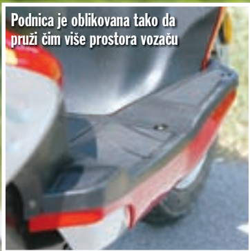
Podnica je oblikovana tako da pruži čim više prostora vozaču