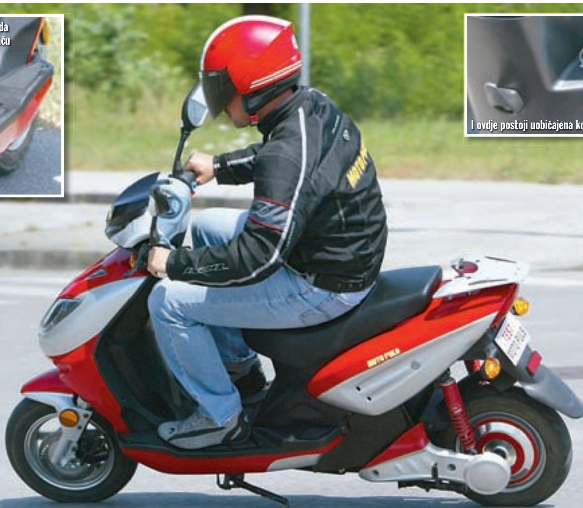
Nagib na lijevu stranu ograničava bočni oslonac