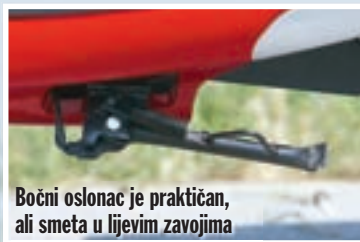
Bočni oslonac je praktičan, ali smeta u ljevim zavojima