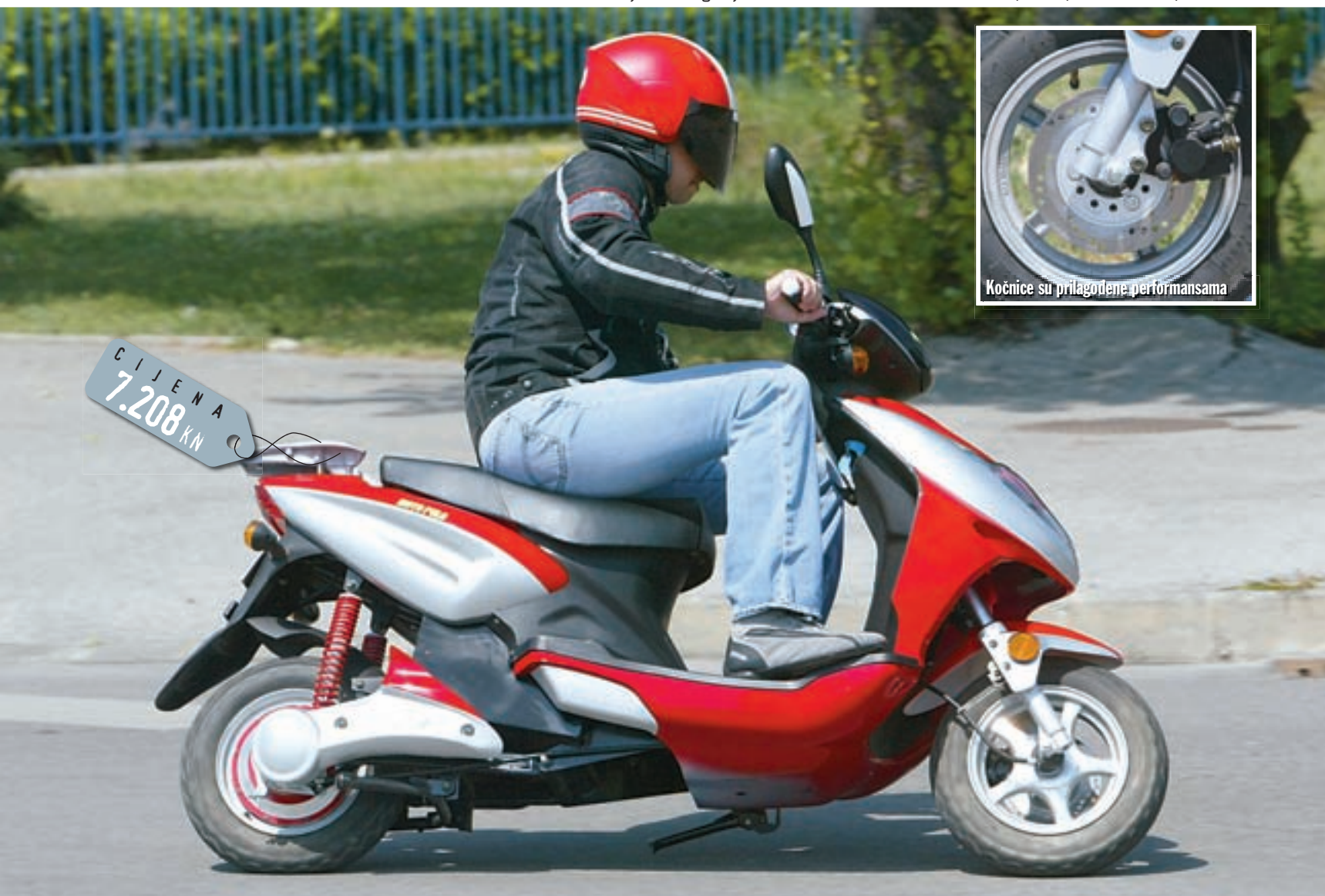
Kočnice su prilagođene performansama

skuteru, jer prednji kraj s malenim kotačem i poznatim oblikom blatobrana sigurno neće otkriti o čemu se radi. Prednja maska je oblikovana u duhu današnjeg dizajna, a na njoj su se smjestila pomalo ispupčena glavna svjetla. Na središnjem dijelu upravljača nalazi se neveliki neprozirni vjetrobran, koji skoro da stvara dojam dinamičnosti, dok su kontrolni instrumenti već viđenog oblika. Specifičnost im je da pored uobičajenog brzinomjera i brojača prijeđenih kilometara sadrže tek tri kontrolne žaruljice, od kojih niti jedna nije za količinu ili pritisak ulja. Umjesto pokazivača količine goriva na Optimi pronalazimo pokazivač