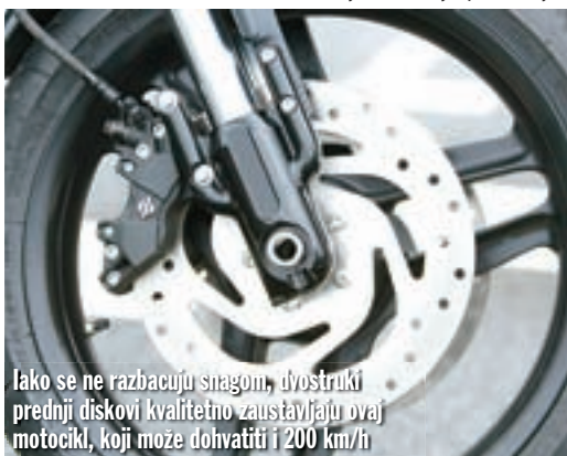
Iako se ne razbacuju snagom, dvostruki prednji diskovi kvalitetno zaustavljaju ovaj motocikl, koji može dohvatiti i 200 km/h