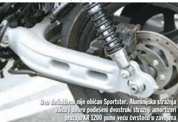
Ovo definitivno nije običan Sportster. Aluminijska stražnja vilica i dobro podešeni dvostruki stražnji amortizeri pružaju XR 1200 puno veću čvrstoću u zavojima

Od pomoći je i to što je XR i pri bržoj vožnji u zavoju vrlo stabilan i ne leluja, barem tako dugo dok ne naletite na neravninu koja zna uznemiriti motocikl. Prilikom vožnje u uspravnom položaju prednji ovjes solidno upija sve neravnine, a iako