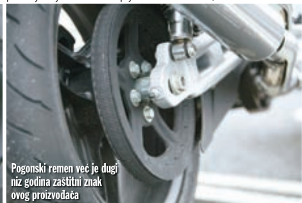
Pogonski remen već je dugi niz godina zaštitni znak ovog proizvođača