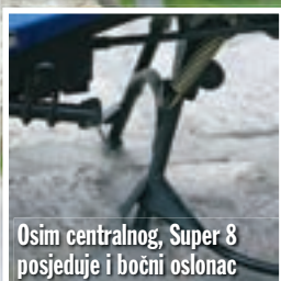
Osim centralnog, Super 8 posjeduje i bočni oslonac