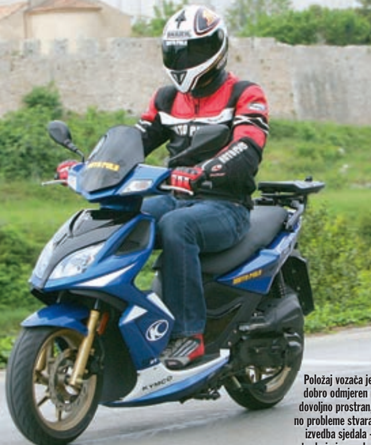
Položaj vozača je dobro odmjerjen i dovoljno prostran, no probleme stvara izvedba sjedala - tvrdo je i preusko