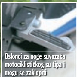
Oslonci za noge suvozača motociklističkog su tipa i mogu se zaklopiti