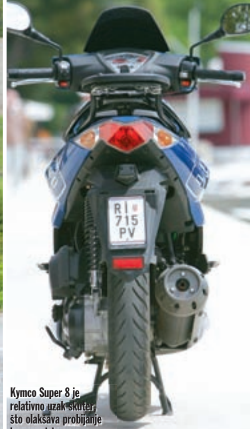
Kymco Super 8 je relativno uzak skuter što olakšava probijanje kroz gradsku vreću

što se radi o iznimno lako upravljivom vozilu koje bez ikakvih napora savladava gradske gužve. Pritom možda Kymcov sportaš nema nešto što će vas oboriti s nogu, no isto tako nema ni neke ozbiljnije mane, osim možda pretvrdog sjedala, koje je ipak možda previše negostoljubivo za ovakav skuter. Da se nalazi na nekom ekstremnijem modelu kao što su Runner, SR 50, NRG ili