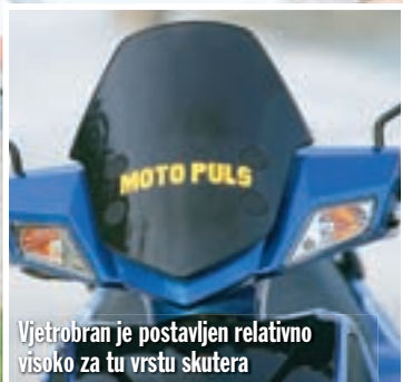
Vjetrobran je postavljen relativno visoko za tu vrstu skutera