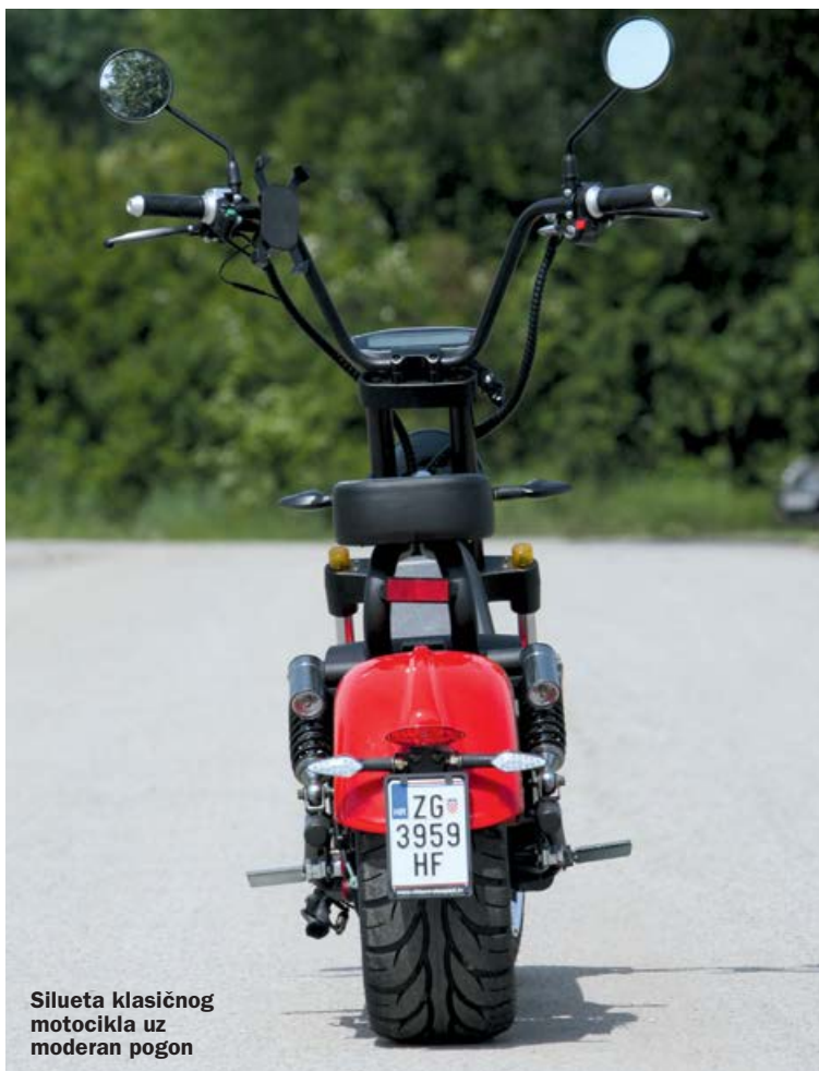
Silueta klasičnog motocikla uz moderan pogon

Klasični blatobrani, sa efektom crvenom bojom, a naljepnica za raspoznavanje